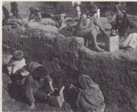
Woolley e sua moglie agli scavi di Ur