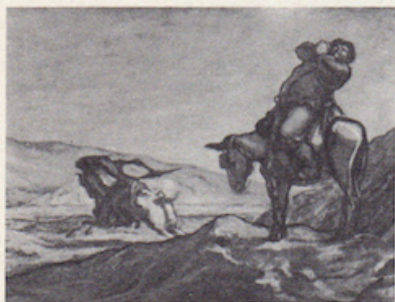
Daumier - Don Chisciotte