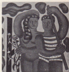
Léger (da Francastel)