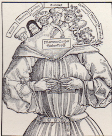
Un'allegoria della Riforma (da Renaudet)

In questo numero due traduttori di grande valore, Vittorio Bodini e A. M. Ripellino, presentano le loro versioni del Don Chisciotte e delle poesie di Pasternàk | Le teorie sulla pittura di Francastel | Le avventure archeologiche di Leonard Woolley | Saggi di Piero Pieri, Walter Maturi, Francesco Gabrieli, L. Lombardo Radice, sul Rinascimento di Renaudet, sulla Russia degli Zar e il Risorgimento italiano, sulle Crociate viste dagli storici arabi, sul « Galileo » di Geymonat | Norberto Bobbio discute l'opuscolo politico di Antonio Giolitti | Carlo Levi espone le sue teorie sull'origine del cancro.