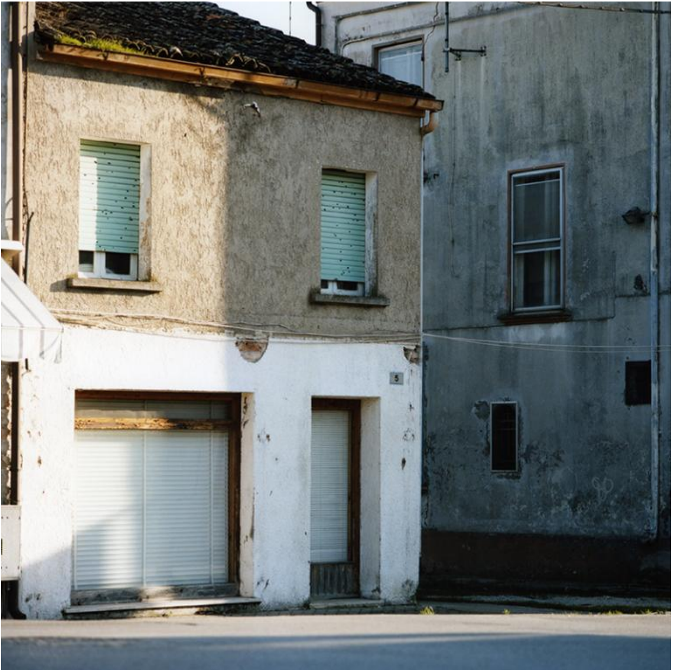
02 Romea - foto di Sabrina Ragucci, 2013

Qui i turisti non ci vengono, solo uomini d'affari, che si rinchiudono al più presto nei loro Sheraton e nei loro Hilton, e da lì più non si muovono, se non per tornare a prendere l'aereo; molto rare le cosiddette Ong e i relativi volontari professionisti; quasi del tutto assenti i giornalisti e i comunicatori vari; insomma, affari a parte, sembra proprio che della Nigeria non fregi un cazzo a nessuno. Qui, penso, non potrai mai nemmeno fare una passeggiata senza essere notato. In quanto bianco in mezzo ai neri - con tutto ciò che questo significa, ovvero per quanto muove, nel profondo, di oscuro e di irrazionale. Tutti gli altri pallidi, intendo quelli sbarcati con me - circa una dozzina, tutti appunto uomini d'affari,