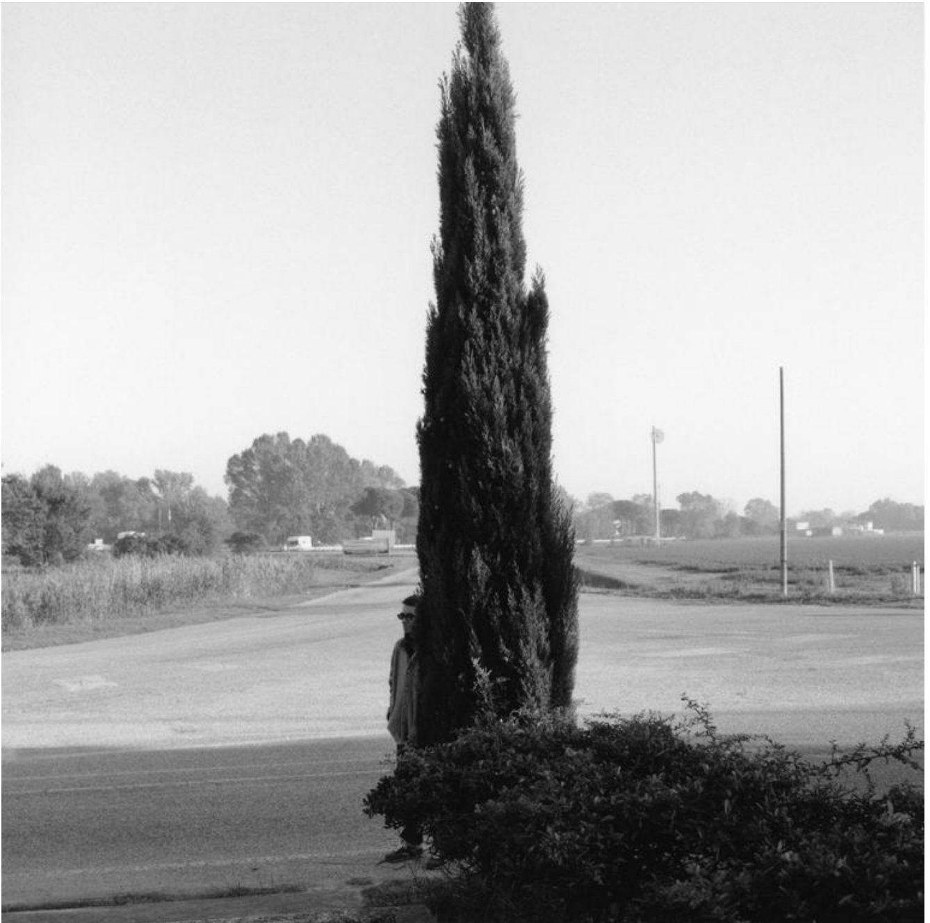
01 Romea - foto di Sabrina Ragucci, 2014

La stessa superiorità di cui, per una volta, disponevo anch'io. Fatte le debite proporzioni s'intende, non essendo chi scrive un Pasolini, né artisticamente né, soprattutto, economicamente; e, ciò che più conta, non avendo in sé la benché minima vocazione al martirio, meno che mai omosessuale – il martire etero, del resto, non esiste. Perciò, nessun tormento spirituale che mi dilaniasse l'anima: io volevo solo scopare e le mie marchette erano femmine. E siccome non avevo tanti soldi, e le puttane africane costavano meno, erano nere. Ma a parte l'aspetto economico, c'era anche forte tutta la mia innata passione per la negritude, sia in senso artistico (all'epoca, tra l'altro, ero il batterista di un gruppo