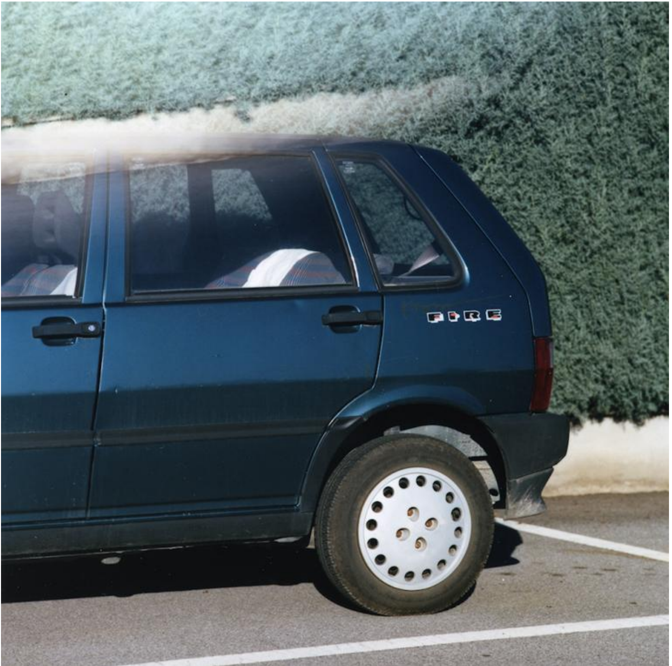
03 Romea - foto di Sabrina Ragucci, 2014

magari 30), anche se era sempre stato da lì che tutto era iniziato; poi magari, forse perché parlavo inglese, trovavo un interesse che andava oltre la semplice scopata. Se questo interesse per così dire umano fosse reciproco, e in che misura, è difficile giudicare. Quel che è certo è che, con loro, per scopare non pagavo più, o almeno non in soldi. Poteva essere un servizio taxi, stazione posto di lavoro e viceversa; oppure, specie d'inverno e nelle notti di pioggia, un semplice giro in macchina, lungo abbastanza da riuscire a scaldarsi; o un letto per la notte. E poi non è detto che ogni volta finisse con una scopata. Spesso, ma non sempre.