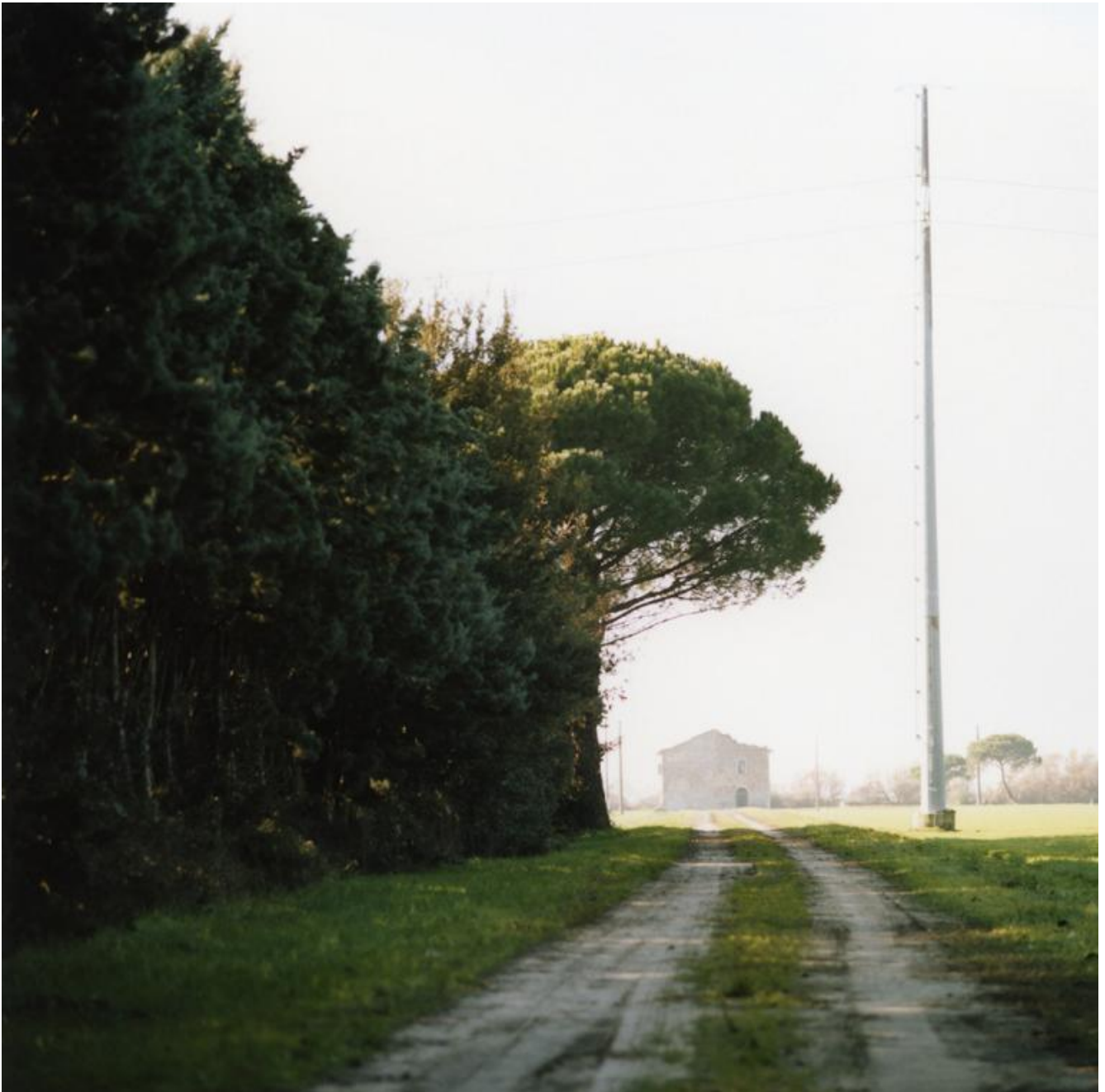
04 Romea, 2014

andrea cortellessa — Alla maniera di Bernhard, come sempre, anche questo tuo testo ha un sottotitolo falsamente “rematico”, direbbe un narratologo, tale cioè da esplicare la natura del testo. Ma scrivere Un impatto ambientale , come Un crollo dopo Il ponte (o Una segregazione dopo Il freddo ), non equivale a scrivere “Romanzo”, sotto il titolo d’un testo. Con quale intenzione mutui questa dizione, diciamo, ecologico-burocratica?