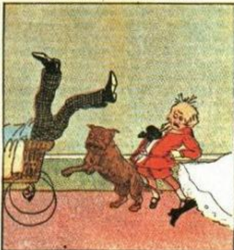
8. Di terror strillano in coro Mimmo, Mammola e Medoro.