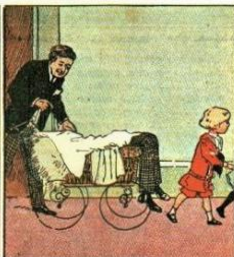
5. Ma il papà ch'era nascosto del fantoccio prende il posto.