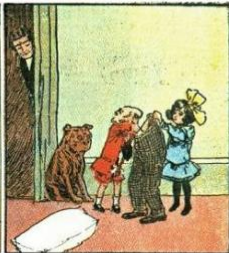
3. Imbottisco come va i calzoni di papà. ..