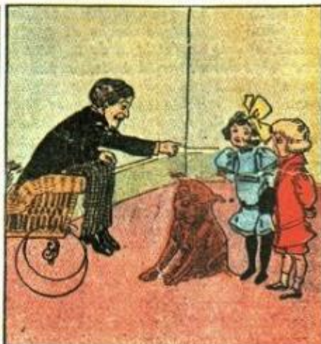
9. Chi vuol fare l'altrui danno ha le beffe ed ha il malanno.