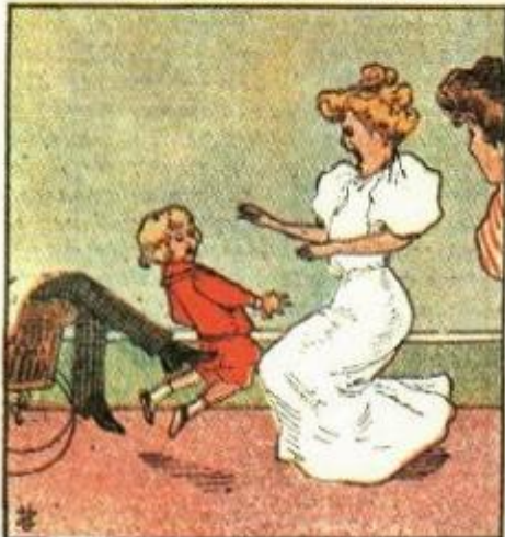
7. Queste gambe son fatate. Ahi, mi pigliano a pedate. ..