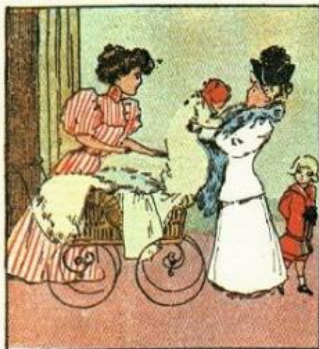
1. Bianco e rosso e tondolino, oh che amore di bambino!