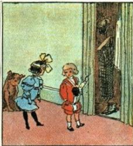
2. Dice Mimmo a Mammoletta: " — Or facciamo una burletta.