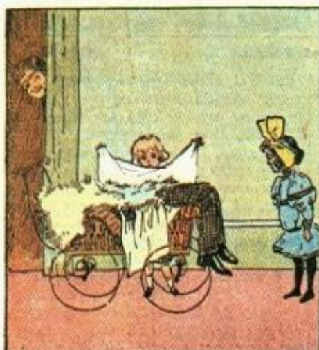
4. Dice Mammola: " — Che tomo! .. Par che in cuna ci sia un uomo! ..