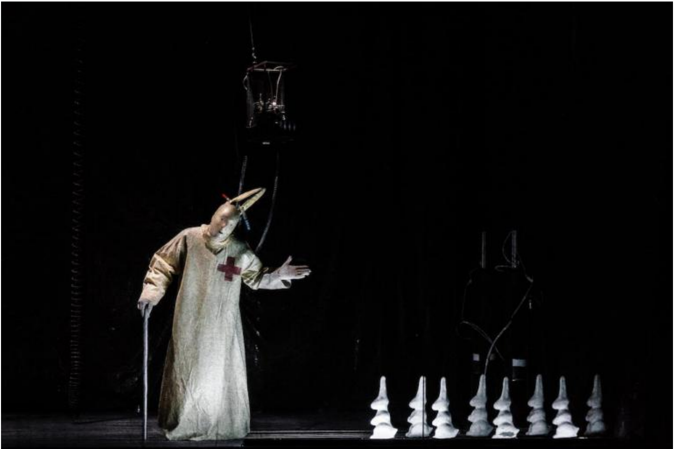
Corifeo e coro, ph Guido Mencari, Parigi, 2015.

C'è tanto che rimanda all'infanzia in questa Oresteia della Societas, dalle "favole" tremende che fanno capo al Paese delle Meraviglie alla leggerezza del ritorno trionfale di Agamennone, dai conigli veri e finti del Coro all'agghiacciante ambientazione tutta in bianco delle Coefore , fra scarpine, lettini, animaletti, maschere e cappelli a punta, paroline e parolacce, quasi giochi fra attori e personaggi. Ma lo spettacolo rimanda in modo piuttosto diretto a una parte dell'infanzia che fa una paura inaffrontabile, quel terrore vero, perpetuo e non del tutto comprensibile che accompagna l'essere bambini: i coniglietti del Coro esplodono con gran fragore poco dopo l'inizio per mano di Egisto, che poi tortura il Corifeo appeso per le lunghe orecchie, mentre restano infine soltanto odore di zolfo e sangue (una posizione sulla potenzialità o meglio inattività dialettica del coro che sarà poi confermata nella Tragedia Endogonidia ); le apparizioni degli animali (prima due cavalli scuri e poi un asino bianco) sono inquietanti nella loro inafferrabilità retinica e concettuale; i rapporti fra Elettra e Oreste, accompagnato da un Pilade altissimo, tutti e tre dipinti di bianco, hanno esplicitamente l'aura leggera del gioco e insieme un risvolto pesantemente macabro, sadico. Su di loro, fra l'altro, domina Agamennone: non il suo fantasma o ricordo, ma il cadavere di un capro che si eleva a mezz'aria dalla sua tomba, viene reso nuovamente vivo e