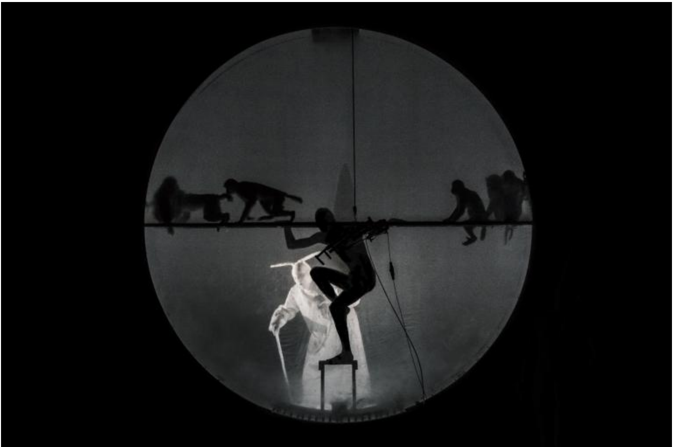
Erinni, ph Guido Mencari, Parigi, 2015.

La tragedia e la sua improponibilità, oggi: le sue rovine, simili e diverse da quelle, devastanti, che chiudevano il Giulio Cesare del 1997, sedie di cinema bruciate e due ragazze anoressiche, ossa, ossa e occhi, che trascinarono per il palco nei loro corpi la morte per suicidio di Bruto e Cassio dopo la battaglia di Filippi.