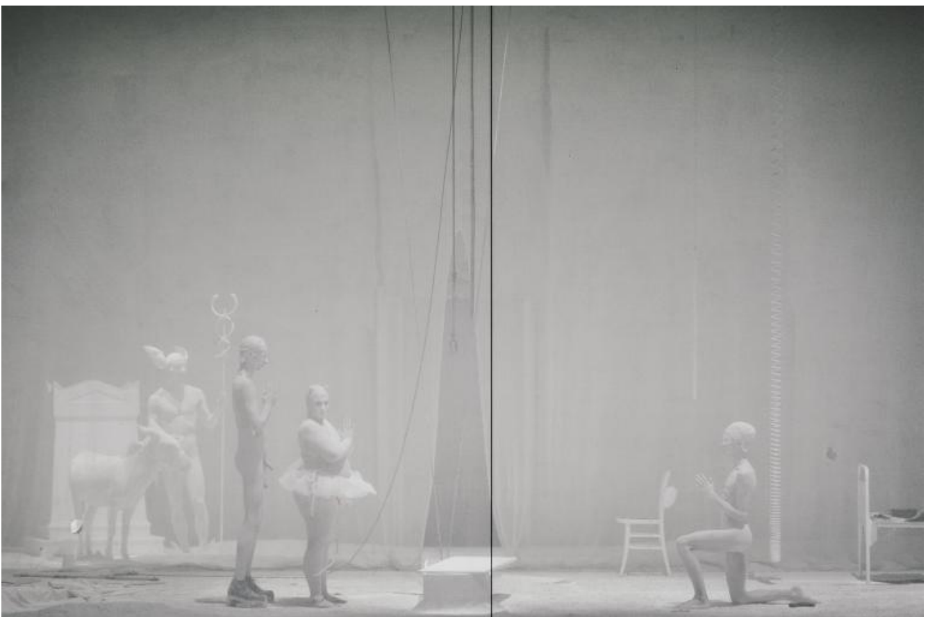
Oreste, Pilade, Elettra, Hermes, ph Guido Mencari, Parigi, 2015.

Ma - come è noto - nelle tre date delle repliche al teatro Argentina in occasione di Romaeuropa, questa terza parte dello spettacolo non è potuta andare in scena, per un "vizio procedurale" che ha coinvolto festival e Prefettura nella "richiesta di autorizzazioni per il coinvolgimento in scena di animali classificati come esotici", come dichiara la compagnia. Le Eumenidi si spostano in qualche modo a mo' di prologo, con le parole di spiegazione e racconto che lo stesso regista ha offerto al pubblico dal palco dell'Argentina; restano un punto di arrivo anelato e - si sa fin da subito - irraggiungibile, lasciando solo immaginare le tanto richiamate strida di scimmie, il fascino raccontato da qualcuno della personificazione delle statue mutile dell'antichità nella figura di Apollo, il presagito ritorno del fuoco iniziale con la promessa seppur ambigua della sua estinzione.