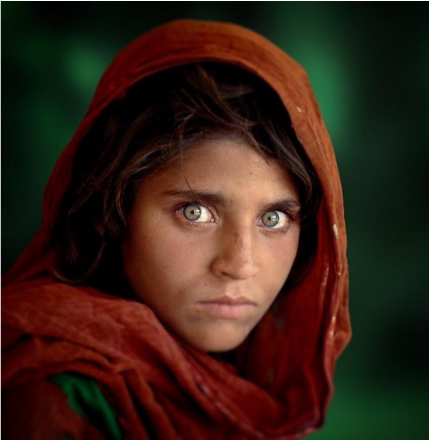
SharbatGula

L'immaginario globale sui pashtun si nutre del discorso coloniale che li ha costruiti come soggetti belli e violenti. I pashtun sono belli, come bella era Sharbat Gula, la bambina resa famosa dagli scatti di Steve McCurry. Come milioni di profughi afgani, Sharbat è stata recentemente ritrovata in un campo rifugiati in Pakistan, repatriata e persino ricevuta dal presidente Ashraf Ghani. Ma i pashtun sono anche una razza marziale secondo le gerarchie razziste (post)coloniali, sono guerrieri, coraggiosi, violenti. Questo ben radicato stereotipo si fonde con la quasi automatica equazione tra un'intera e variegata etnia, divisa in due paesi da confini imposti dagli inglesi, e i talebani. In particolare, la valle di Swat è diventata l'epitome della barbarie talebana: un luogo dove la violenza non risparmiava neanche le ragazzine, come il premio Nobel