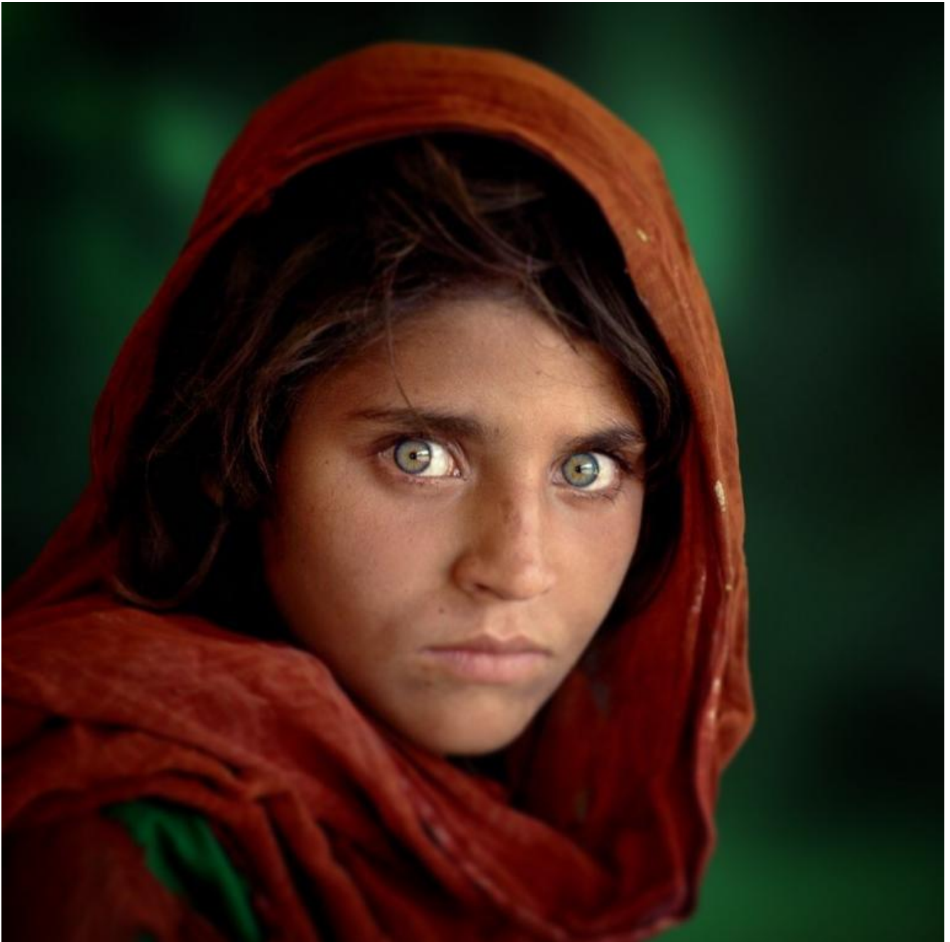
SharbatGula

L'immaginario globale sui pashtun si nutre del discorso coloniale che li ha costruiti come soggetti belli e violenti. I pashtun sono belli, come bella era Sharbat Gula, la bambina resa famosa dagli scatti di Steve McCurry. Come milioni di profughi afgani, Sharbat è stata recentemente ritrovata in un campo rifugiati in Pakistan, repatriata e persino ricevuta dal presidente Ashraf Ghani. Ma i pashtun sono anche una razza marziale secondo le gerarchie razziste (post)coloniali, sono guerrieri, coraggiosi, violenti. Questo ben radicato stereotipo si fonde con la quasi automatica equazione tra un'intera e variegata etnia, divisa in due paesi da confini imposti dagli inglesi, e i talebani. In particolare, la valle di