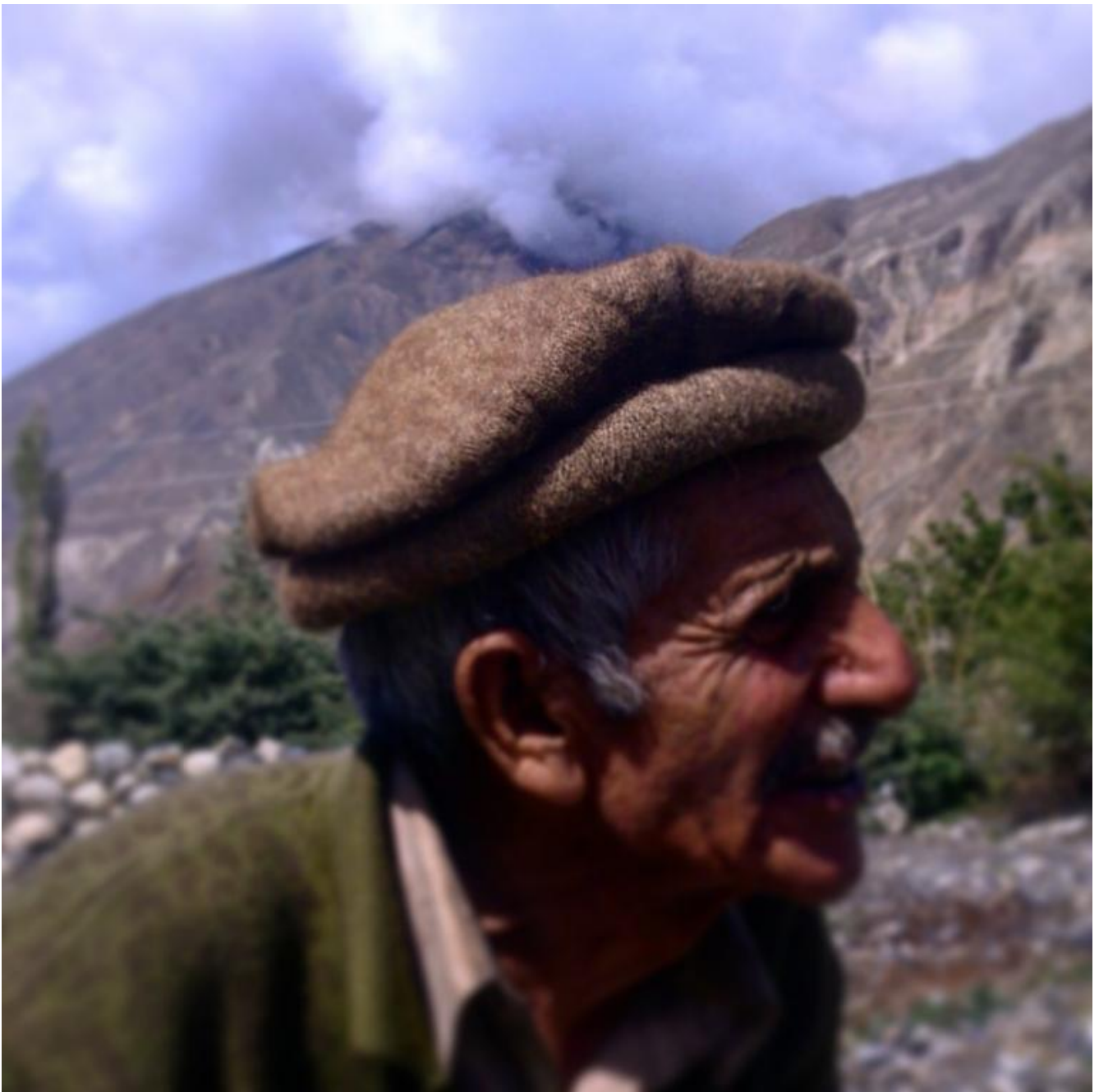
ChitraliTopi, ph G. Gioli.

e reso celebre da un'infinita teoria di pellicole hollywoodiane e serie televisive.