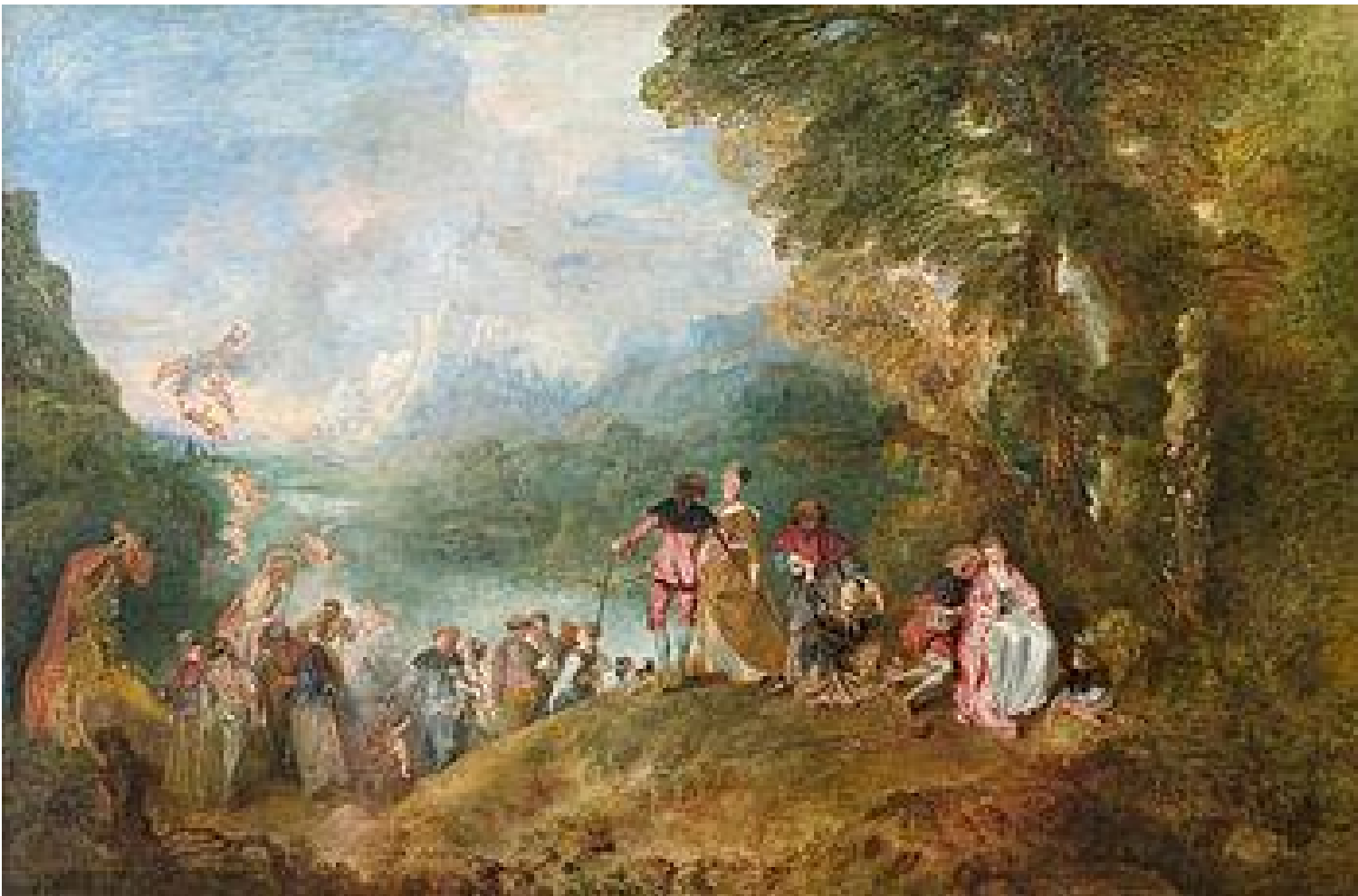
Antoine Watteau, L'embarquement pour Cythère , Paris, Louvre.

Ed è questo, appunto, il senso ultimo del monumentale allestimento dell'opera eponima, a Palazzo Cicogna: ispirata a una festa galante dell'eterno Settecento, L'embarquement pour Cythère dell'amato Antoine Watteau. Una nave di fortuna (come quella allestita da un naufrago sulla sponda del tempo), costruita con oggetti tutti provenienti dal suo studio: calchi ermafroditi da statue classiche, L'indifferent dello stesso Watteau en abîme , trasparenze di vetro, fantasmagorie di cornici dentro le cornici, un leggio, non manca la sedia rovesciata; cigni trasparenti, perfettamente immobili, trainano il tutto.