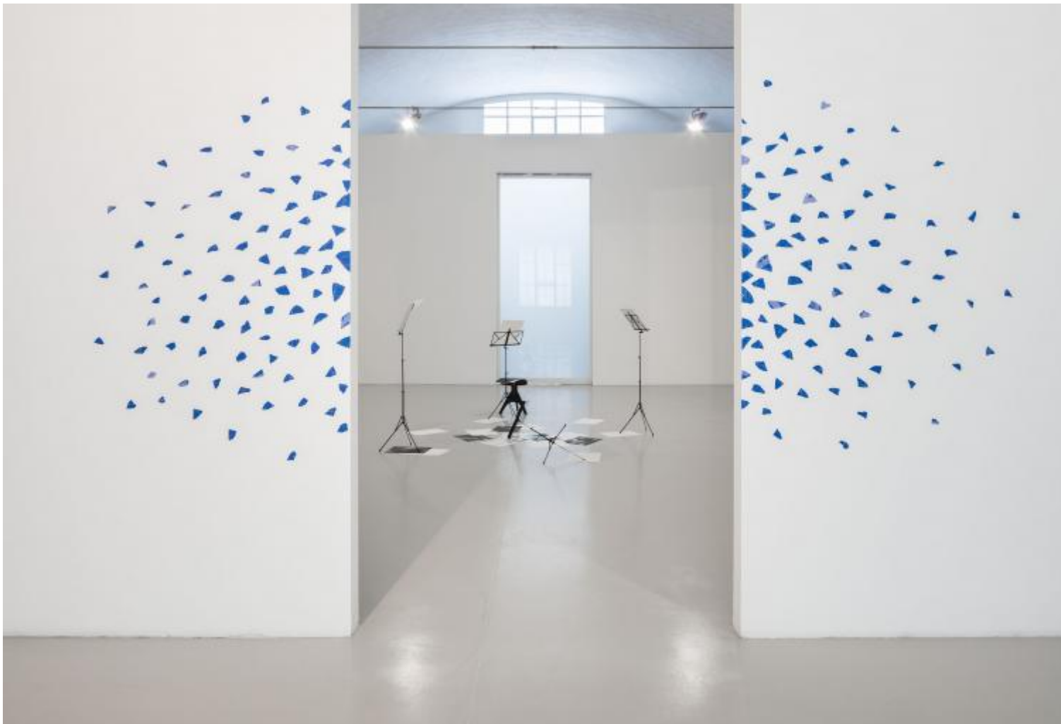
Giulio Paolini, Vedo la decifrazione del mio campo visivo, versione carta delle stelle 1984-2016. Courtesy artista e galleria Christian Stein, Milano.