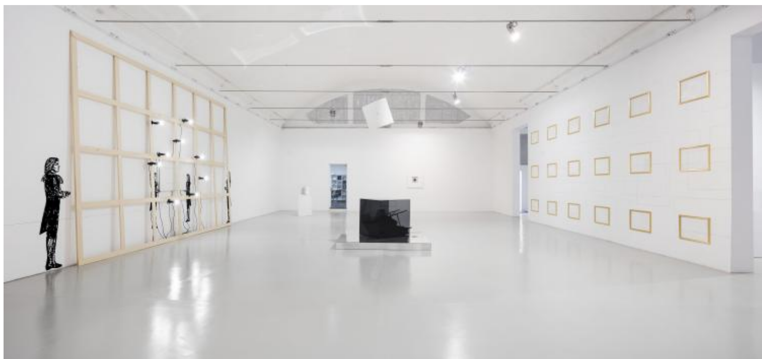
Giulio Paolini, Fine , galleria Christian Stein, sede di Pero. Courtesy artista e galleria Christian Stein, Milano. Foto Agostino Osio.

A Milano in novembre può far buio alle quattro, «come alle Svalbard» (© Francesco Targhetta). E poi Pero, amministrativamente, non è neppure Milano. Tocca arrivare al capolinea della metro e poi fare più d'un chilometro a piedi, nella bruma, con questa «solitudine in giro [...] / sull'umido asfalto», come ritraeva Ungaretti questa città. Facilissimo infatti è «tentennare», fra i capannoni industriali ed ex-tali: la scritta «Galleria Christian Stein», al cancello di uno di loro, è pressoché impercettibile.