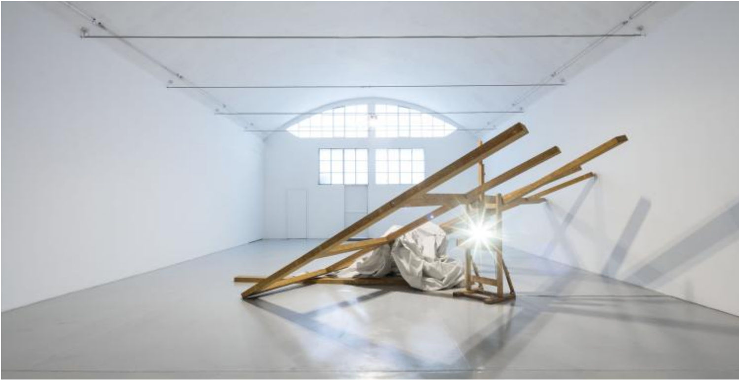
Giulio Paolini, Hic et nunc. Le radeau de la meduse , 1991. Courtesy artista e galleria Christian Stein, Milano. Foto Agostino Osio.

dimostrativo»). L'imbarco è interdetto, come appunto l'estasi. E la nave arenata fa eco a quella di un altro remake esposto a Pero, il diversamente monumentale Radeau de la Méduse (1991, da Géricault).