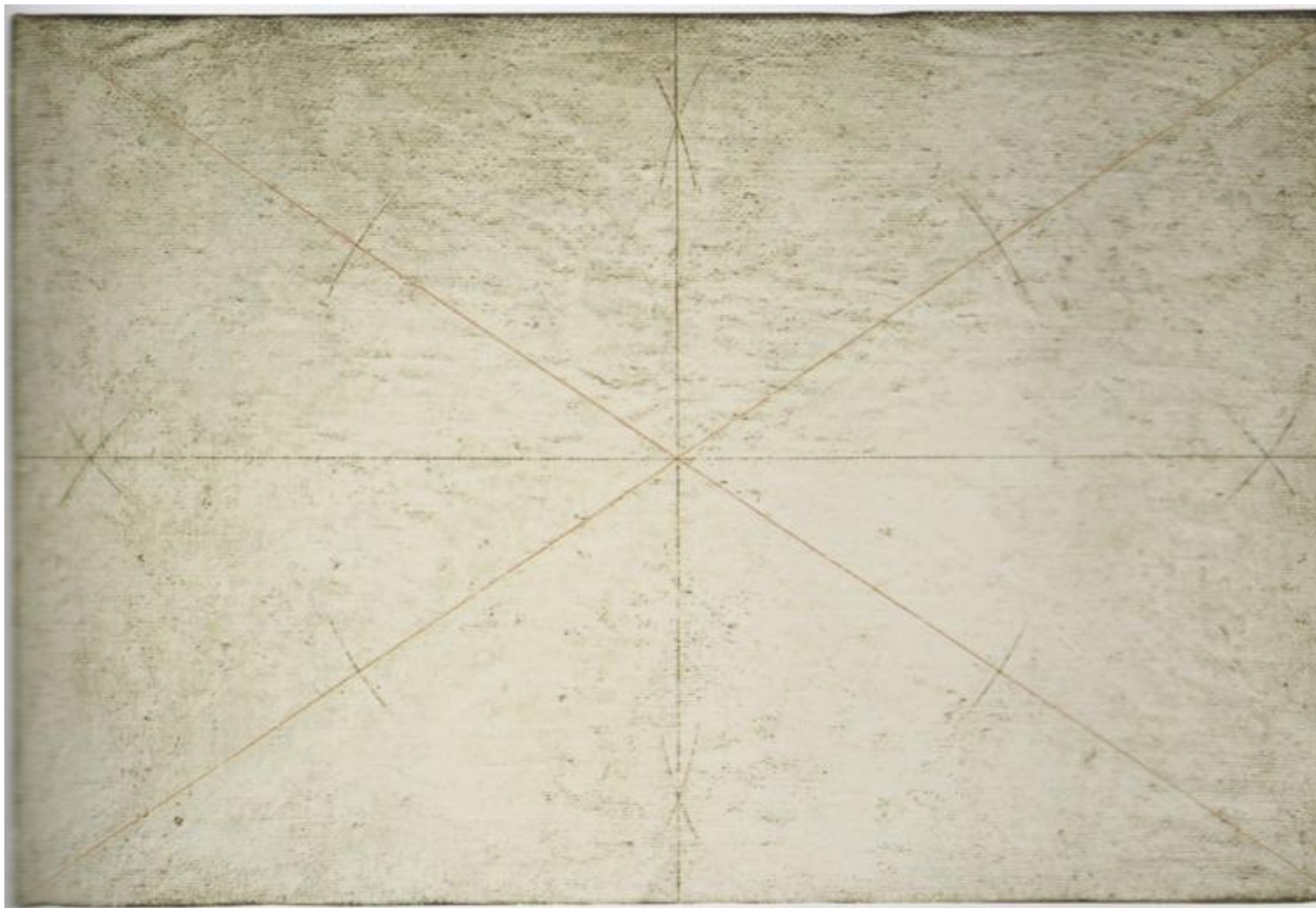
Giulio Paolini, Disegno geometrico , 1960. Fondazione Giulio e Anna Paolini.