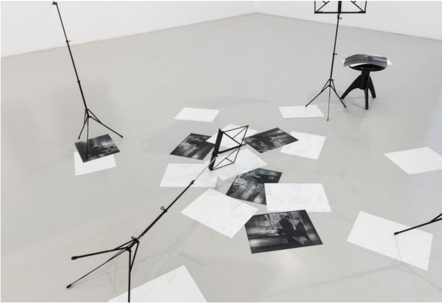
Giulio Paolini, Scene di conversazione , 1982-83. Courtesy artista e galleria Christian Stein, Milano. Foto Agostino Osio.

In Galleria si trova anche, non esposto (a differenza di altri libri, pseudobiblia in verità) ma come a foglio di guardia dell'insieme, un bellissimo libro d'artista. Uno dei tanti di Paolini, ma questo – per la complicità delle edizioni Colophon di Egidio Fiorin – davvero monumentale ( Orfano e celibe , 48 pp. su nivea carta a mano, cm 42 x 31), nonché sorprendente. Perché gli autocommenti dell'artista sono impaginati in versi (racconta Paolini che la scansione s'è prodotta in modo quasi incosciente; sicché esclude «l'intenzione di valenza poetica» a quanto ha «“trascritto” in versi»: si può convenire con lui). A un certo punto vi si legge: «Guardo sempre volentieri un libro antico: / posso anche non leggerlo / (qualcuno lo ha già letto). // Il luogo però deve essere perfetto: / la lampada già accesa, la stanza silenziosa, / tutto deve essere al suo posto». Quello in cui mi trovo è il white cube per eccellenza, e ogni mostra di Paolini è una mostra alla potenza: il luogo dove viene convocato, cioè, quello che per lui è l'eterno intemporale parmenideo dell'arte. Perché si compia questo rito quasi sciamanico, però, il luogo deve essere perfetto , prossemicamente determinato al centimetro – e questo lo è.