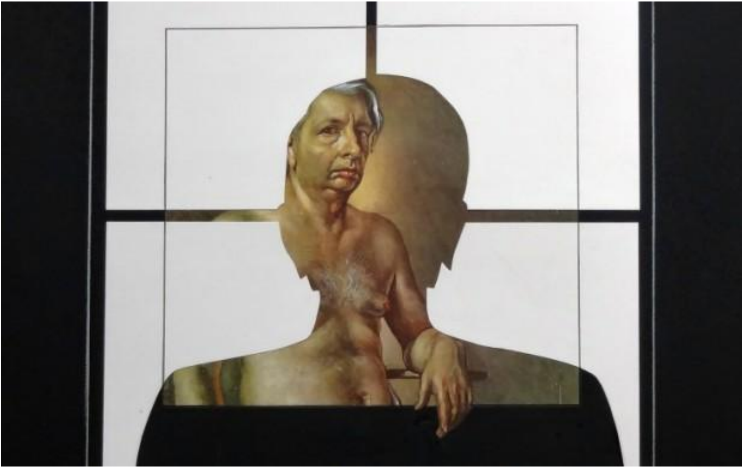
Giulio Paolini, Autoritratto nudo, 2014-2015