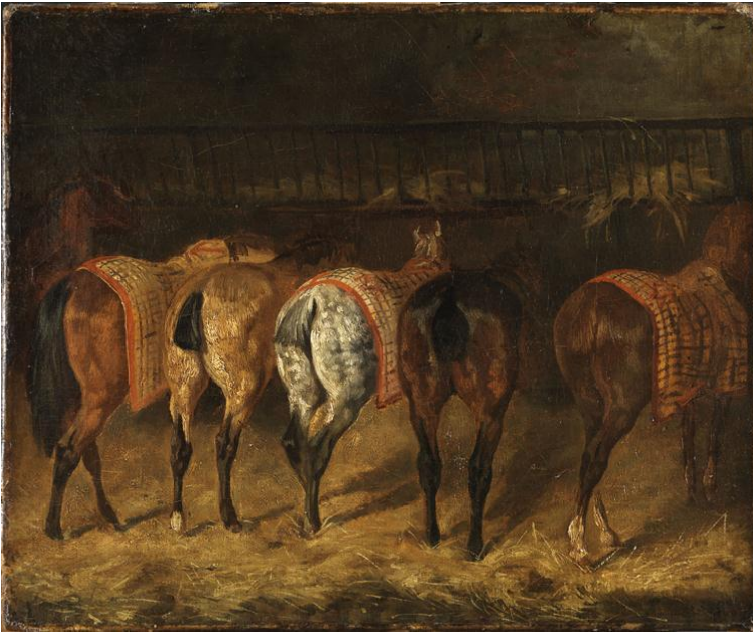
Gericault, cinq chevaux.