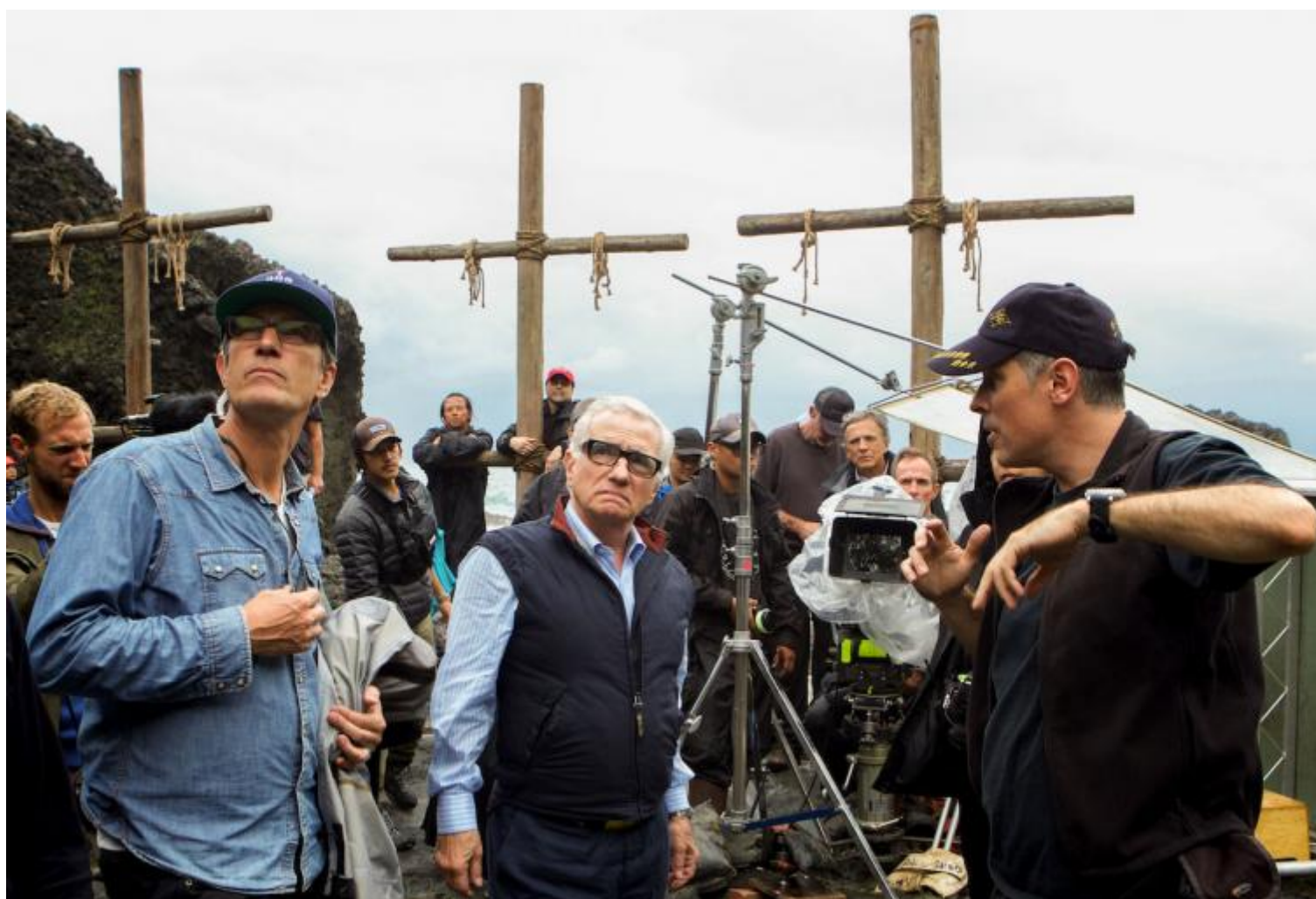
Martin Scorsese (al centro) sul set del film.

Silence è l'unico film che Scorsese poteva e doveva fare dopo Al di là della vita , l'ultimo suo lavoro veramente personale, l'ultima prova inconfutabile della tenuta del suo cinema (un cinema espressionista, estremo nei sentimenti e nella violenza, carico di religiosità, blasfemia, allucinazione, rigore, passione), prima che il '900 finisse, prima che il digitale stravolgesse tutto, prima che Scorsese stesso fosse canonizzato in "maestro" ed entrasse nella fase meno fervida, meno spontanea, più compromessa e non sempre lucida della sua filmografia.