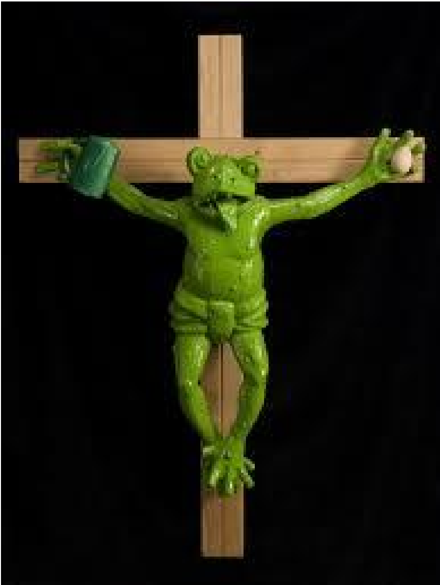
Martin Klippenberger, Rana crocifissa, Museion, Bolzano 1988.

Sarà allora di buon augurio la proposta del verde Pantone 15-0343? Oppure dietro alle immagini laccate di un piccolo hortus conclusus sul terrazzo di una città moderna, accanto a un grattacielo grigio-azzurro, vediamo spuntare alcune immagini inquietanti dell'arte contemporanea? Solo due esempi: il Green Knight in Lego , realizzato dall'artista statunitense Nathan Sawaya con i famosi mattoncini e la Rana crocifissa di Martin Kippenberger, esposta postuma a Bolzano, nel Museion, e subito ritirata sotto l'accusa di blasfemia e che forse ha provocato l'allontanamento da Bolzano della direttrice, Corinne Diserens.