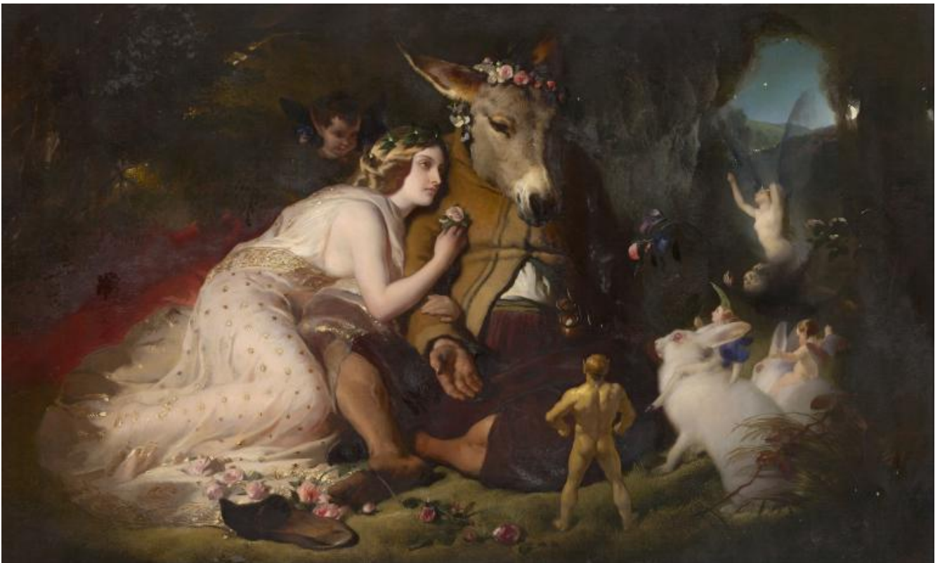
Edwin Landseer, Scene from A Midsummer Night's Dream. Titania and Bottom, 1851.

sono principesse belle e stupide. E allora? Bisogna credere alla bellezza? E alla bruttezza? Biancaneve, si fida della bruttezza della strega, scambiandola per quella, accettabile, di una decrepita vecchina, e non si accorge che quel che vede è il volto vero e turpe della sua malvagia, ma splendida, matrigna. Insomma il gioco è dinamico, la bellezza e la bruttezza nella fiaba non rispondono a una regola unica, ma cambiano continuamente le carte in tavola, così come nell'esistenza umana soggetti a mutamento sono i volti e i corpi, che dalla nascita alla morte cambiano di continuo, e di noi danno agli altri immagini sempre diverse, e ambigue, di quel che siamo.