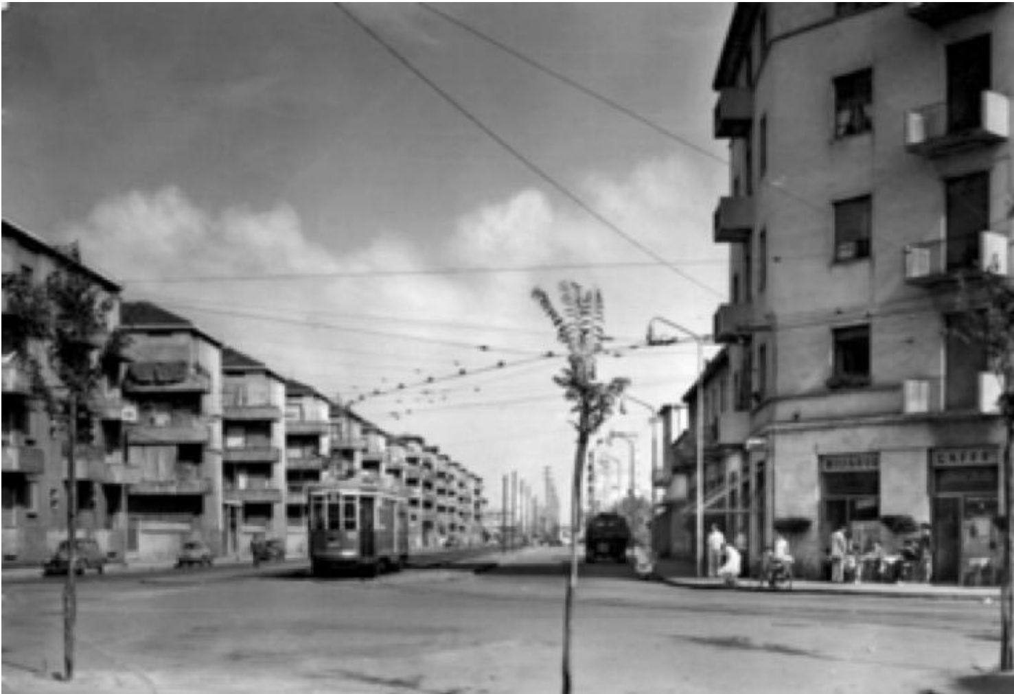
Milano, via Giambellino.

La prima sezione di Incontri e agguati chiama in causa la morte, il più irriducibile nemico dell'essere umano. Il confronto con questa realtà, soprattutto in alcuni momenti, è talmente forte da diventare una lotta corpo a corpo, una guerra di trincea?