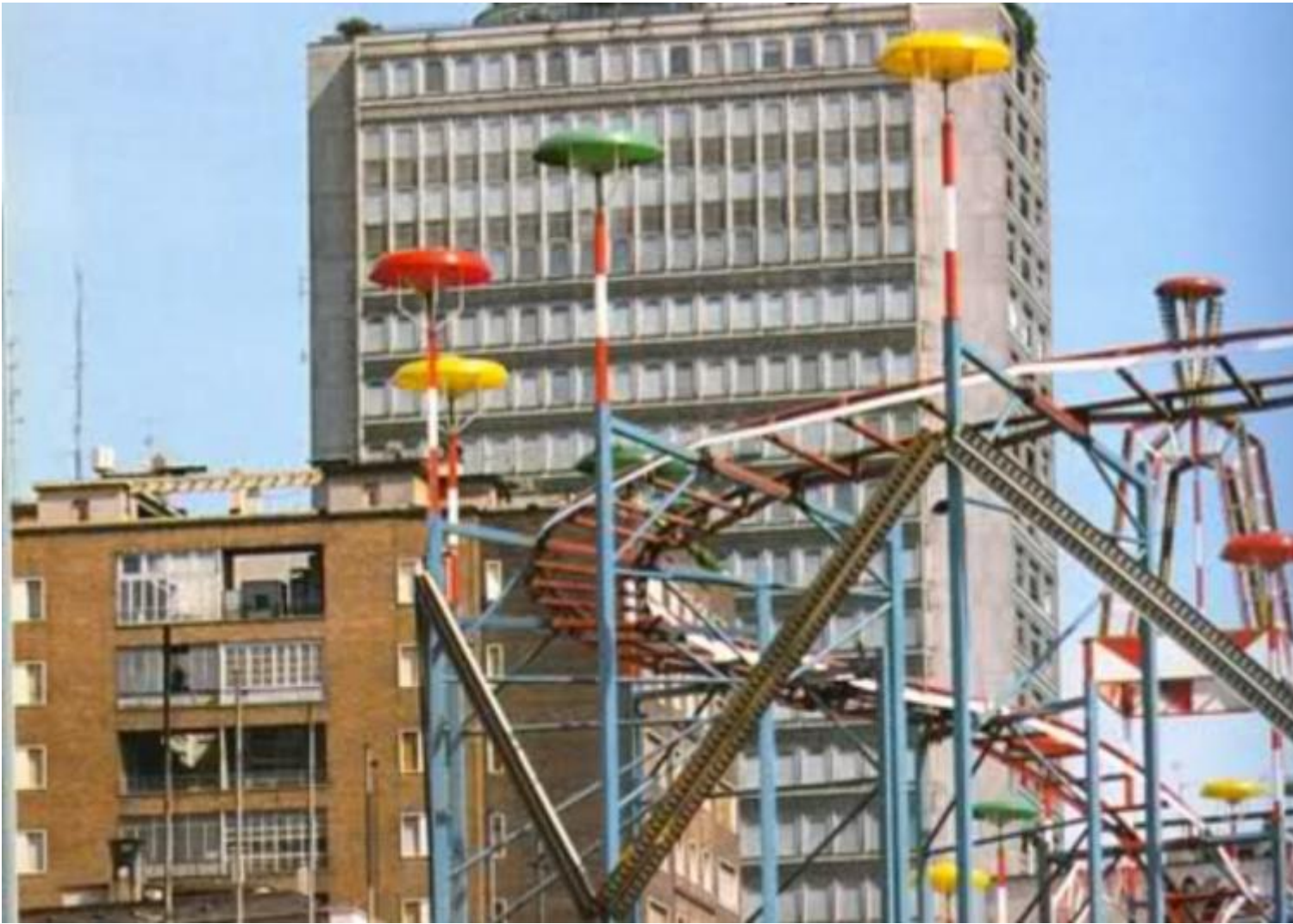
Milano, Luna-Park delle Varesine.

Non solo la morte in agguato, ma anche tanti incontri dolorosi con “anime vaganti”, persone bruciate dalla tossicodipendenza o dal carcere, che hanno perso il “vigore cosmico” e “la giovinezza di frutteti”. In questi incontri, il nulla non è un male interiore, ma una realtà concreta che lentamente vampirizza e priva della vita. Come sono nate le poesie della seconda sezione? Qual è il corto circuito tra il senso di rifiuto e, allo stesso tempo, di amore verso queste persone tanto provate?