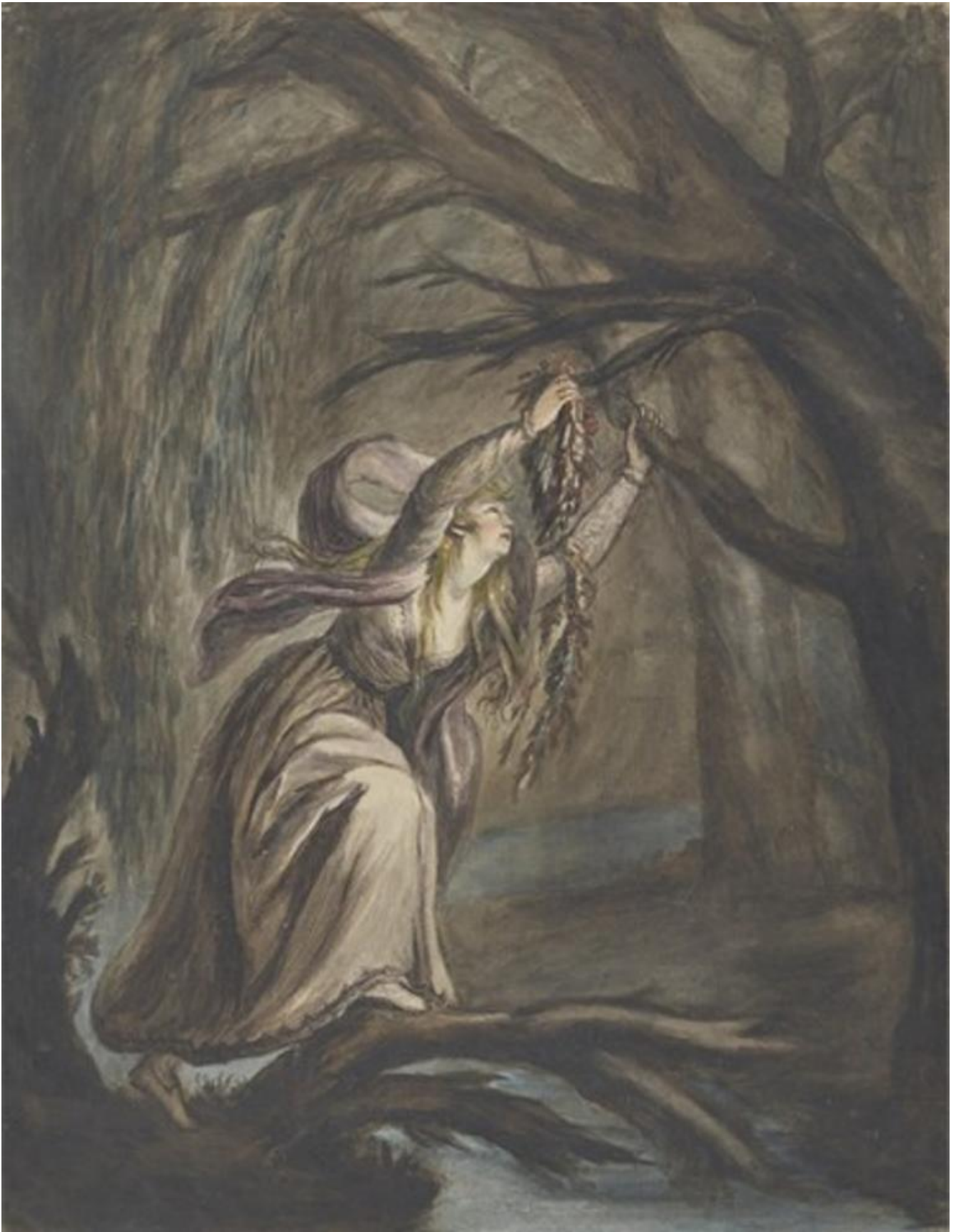
Hoare Mary, La morte di Ofelia.