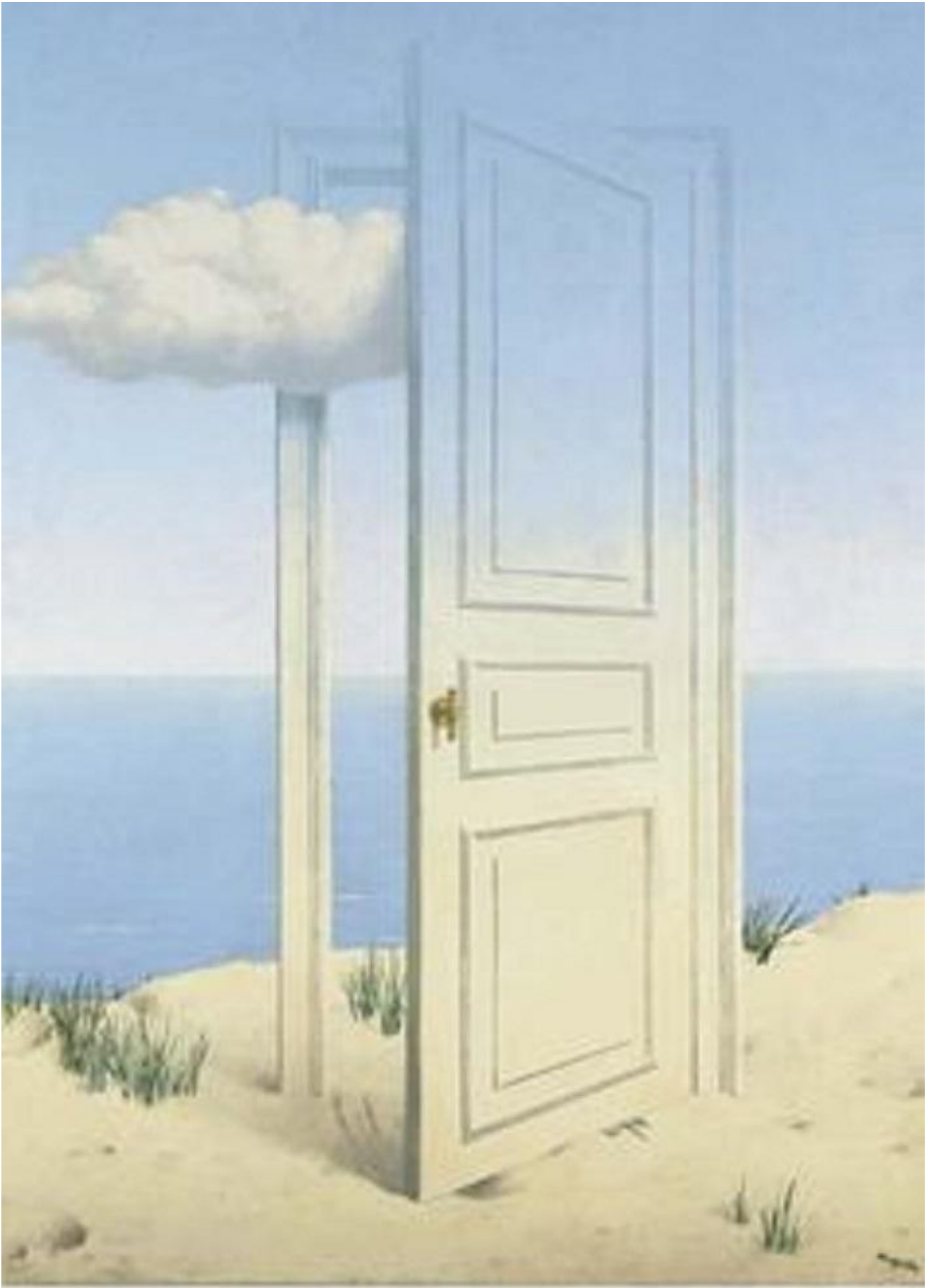
Magritte, La traversée difficile (1946).