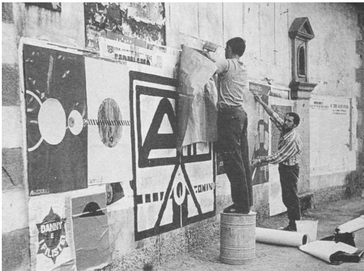
Lavori di affissione, Fiumalbo 1967.

“ Raccolti qui in tendopoli / da Voi sovvenzionati / quei capelloni luridi [...]”