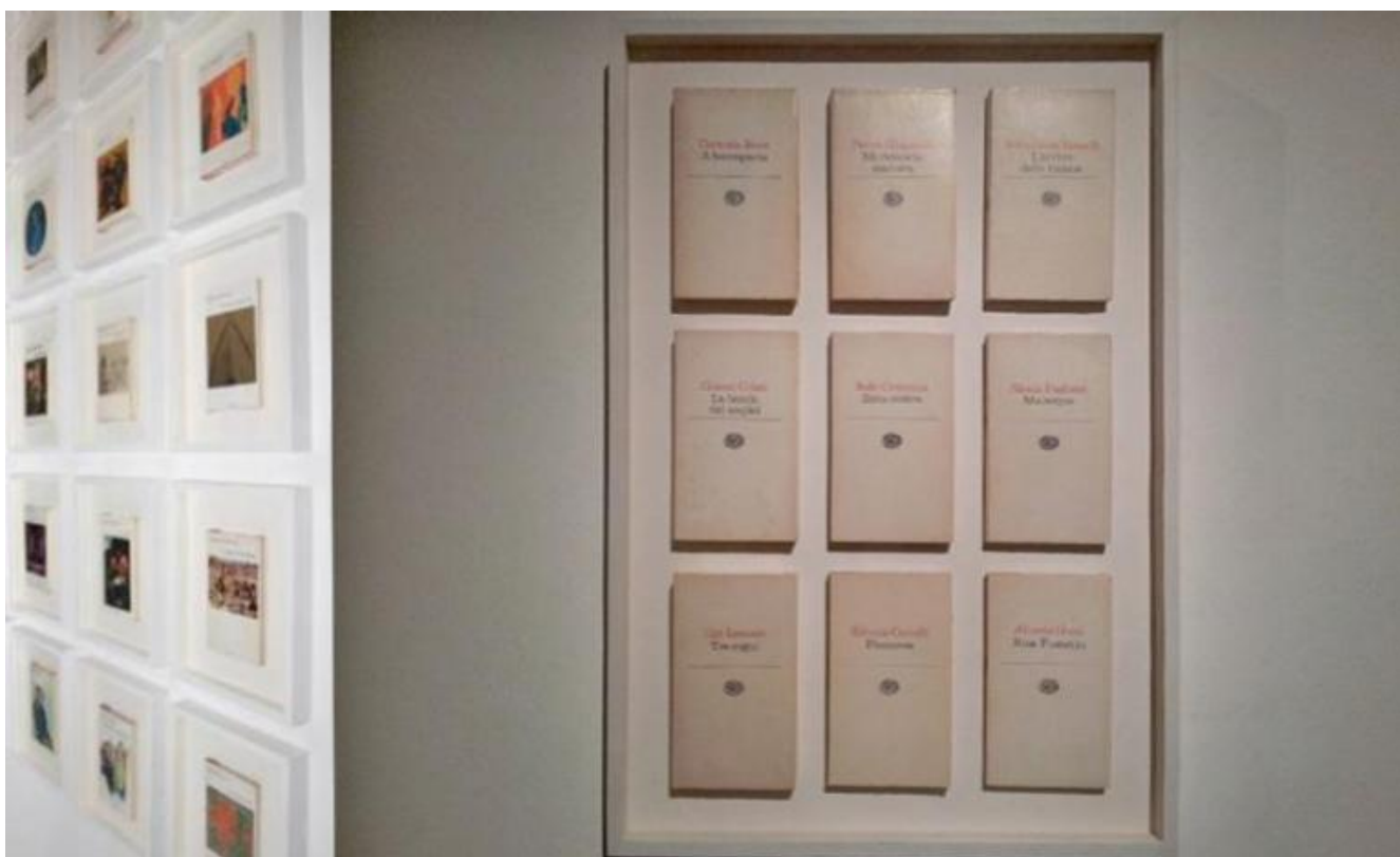
Dettaglio della mostra "Giulio Einaudi. L'arte di pubblicare".

In conclusione, sulla superficie di un foglio, sia esso quello delle diverse versioni de I Coralli o quello della tavola grafica nel formato B2 500×707 millimetri (la serie B dei formati è definita in rapporto alla serie A) sulla quale lo studente di una scuola d'arte sviluppa le sue idee, scrittura e arti visive dialogano tra loro usando il linguaggio matematico della proporzione, per dar luogo a strategia di pensiero che è insieme anche visione.