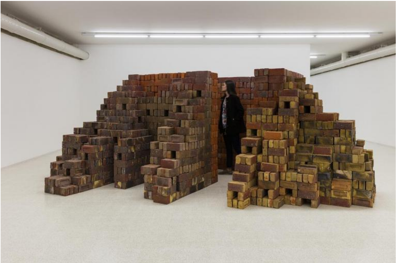
Elisabetta Benassi. Zeitnot, 2017. Cinquemila mattoni refrattari inglesi / five thousand English firebricks, 175 x 500 x 380 cm.

Ecco, questo timore atavico smuove lo spettatore e lo invita a entrare in relazione con le opere accettando la disfatta delle proprie certezze, facendosi carico della responsabilità di costruire in autonomia un nuovo senso da assegnare alle cose, abbandonando la condizione rassicurante del passato per partecipare all'evento che non può che essere qui e ora. Un presente che è la condizione del lavoro di Benassi, teorizzato da Walter Benjamin nella sua accezione di rifiuto del tempo continuo di produzione capitalista e condizione necessaria al balenare dell'immagine d'arte - e oggi drammaticamente attuale, tramutato in un flusso continuo di lavoro astratto, de-corporeizzato, parcellizzato - e come momento di sacralità laica in cui il tempo diviene accadimento liberato. Una forzatura temporale che aveva inchiodato al muro come un Cristo alla croce il libro di Antonio Gramsci edito nel '51, nell'opera Passato e presente (2013), o che aveva fatto deflagrare il singolo istante in Arreter le jour (2014), performance in cui l'artista sparava letteralmente a degli orologi. Un presente espanso e in cui la non-linearità interpretativa obbliga lo spettatore a fare i conti con la complessità