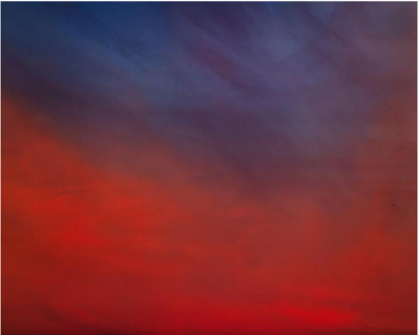
Paglen, Untitled (Reaper Drone), 2010.

Untitled (Reaper Drone) (2010), ad esempio, raffigura un deserto all'alba; le sfumature rosso, blu e viola sono simili a un quadro astratto se non fosse per quel punto nero in alto a destra che, a uno sguardo più attento, si rivela essere un drone. Per un geografo come Paglen, il drone trasforma il nostro senso della visione e della distanza: "Per me vedere il drone nel XXI secolo è un po' come per Turner vedere il treno nel XIX secolo" (in un articolo di Jonah Weiner sul New Yorker , 22 ottobre 2012).