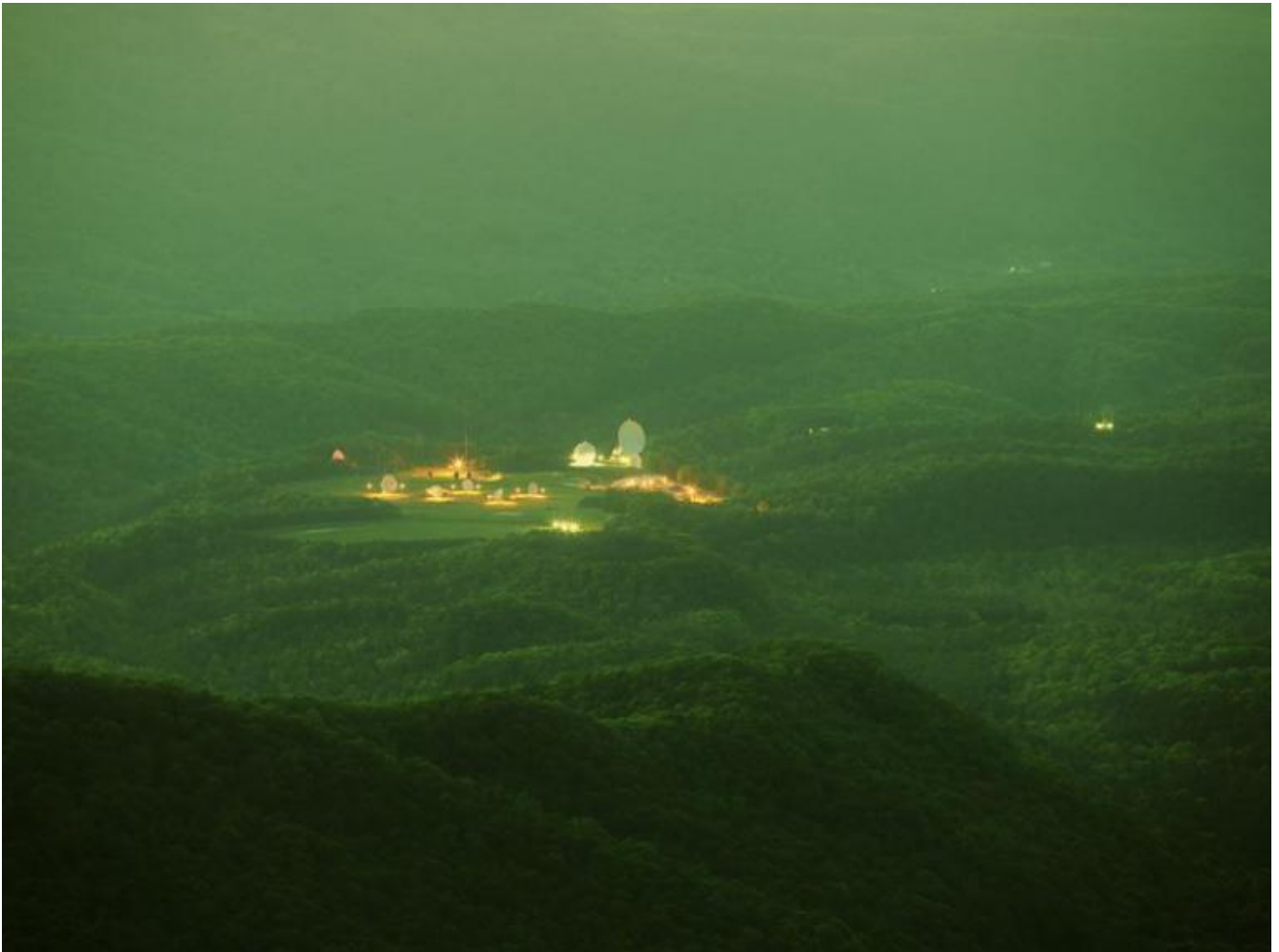
Paglen, They Watch the Moon , 2010.

dominio. Fotografa inoltre droni di guerra e aerei nel Nevada Test Site o Area 51, un'area militare inaccessibile grande come la Svizzera; e anche satelliti terrestri nell'orbita geostazionaria. Non soggetti alla pressione atmosferica, questi resteranno in orbita per un tempo infinito, ultime vestigia una volta scomparsa ogni traccia dell'uomo e della sua civiltà. Il lavoro di Paglen compare infine nel documentario Citizenfour (2014) che Laura Poitras ha realizzato con e su Edward Snowden.