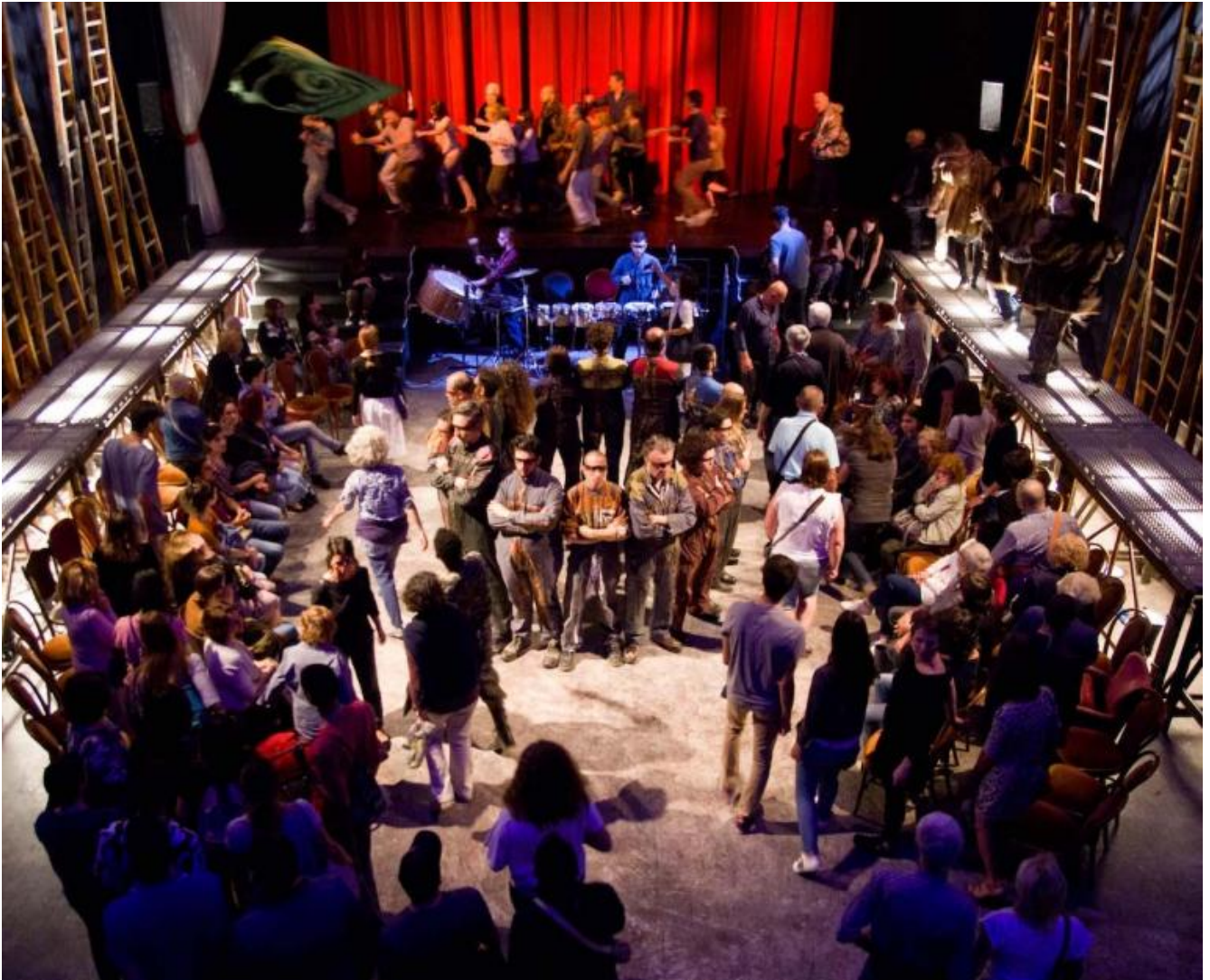
Diavoli, avari, prodighi: una prova, ph. Nicola Baldazzi.

manca di tempo, per altro, a vedere Inferno , e vorrebbero saperne; il racconto è sempre un altro testo dall'esperienza della visione, è solo uno dei possibili sguardi, e il vostro sarà ogni volta nuovo, differente).