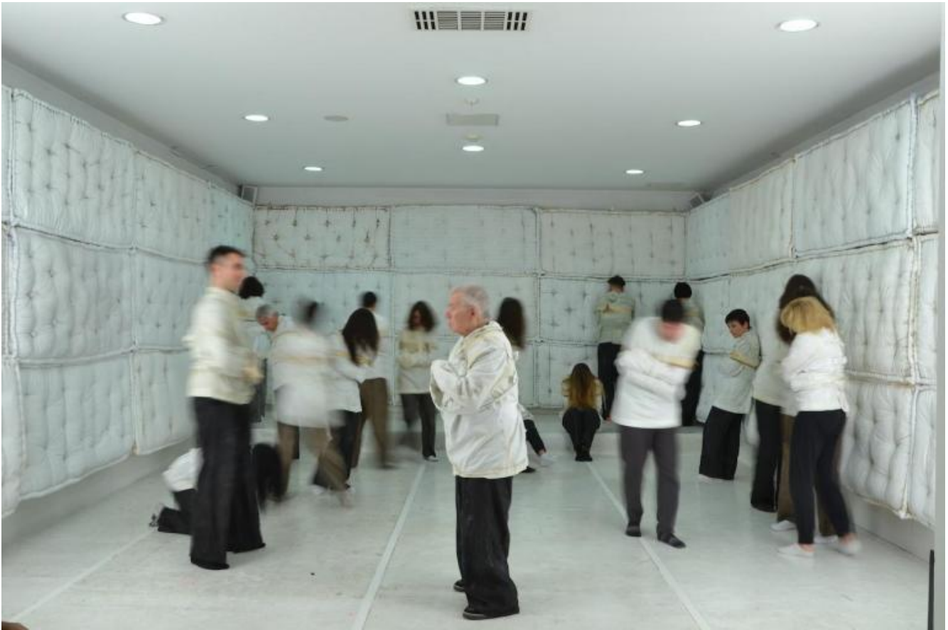
Vanni Fucci, ph. Cesare Fabbri.

Il “paradosso creato negli anni” è quello che ha reso possibile il capolavoro al quale stiamo assistendo, che con due ultimi colpi di coda, invenzioni stupende, ci porterà tra poco “a riveder le stelle”, tra la ferocia della disperazione di Ugolino, affidata alla voce profonda, qui come non mai, raschiata di Ermanna Montanari e a un finale a sorpresa, dove sprofondiamo nella chiesa e nella fossa al centro della terra in cui è punito il sommo traditore, Lucifero, il fascino del mondo di plastica che ci circonda, con i volti del nostro quotidiano consumare e consumarci.