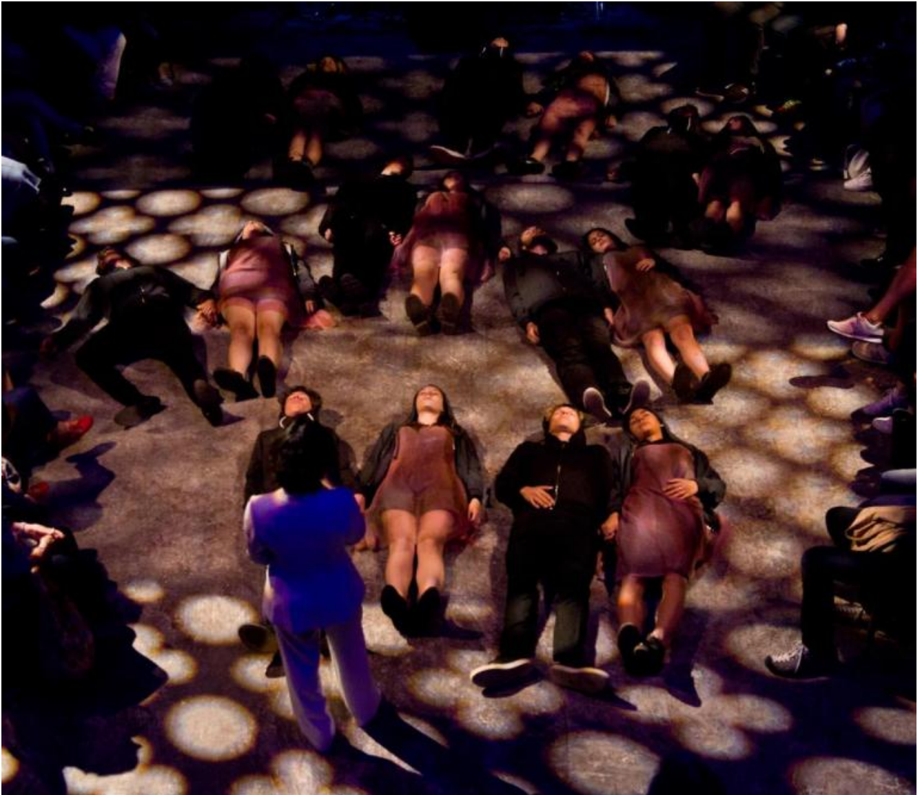
Paolo e Francesca, ph. Nicola Baldazzi.

Le musiche di Luigi Ceccarelli e dei suoi allievi del Conservatorio di Latina e della Scuola di musica di Ravenna ci avvolgono: ora percussive, ora come suoni distillati, "bozzolo sonoro" (lo chiamano gli autori) che ci accompagna ancora un poco più dentro nelle parole, che in questa fase si fanno più scarne, affidando molto alle immagini, alla visione.