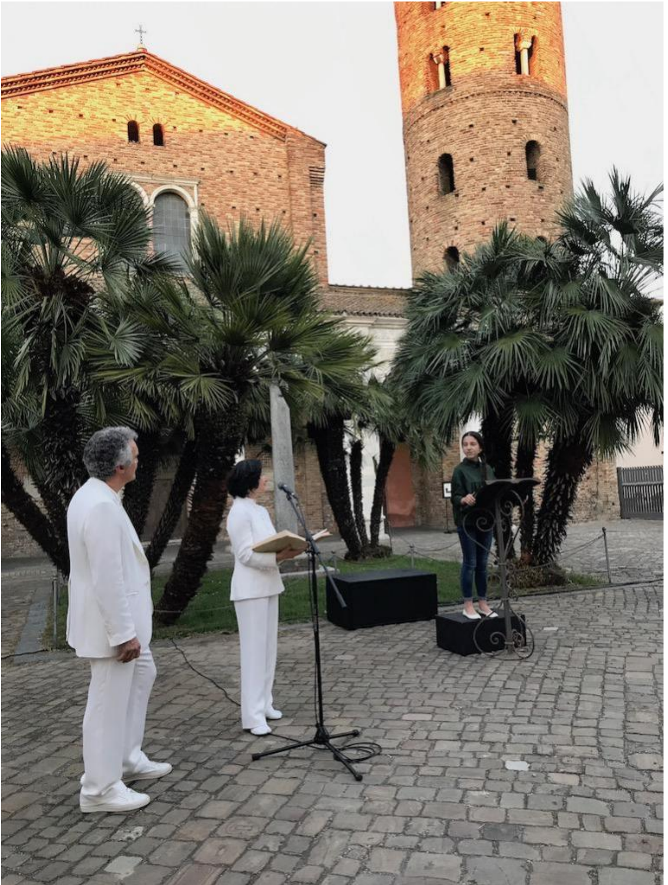
I' son Beatrice che ti faccio andare, Photocastorp.