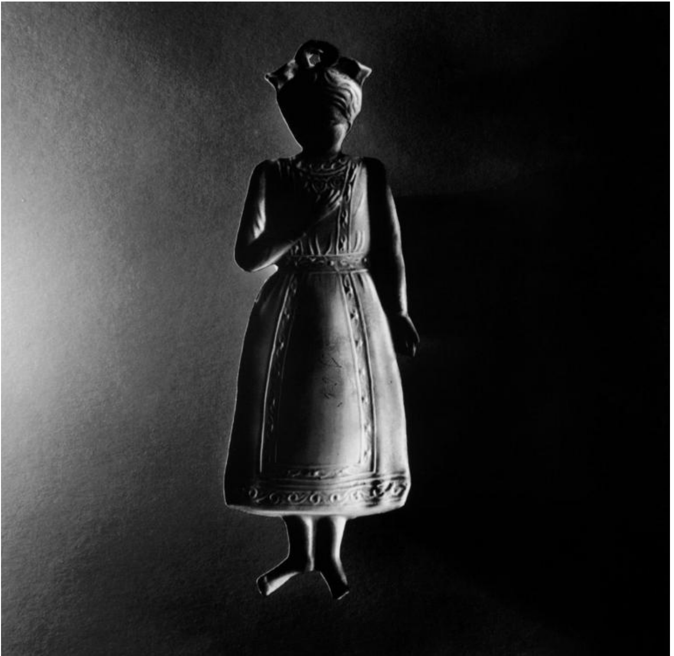
Antonio Biasiucci, Ex Voto, Napoli, 2006.

È questo il rito di cui narra la mostra: “essere vicini nella sostanza delle cose”, come racconta Biasiucci, a proposito di un altro suo lavoro. E la sostanza delle cose è la medesima materia con la quale sono fatte e il rito con cui prendono forma. Fotografare significa condurre ogni soggetto all’istante della nascita, raccontare la storia della sua evoluzione e contemporaneamente conservare la traccia dell’origine nelle sue forme. “Io compongo tomi” dice Biasiucci, “mi servo della fotografia per tentare di scrivere un alfabeto dell’umanità, scegliendo i soggetti che ritengo fondamentali, le vacche, i pani, i vulcani”. Nulla è più identificabile, nulla appartiene ad una tradizione visiva imposta e assimilata,