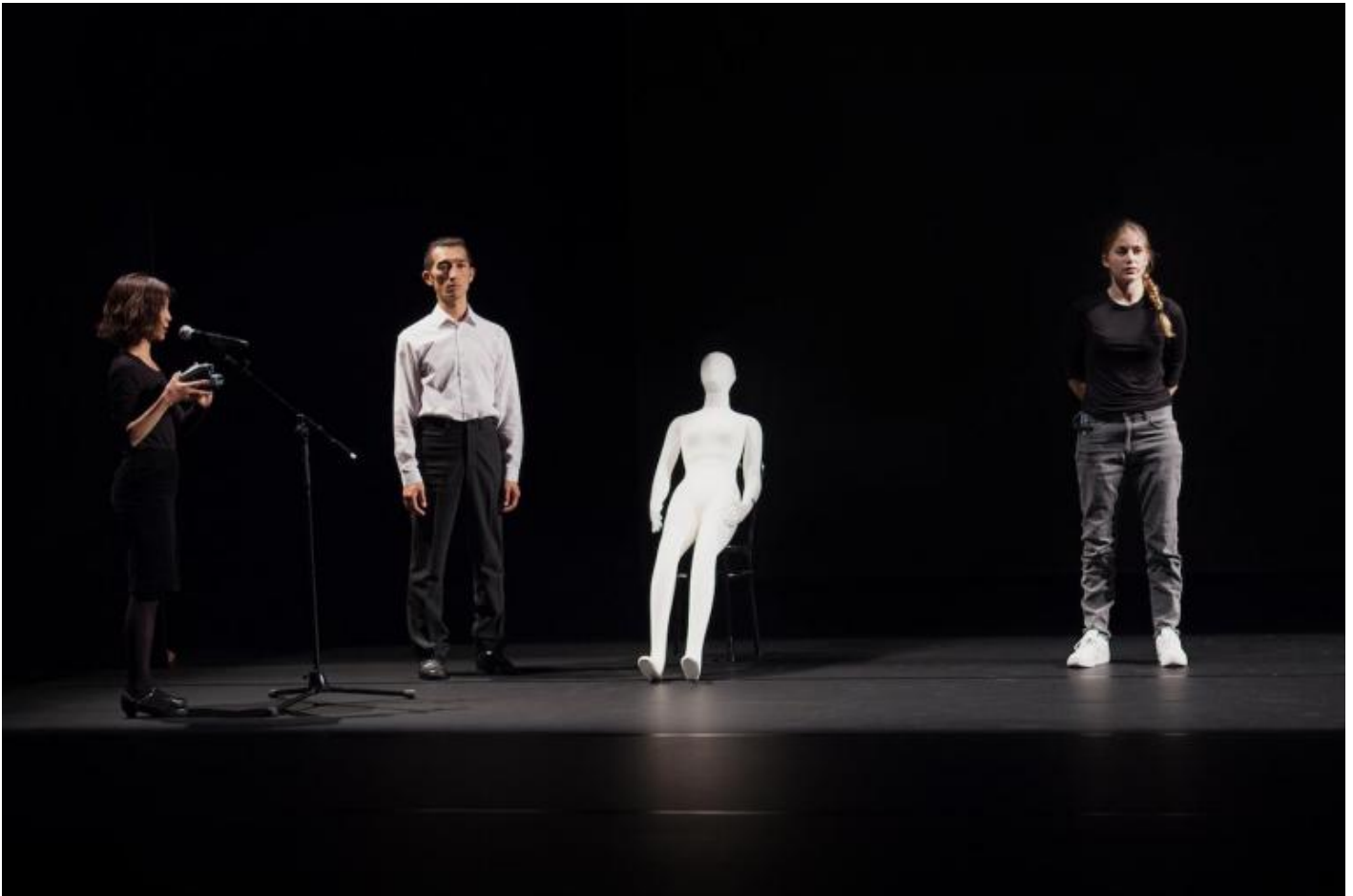
Samira Elagoz, Cock, cock... Who's there?

A rendere interessante l'indagine non è tanto l'ambigua linea di demarcazione tra verità e finzione già esperita da molta performance contemporanea (Samira è stata davvero violentata? E quanto sono artefatti i materiali che ci vengono presentati? Gli uomini che vediamo sono stati davvero contattati via internet?), quanto piuttosto la provocatoria forzatura di molti stereotipi su un argomento già ampiamente trattato. La performer sembra proporre la propria desiderabilità sessuale come paradossale antidoto alla violenza maschile sulle donne: “la nostra coscienza erotica ci rende potenti” pare affermare la Elagoz con Audre Lorde ( Gli usi dell'erotico: l'erotico come potere , Milano, Il dito e la luna, 2014, per approfondimenti leggere qui ).