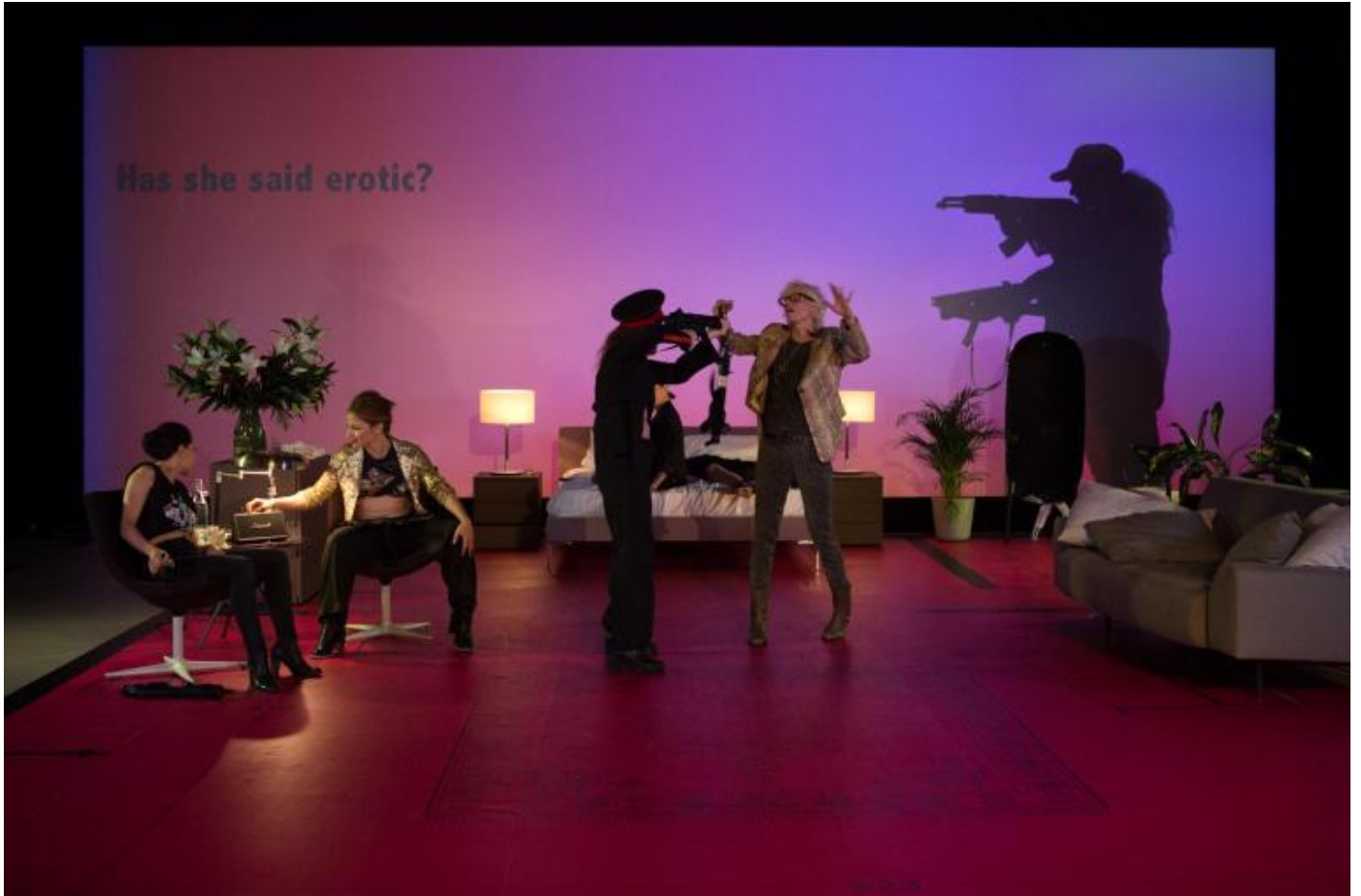
Motus, Über Raffiche, ph. DIANE Ilaria Scarpa, Luca Telleschi

nel violento scarto tra le due figure (talmente antitetico da indurre qualche spettatore a domandarsi se si tratti di una effettiva identità) risiede l'intelligente denuncia di ambigue e scivolose dinamiche di sguardo: lo spettatore si trova inevitabilmente indotto, dopo aver osservato le immagini e i video proposti dell'artista, a ripensare da un'altra prospettiva alla violenza di cui ha sentito parlare nei primi istanti dello spettacolo. E viene così chiamato a riconoscere in se stesso, prima ancora che negli altri, l'attuarsi involontario di schemi di giudizio sessisti ed eteronormativi.