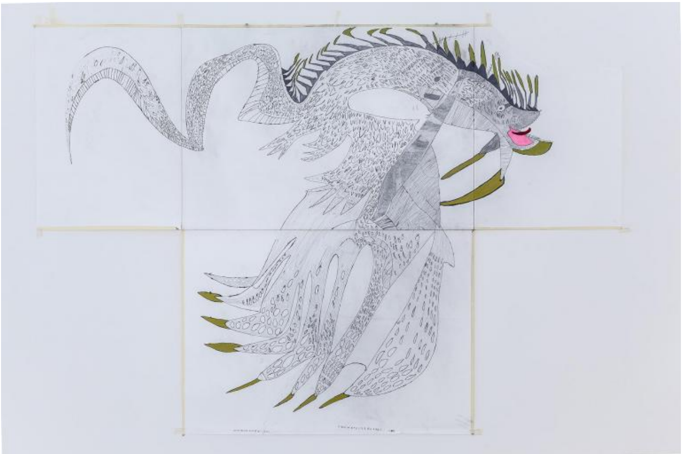
Drago medusa palline in testa, 140x200, 2015, Giorgia, Atelier dell'errore.

Il primo anno si sedeva e disegnava sempre e solo ciò che voleva lei, come diceva lei, per il tempo e con i materiali che decideva lei. La sua mano però, nel disegno è una mano assoluta , fin da quando l'ho vista all'opera la prima volta. Il suo enorme limite , tipico: un accanimento incontrollabile e irrefrenabile del segno fino a sfinire il foglio, in mesi e mesi di lavoro. Ricami che torcendosi su se stessi, alla fine cancellavamo ogni forma, ogni intenzione.