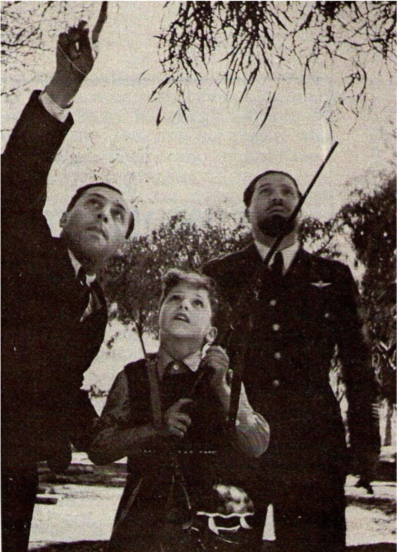
Longanesi con Italo Balbo e Paolo Balbo.