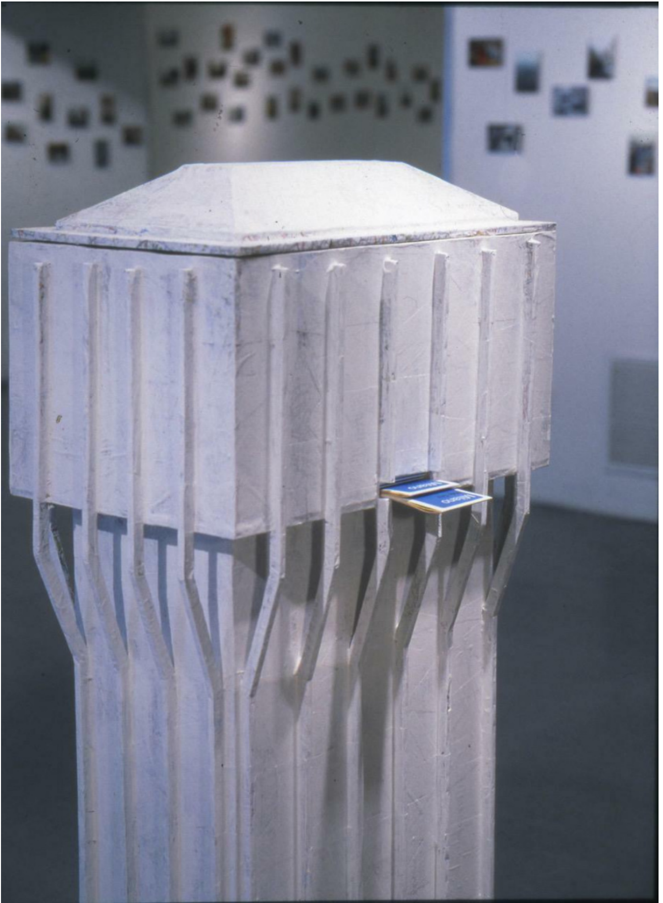
Wide City, 1998 Modello in legno della torre Velasca, 180 fotografie a colori 10 x 15 cm, dimensioni variabili, Collezione Museo del Novecento, Milano. Veduta della