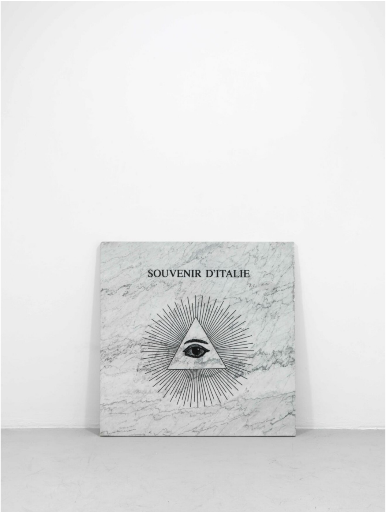
Luca Vitone, Souvenir d'Italie (Lapide), 2010 Incisione su marmo bianco di Carrara 106 x 106 x 3 cm. Collection Michel Rein, Paris.