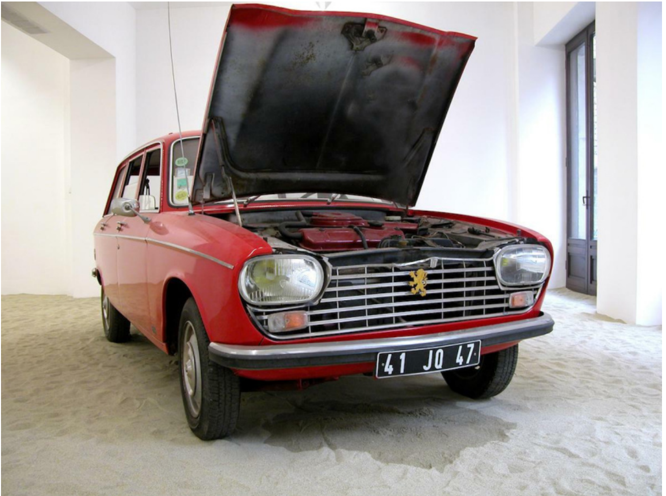
Ultimo Viaggio, 2005. Automobile, sabbia, 8 oggetti, mensola, 5 fotografie a colori 50 x 77 cm ciascuna, 1 fotografia in bianco e nero 50 x 77 cm. Dimensioni ambientali, Collezione Nomas Foundation, Roma.

La permanenza e la scomparsa della memoria tornano anche nell'opera Corteggiamento (2003-2004), composta da nove sculture musicali intitolate alle Muse. Vitone recupera strumenti musicali della tradizione e li decora con le luci di una festa di paese, poggiandoli su mobili ormai desueti, sonorizzando l'installazione con musiche del repertorio popolare. Attraverso una ricognizione etnografica in forma poetica, l'artista richiama l'attenzione su un patrimonio culturale che si dissolve e che, ancora una volta, lega assieme con un doppio filo le nostre storie private, i ricordi familiari, il passato e il presente della storia a cui, consapevolmente o no, tutti noi partecipiamo. Ad essa fa da controcanto il video Trallallero nei giardini di Villa Reale (2017), dove viene ripresa la performance di un gruppo di canto polifonico genovese, e Sonorizzare il luogo. Europa (1989-1993), costituita da quindici stazioni sonore che rappresentano altrettante regioni europee abitate da minoranze etniche o culturali. Passeggiando nel corridoio si è immersi in una cacofonia di suoni che diventano distinguibili solo avvicinandosi