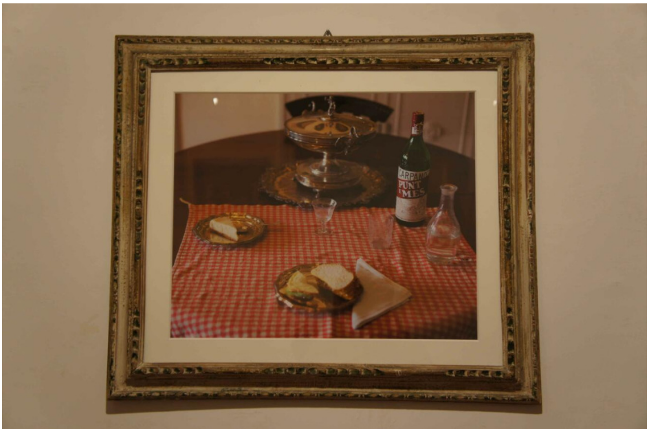
Natura morta con Punt&Mes, 2012. Fotografia a colori in cornice di legno d'orato 55 x 65 cm. Courtesy dell'artista e Galleria Pinksummer, Genova / Galerie Nagel

All'installazione fa eco il complesso museale dei Chiostri di Sant'Eustorgio con il Museo Diocesano, dove trovano ospitalità opere più piccole, selezionate da Giovanni Iovane, inserite in dialogo con gli oggetti della collezione permanente: nella selezione sono visibili Futuro Ritorno (2008), installazione sonora dove sono protagoniste le voci di ventidue cittadini stranieri, Le cinque pietre di Davide (2017), Natura morta con Punt & Mes (2012), foto scattata nella casa romana di Giorgio De Chirico e Nel nome del Padre (2001), l'omaggio a Lucio Fontana realizzato insieme a Cesare Viel, un lungo elenco di padri putativi che spazia da Leonardo da Vinci a Julio Cortazar. Infine, gli otto ambienti del PAC, che completano idealmente il viaggio nei trent'anni di produzione, proponendo due opere inedite e una serie di lavori ripensati specificamente per gli spazi del museo. Una mostra che accoglie alcuni tra i progetti più significativi della carriera di Vitone, accolti nel padiglione che, per l'occasione, viene trasformato in un contenitore da manipolare, una sorta di scatola scenica.