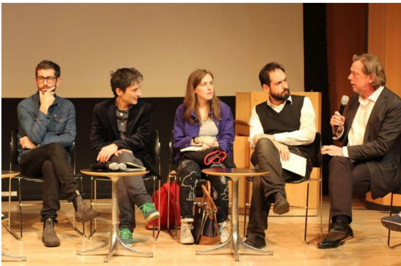
Autori e operatori, ph. Selene Candido.

Se pensassi di potermi sostituire a studiosi, accademici, critici teatrali, registi e scrittori, sarei come il regista che fa l'attore, il tecnico e l'organizzatore. Non posso commettere gli errori che riconosco negli altri. Io considero illimitato il mio potenziale come elaboratore di strategie, ma poi metto un limite al campo delle mie competenze.