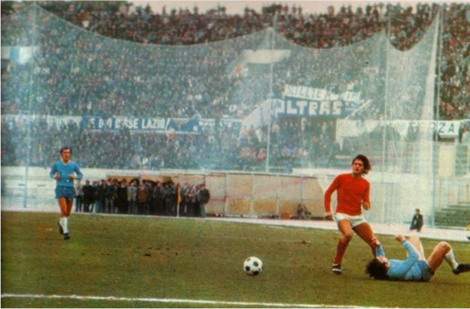
22 febbraio 1976, Lazio-Perugia. Nello striscione si legge "Sollier boia".