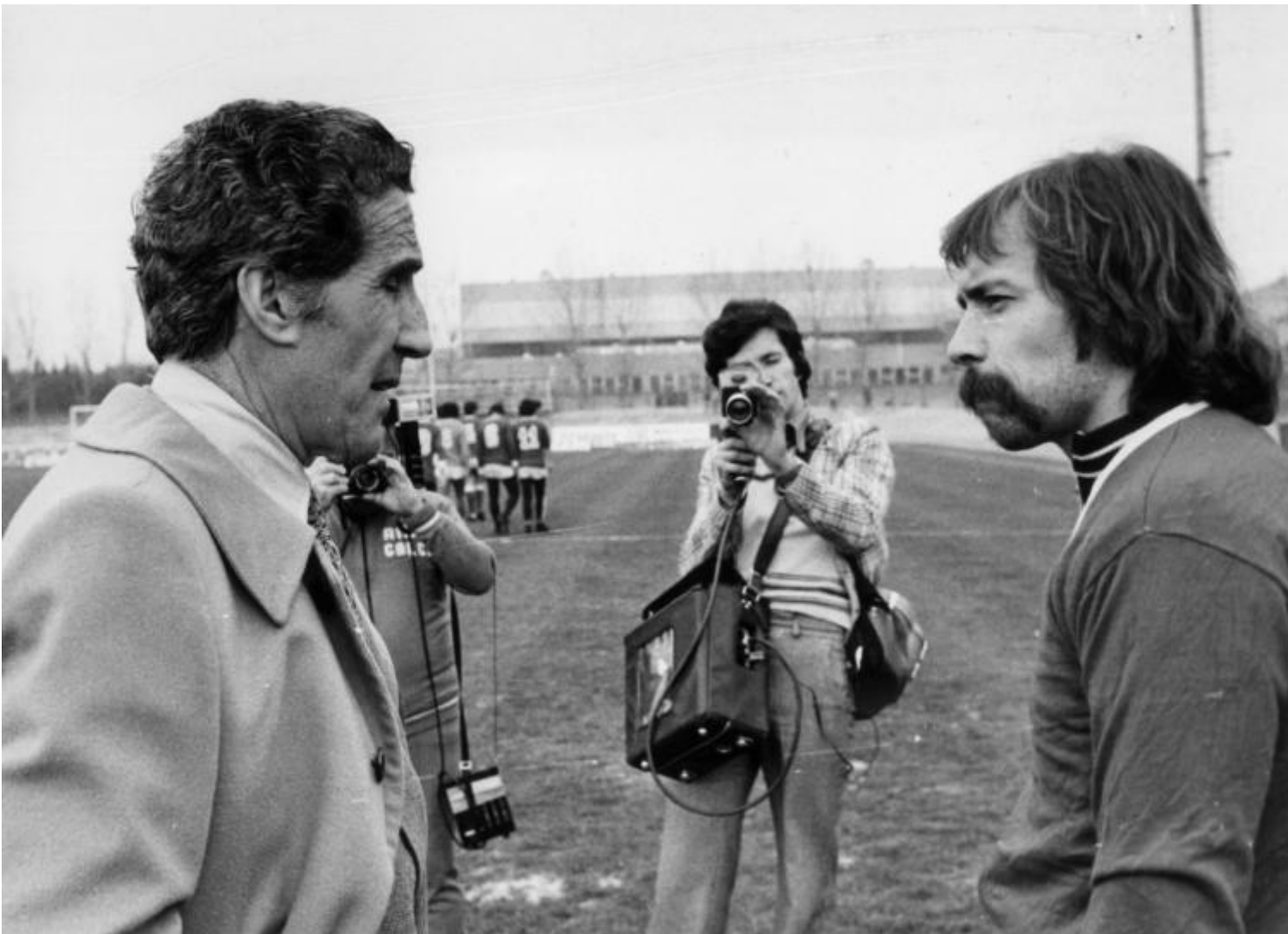
1979, Sollier a Rimini parla con "il Mago" Helenio Herrera.

E in quell'Italia dalle mille contraddizioni lo spettacolo del calcio continua a scandire l'avanzare delle settimane con i suoi riti: alla radio le inconfondibili cronache di Sandro Ciotti in «Tutto il calcio minuto per minuto», al bar la schedina del Totocalcio, allo stadio la domenica le curve del tifo ora organizzato. E in strada per Terni ci sono due giocatori che più di altri sono il simbolo, loro malgrado, di una ribellione.