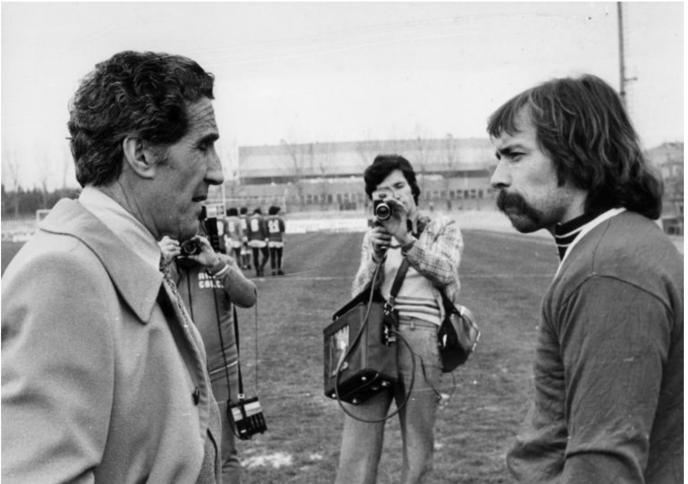
1979, Sollier a Rimini parla con "il Mago" Helenio Herrera.