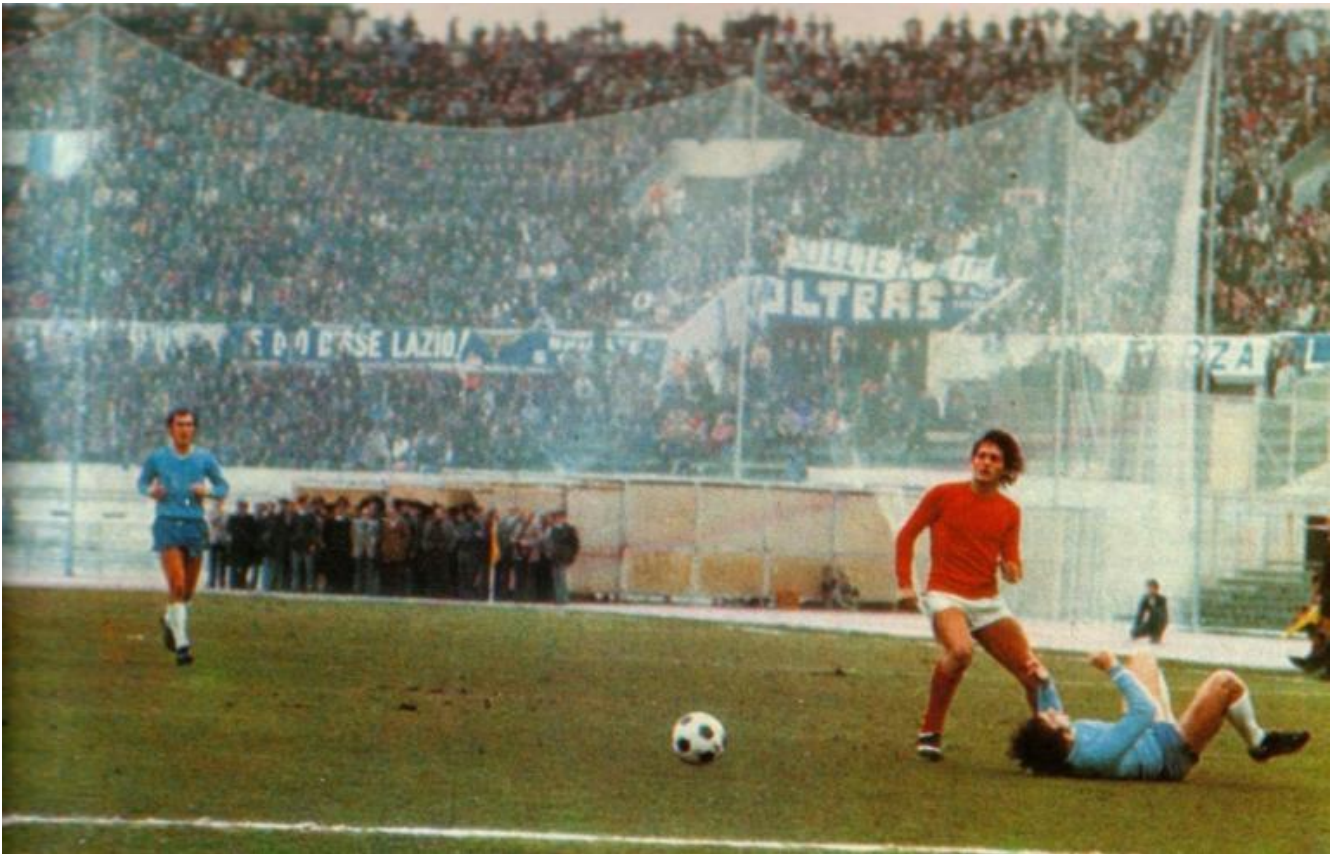
22 febbraio 1976, Lazio-Perugia. Nello striscione si legge "Sollier boia".