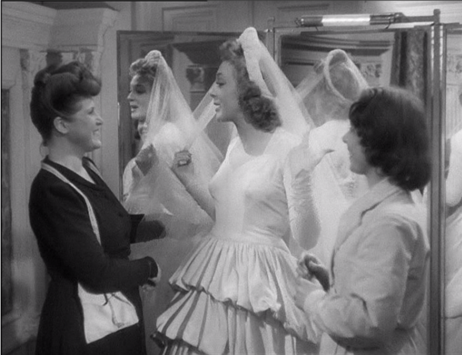
Falbalas , Jacques Becker (1945).

«Pur se noi serbassimo il silenzio, |e non pronunziassimo una parola, |le nostre vesti e i nostri corpi |ti diranno la vita che abbiamo condotto» dice Volumnia in Coriolano . L'eroe di Il filo nascosto agisce in uno scenario spettrale e misteriosamente tragico che può perfino far ripensare a certe atmosfere assolute del teatro shakespeariano. Così come può ricordare, superficialmente, l'inquietudine molto più schematica del protagonista di Falbalas , dal quale Anderson riprende soprattutto le scene ambientate nella sartoria.