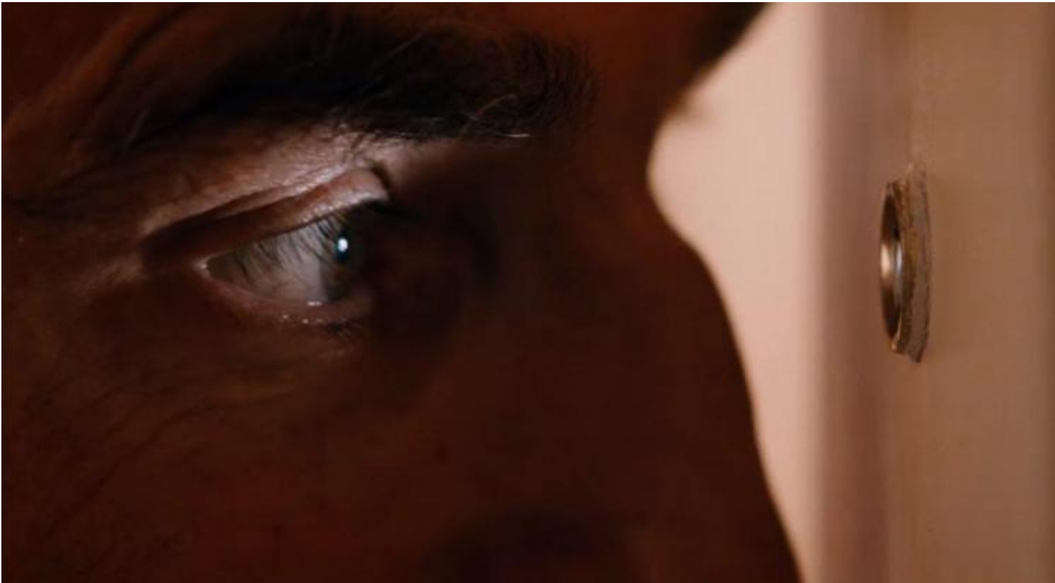
Reynolds Woodcock (Daniel Day-Lewis), Il filo nascosto, P. T. Anderson (2017).

Proprio quest'ultimo accostamento, però, può metterci sulla strada di quello che sembra agire come il centro di gravità più vero e più forte di Il filo nascosto , e che si realizza attraverso due motivi gemelli. Da una parte, infatti, Anderson mette in scena, rappresentandolo e cesellandolo attraverso l'immaginario della sartoria, il legame morboso e fantasmatico (in senso sia visivo sia temporale) tra Reynolds e la madre: che appare e scompare, come filo nascosto, come "phantom thread", per tutto il film. Al tempo stesso, e specularmente, il film è il racconto straordinario del modo in cui Alma, che in un certo senso è il personaggio più complesso della storia, entra in relazione con questo sistema; del modo in cui agisce e reagisce a questa situazione, con una serie di atti e di scelte che, in un certo senso, fanno di lei la vera protagonista: colei che, come si chiarirà sempre di più, dà vita, attraverso il suo racconto, alla figura stessa fantasmatica di Reynolds.