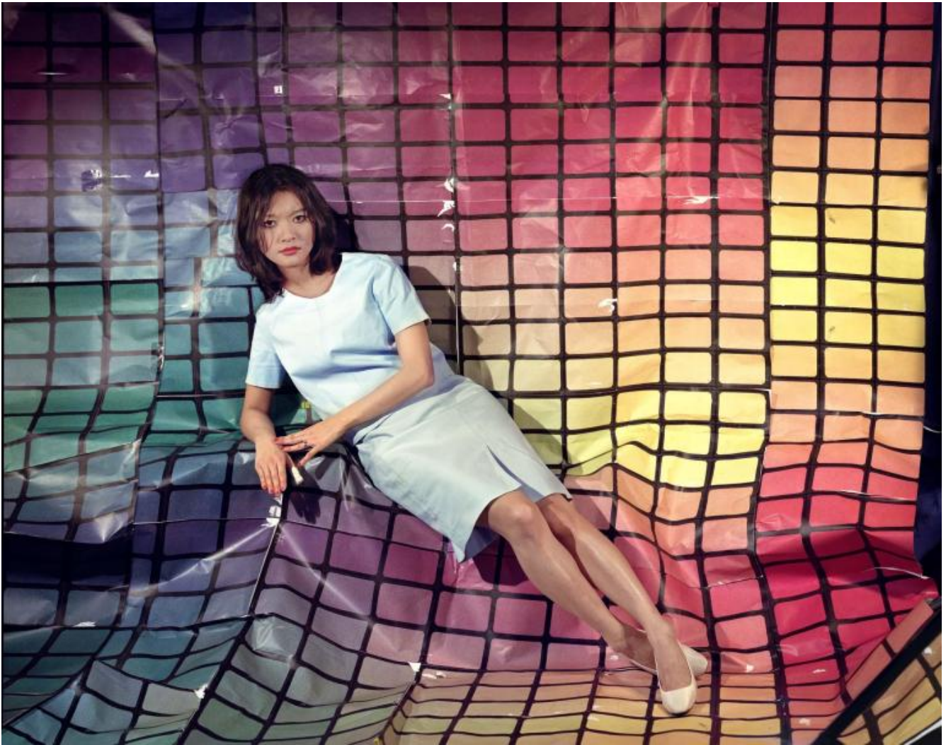
Sarah Cwynar, Tracy, griglia (dal verde al rosso), dalla serie "La fabbrica del colore", 2017 © Sarah Cwynar.

Così come accade nelle immagini di Tracy, musa dell'artista, ritratta con estrema intensità e saturazione, su uno sfondo costituito da un'enorme griglia di colori, che esprime una sorta di fissità immutabile, una trappola rassicurante per lo sguardo. Eppure non è tutto qui. Le immagini di Sara Cwynar mostrano anche lo spazio di una possibilità: il dubbio di non volere nulla di tutto ciò.