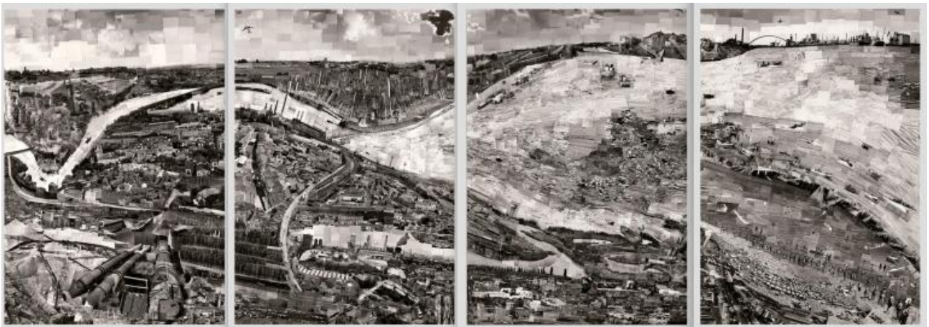
Sohei Nishino, Pannelli Il Po, 2017 © Sohei Nishino.

che la ospita, il fiume dà forma allo sguardo di Nishino: scorre, si muove. È un'immagine archetipica. Poiché prima di essere un fotografo, Sohei Nishino è un viaggiatore. Cammina e mentre si sposta scatta incessantemente. Occhio e movimento generano un cumulo di immagini che si trasformano nei tasselli di una mappa. Il punto di partenza per Nishino è stato il Monviso, da lì poi è sceso a Torino ed ha viaggiato per quarantacinque giorni in direzione dell'Adriatico. Il suo modo di lavorare è singolare. Non esiste un'immagine perfetta o l'istante irripetibile. Ogni fotogramma merita di sopravvivere, ogni istante è portatore di senso. Nishino sviluppa manualmente i rullini e li fissa su provini a contatto, poi taglia e smonta uno per uno i provini sviluppati e incolla ciascun pezzo su una tela immensa. Tutti i provini vengono utilizzati, nulla viene scartato. Il Po è composto da una moltitudine di immagini: uomini, piante, edifici e naturalmente l'acqua, fonte generatrice di un muto rigoglio organico.