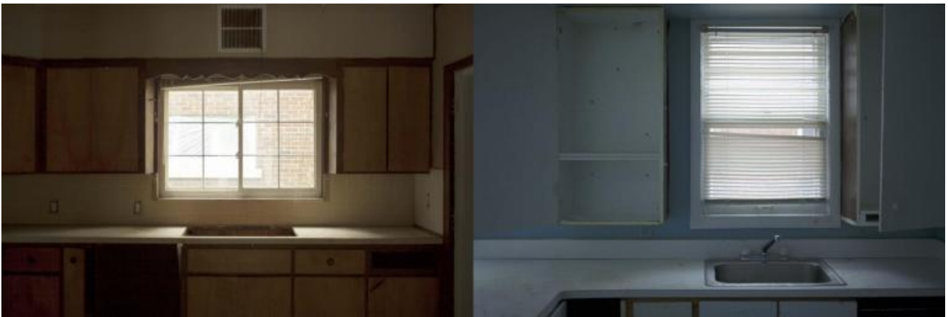
Mari Bastashevski, Senza titolo, Asta di abitazioni, Detroit, Michigan, USA, 2017. Accesso: autorizzato da un agente immobiliare.

Cosa si vede nelle foto esposte? Nessuna vittima. Mari Bastashevski preferisce un differente itinerario narrativo. Le vittime, sostiene l’autrice, “sono troppo spesso trasformate artificialmente in un altro da sé posto in un stato di permanenza, uno stato che la fotografia ha contribuito a consolidare e a cui continua troppo spesso a contribuire”. Per questo non si vede chi muore. Si vede un’altra cosa: la morte. E che forma assume? Quella di una cucina spoglia, o meglio di un dittico di cucine dai colori tenui: armadietti vuoti, ambienti desolati. Semplicemente la morte è arrivata e non se ne va. Permane e occupa massicciamente lo spazio del fotogramma. Lo riempie. Lotta con i suoi confini. Forse per questo la fotografia sembra essere in grado di arginare il suo potere. O forse queste due immagini sono solo residui, rovine virtuali che provano a rilasciare la memoria di una promessa originaria.