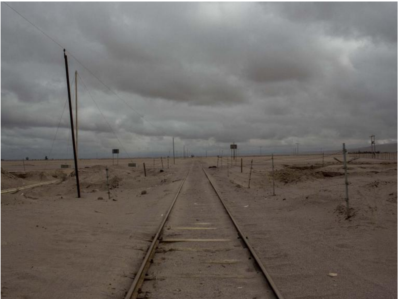
Cristóbal Olivares, Senza titolo, dalla serie “Il deserto”, 2017 © Cristóbal Olivares.

raffigurate di spalle, nascondono la propria identità. Sono al tempo stesso “iper-visibili e in-visibili”. I loro ritratti, a cui l’autore dà la parola in alcuni video presenti in mostra, sono posti sopra, di fianco o accanto alle immagini dei paesaggi. Sembra che li osservino senza uno sguardo. Dinnanzi allo spettatore vi è soltanto uno spazio vuoto. Nessuno coincide con niente. È questo il vero senso del migrare? Un perenne senso di estraneità, persino verso se stessi? Una distanza impossibile da colmare? Forse sì. La fotografia riesce a mostrarlo senza sotterfugi retorici. Il deserto ha questa forma: uno spazio senza relazioni, una fotografia vuota, una storia spesso senza salvezza.