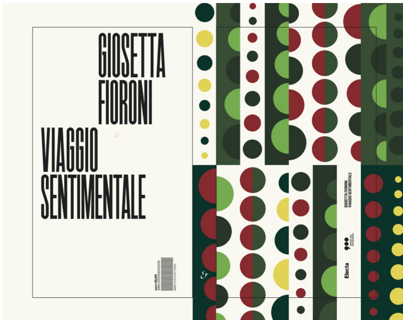
Giosetta Fioroni, Viaggio sentimentale, Electa 2018 (progetto grafico di Leonardo Sonnoli)

morfologico della spia era già (osserva acutamente Obrist) nei costumi Optical realizzati per l'altrettanto mitica, fischiatissima Carmen "strutturalista" messa in scena l'anno precedente, a Bologna, da Alberto Arbasino con la consulenza di Roland Barthes: una cui grande foto è in fondo alla sala (un po' sacrificata, a lato del corpo principale dell'esposizione) dove c'è appunto la ricostruzione della Spia ottica (purtroppo, però, senza attrice dentro). E torna adesso, mercé la grafica di Leonardo Sonnoli, nel concept-book che è il catalogo: le cui pagine sono, a loro volta, tutte attraversate da un buco traguardabile.