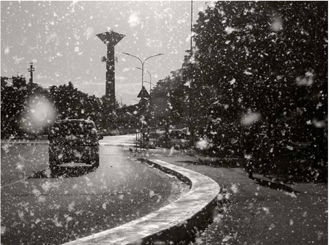
Sohei Nishino, Lanugine dei pioppi, Corso Emilia Romagna, 593x443.