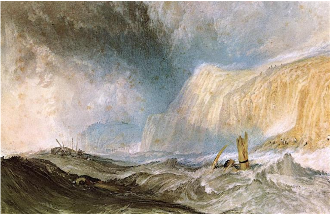
A Shipwreck off Hastings, di William Turner.

Tenendo a mente ciò, possiamo provare a tornare all'ipotesi che il teatro attui un movimento di «evasione» di qualche tipo. In tal caso, dato che si evade in senso proprio solo da qualcosa in cui ci troviamo costretti e imprigionati, bisogna anche supporre che l'accadimento teatrale possa a servire a liberare attori e spettatori da forme di prigionia in cui ci troviamo invischiati. Il modo specifico in cui ciò accade richiede che si precisi meglio che cosa si intende con "prigionia".