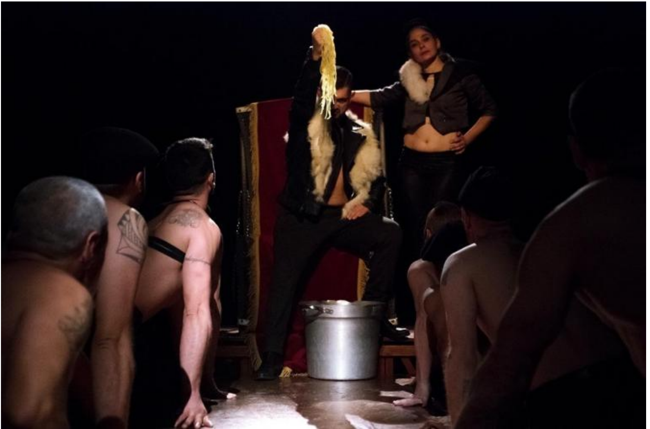
Teatro dei Venti, Ubu re, ph. Chiara Ferrin.

L'espressione «teatro sociale d'arte» è sicuramente lodevole, nella sua volontà di coniugare utilità e socialità, bellezza e giovamento. Essa contiene un invito condivisibile a tenere insieme queste due dimensioni generalmente dissociate, ricavando così esperienze più ricche del consueto. All'interno dell'espressione, tuttavia, si nascondono forse due potenziali rischi. Uno è che questo teatro "sociale" esista perché si oppone a un teatro "non-sociale" o "asociale", di cui semplicemente fatico a rinvenire l'esistenza. Il fatto che l'attività dello spettacolo si collochi dentro una società umana e che diverse persone si radunino per un tempo misurato ad assistere all'azione di uno o più attori, delegando loro il compito di evocare qualcosa sulla scena, mostra forse che anche lo spettacolo in apparenza più disimpegnato o lontano dai concreti problemi della comunità è inevitabilmente sociale. Tale discorso non è nemmeno smentito da quegli esperimenti performativi estremi, quali la creazione di opere d'arte nel deserto, dove non vi è e non vi può essere un fruitore. Questo artista eremitico si rivolge comunque a un interlocutore ideale, per esempio a un'umanità assente o ai morti o alle anime mai nate, il che basta a restituire al suo gesto il carattere della socialità. D'altro canto, se la specifica "d'arte" è senz'altro valida per evitare di fare del teatro uno strumento solo politico e morale, riducendolo a una pratica