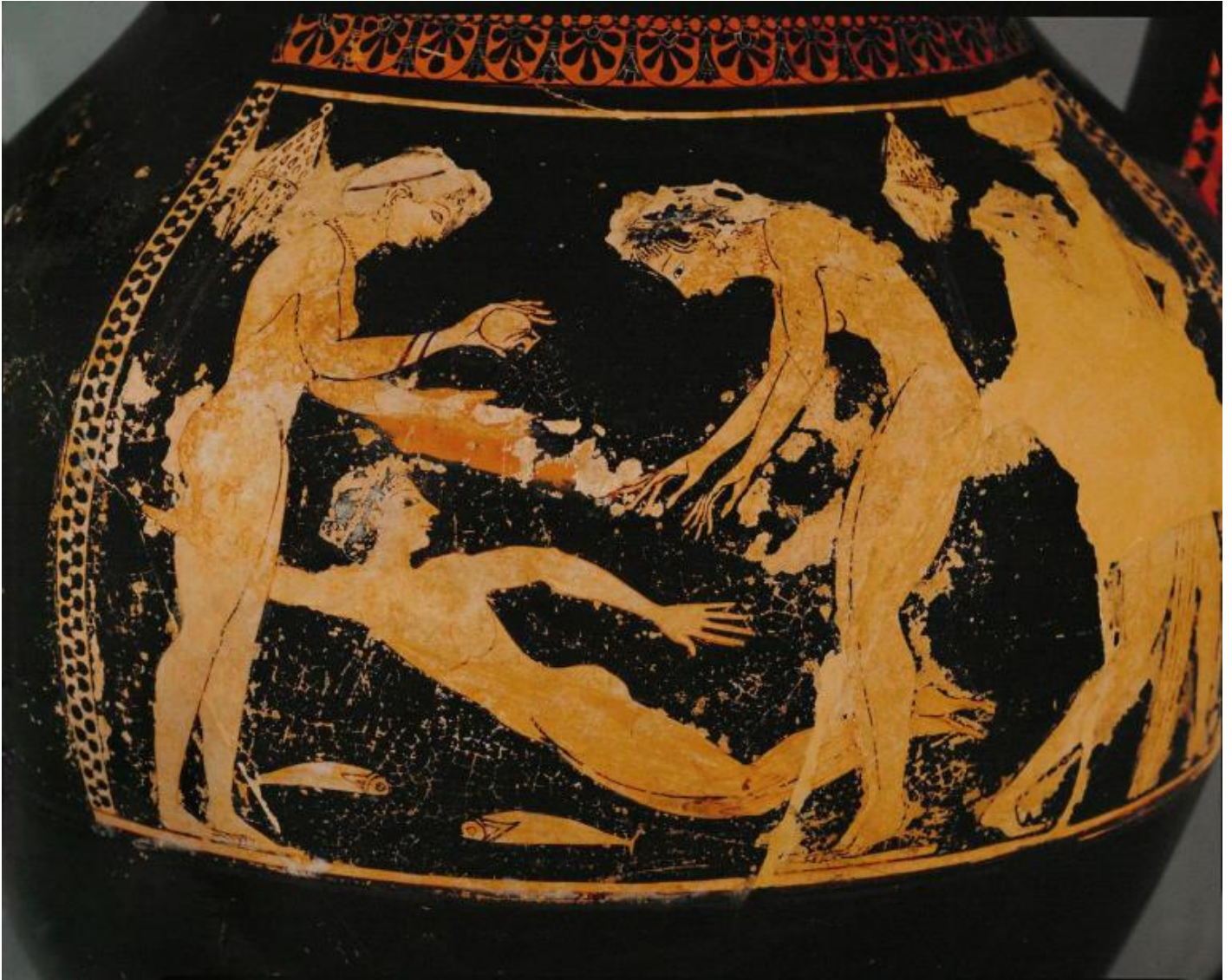
Bagnanti, Anfora con figure rosse, 525-520 a. C., Louvre, Paris.

La storia dei colori, anziché aiutarci, sembra proporci nuovi paradossi, a cominciare dall'acqua nera di Omero: mélan hýdor , così la chiama più volte. I filologi, come gli antichi commentatori, hanno cercato di spiegare questo epiteto come descrizione di particolari condizioni in cui l'acqua, abbondante e profonda, ci appare scura. Possiamo poi anche ribadire che i termini 'bianco' e 'nero' hanno in greco una sfera semantica diversa rispetto all'italiano, che mélas , in particolare, vuol dire appunto scuro, buio, tetro, tenebroso, ma anche questo non ci risolve il problema di un epiteto che chiaramente contrasta con la nostra esperienza percettiva. A questo va aggiunto che per Empedocle – secondo la testimonianza di Teofrasto – «il bianco è il colore del fuoco, il nero dell'acqua» e che per Anassagora la neve non può essere bianca, in quanto composta di acqua, che è nera.