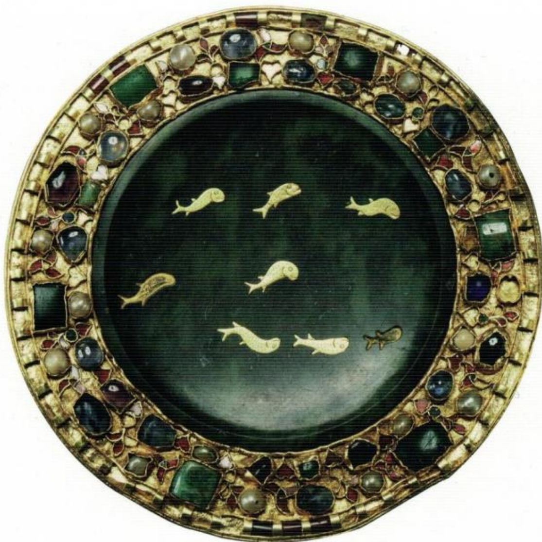
Patena in pietra serpentina (la parte interna risale al I sec., il cerchio esterno è opera della seconda metà del sec. XI), Musée du Louvre, Paris.

Invero la storia del blu e la sua affermazione in Occidente e in epoca moderna come colore dell'acqua è molto complessa e intrecciata a molteplici aspetti simbolici – blu colore della poesia romantica perché colore dell'infinito, della lontananza, del sogno; blu colore del manto della Vergine; blu colore morale, colore della pace, della fedeltà e dell'amore; blu colore regale e dell'aristocrazia dal sangue blu – studiati proprio da Pastoureau nel suo libro Blu. Storia di un colore (Ponte alle Grazie 2002). Per quanto riguarda l'acqua, il blu è divenuto il colore dell'acqua, come colore diventato freddo, più freddo del bianco, come nei riflessi blu di una cascata o di un ghiacciaio.