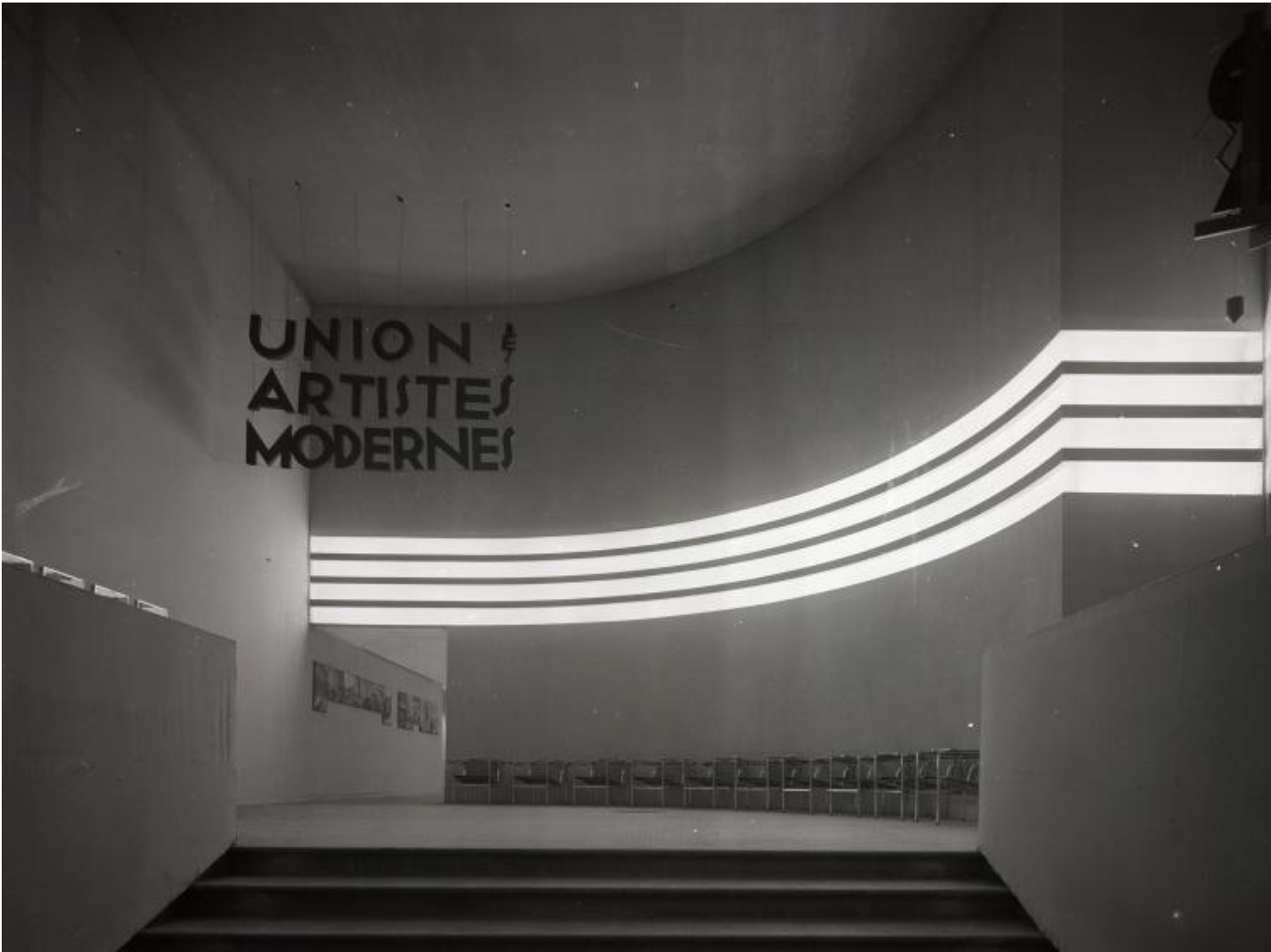
Robert Mallet-Stevens, Ingresso della III Exposition de l'Union des Artistes Modernes, Paris, 1930

Come altre che l'hanno preceduta negli stessi spazi, L'Envol presenta in effetti il mondo, la sua storia, come una democrazia magica, anarchica, illimitata, senza conflitti e senza negativo, dove lo spettatore-consumatore si sente libero di cedere alla meraviglia, libero da ogni pedagogia, libero di immaginare, evadere, godere: si può guardare tutto e dimenticare tutto. Un confronto immediato è con un'altra mostra, di ben più ampie proporzioni e ambizioni, in corso a Parigi in queste settimane: UAM. Une aventure moderne (Centre Georges Pompidou, fino al 27 agosto), dedicata alle origini e alle vicende della Union des Artistes Modernes, il gruppo-faro del modernismo francese. Con i suoi nomi eccellenti, da Eileen Gray, Le Corbusier, Mallet-Stevens, a Charlotte Perriand e Jean Prouvé, la mostra è ricchissima di opere, modelli, immagini, documentazione, che misurano anno dopo anno l'evoluzione di architettura, design e arti decorative in Francia, dal gusto Art Nouveau del primo decennio del XX secolo al razionalismo modernista di cui il gruppo UAM, fondato nel 1929, fu tra i maggiori interpreti.