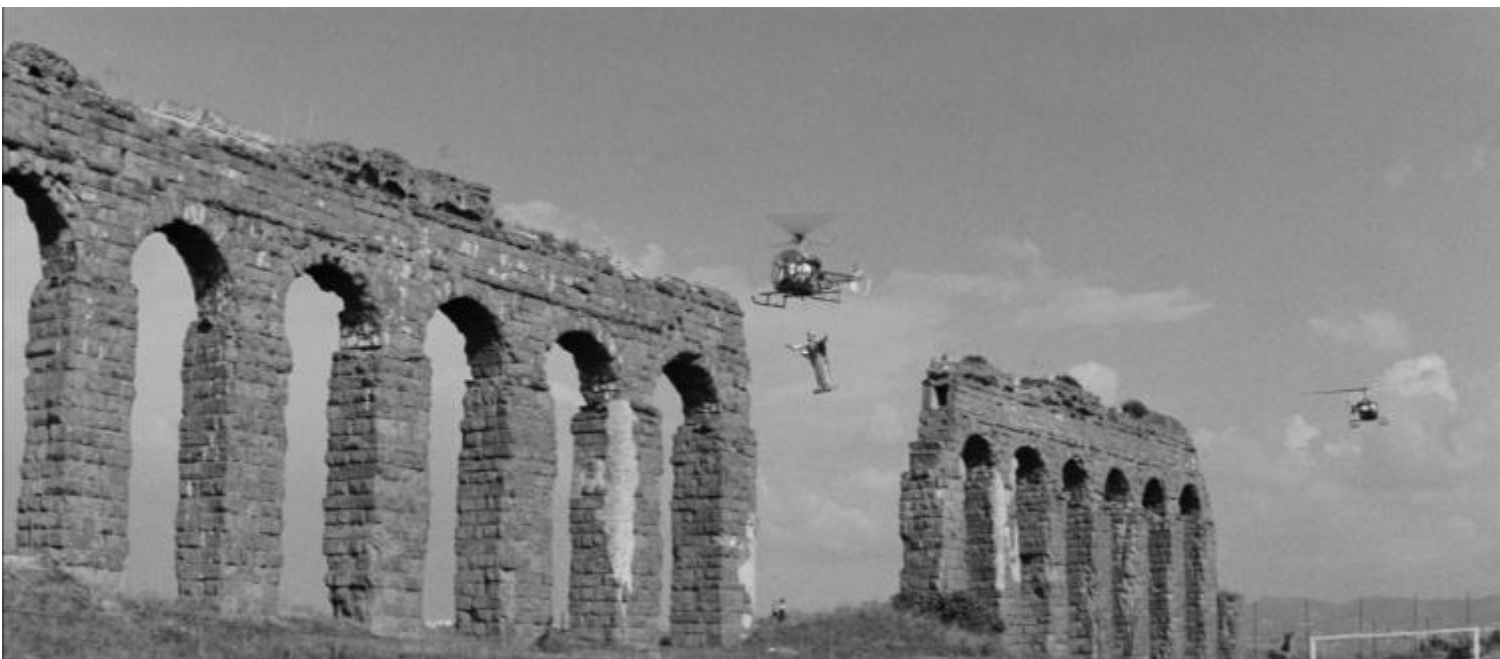
La dolce vita , 1960

Alla fine, pur con tutti i suoi evidenti difetti, occorre però riconoscere a L'Envol una qualità dolorosamente assente in troppe mostre recenti, piccole e grandi. La capacità cioè di attingere a immagini considerate come eventi in sé, più che come supporti di petizioni moraliste o di schedature erudite. Immagini che sembrano essersi imposte quasi già fatte a chi le ha realizzate, per quanto strane, perturbanti, impreviste, non evolute, e che a dispetto della loro sempre contingente, storica e dialettizzabile novità , appaiono pretendere da chi le guarda anzitutto il riconoscimento, sempre in bilico tra adesione irragionevole e clinico distacco, del loro essere impreviste e imprevedibili.