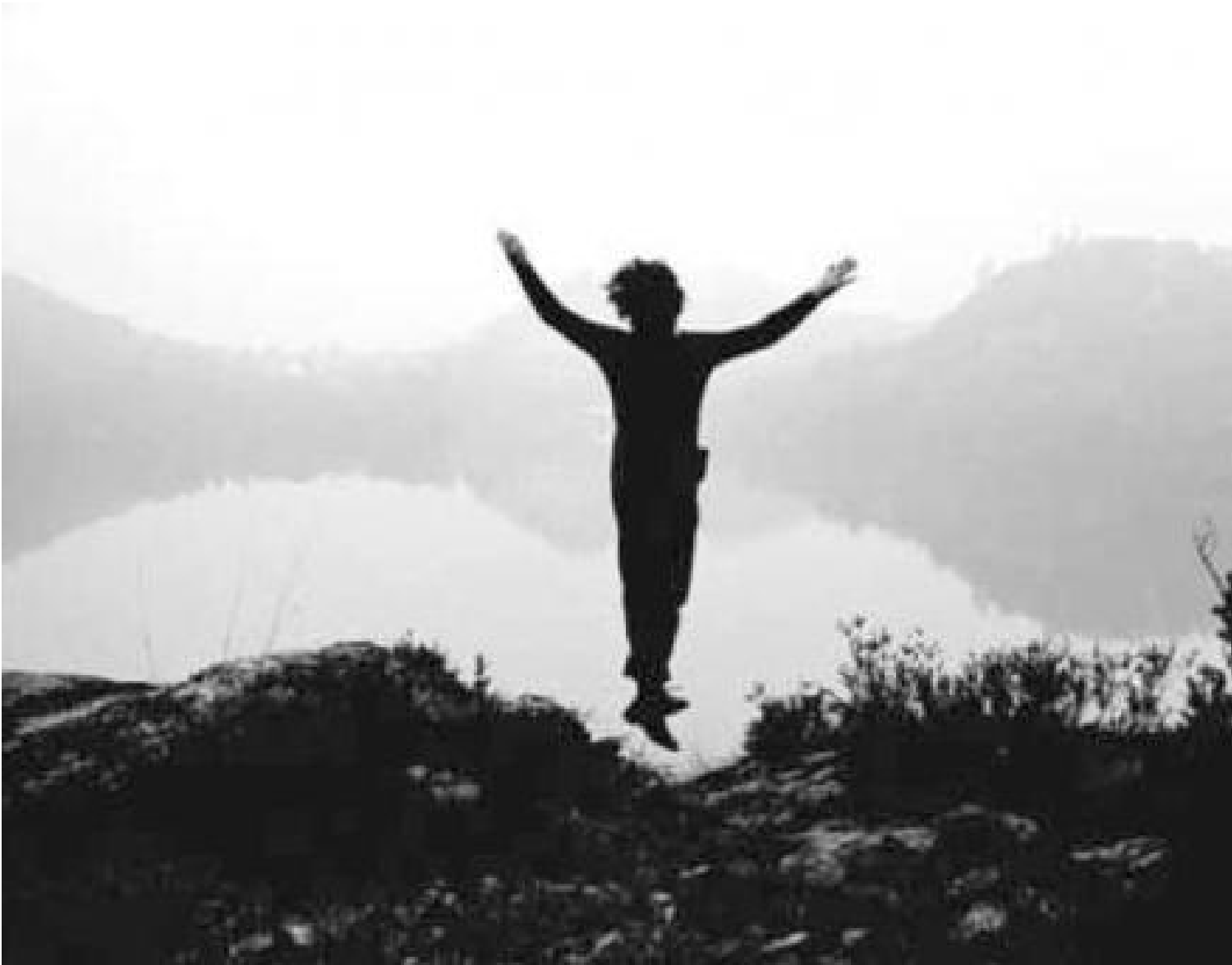
Gino De Dominicis, Tentativo di volo, 1970

Ma il Tentativo , come ha notato Michele Dantini, è anche la puntuale parodia di quel Salto nel vuoto (1960) con cui Yves Klein celebrava il suo singolare ingresso in uno “spazio” dell’arte tutto immateriale e mentale, così come un altro lavoro di De Dominicis, Il tempo, lo sbaglio, lo spazio (1970) – uno scheletro umano steso al suolo con dei pattini a rotelle ai piedi, che con una mano porta al guinzaglio lo scheletro di un cane e con l’altra regge in bilico un’asta verticale –, espone il rovescio immobile e mortale del mito della velocità, abbattendo ironicamente il pattinatore dotato di paracadute impersonato da Robert Rauschenberg nella performance Pelican (1963).