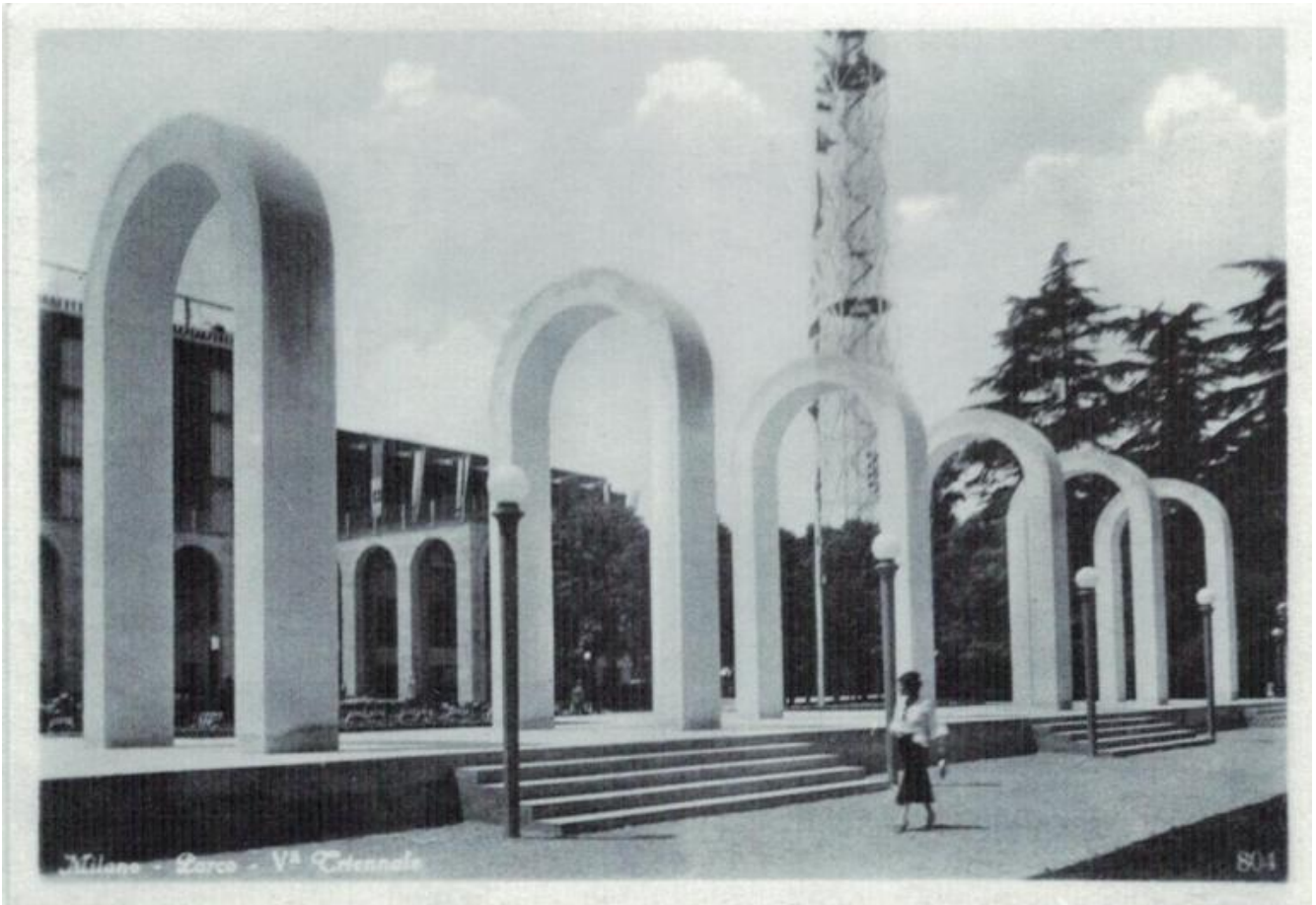
Cartolina fotografica degli Archi ornamentali del Piazzale d'onore, V Triennale di Milano 1933.

Altro aggettivo che definisce parte di questa architettura in cartolina è «razionale», corrispondente al programma del Movimento Italiano di Architettura Razionale del Gruppo 7 guidato Carlo Enrico Rava e sostenuto da Giuseppe Pagano. Questo filone funzionalista, per nulla gridato né monumentale, anzi asciutto, lineare, rigoroso, lo ritroviamo nelle cartoline fotografiche che raffigurano alcune delle numerosissime Case del fascio, qualche Casa del Balilla, alcune scuole e molti edifici del settore privato. A questo rigore - Sturani lo definisce quasi calvinista - corrisponde un desiderio di anonimato che in queste cartoline in bianco e nero si realizza alla perfezione: in quasi tutte non compare né il nome del fotografo, né quello dell'architetto, una sorta di «autoritratto collettivo» di una società (p. 54), al quale contribuiscono editori, stampatori, fotografi, architetti che credono nella costruzione di una nuova Italia: la maggior parte delle cartoline infatti non è di propaganda, ma «da tabaccheria» o prodotta da privati.