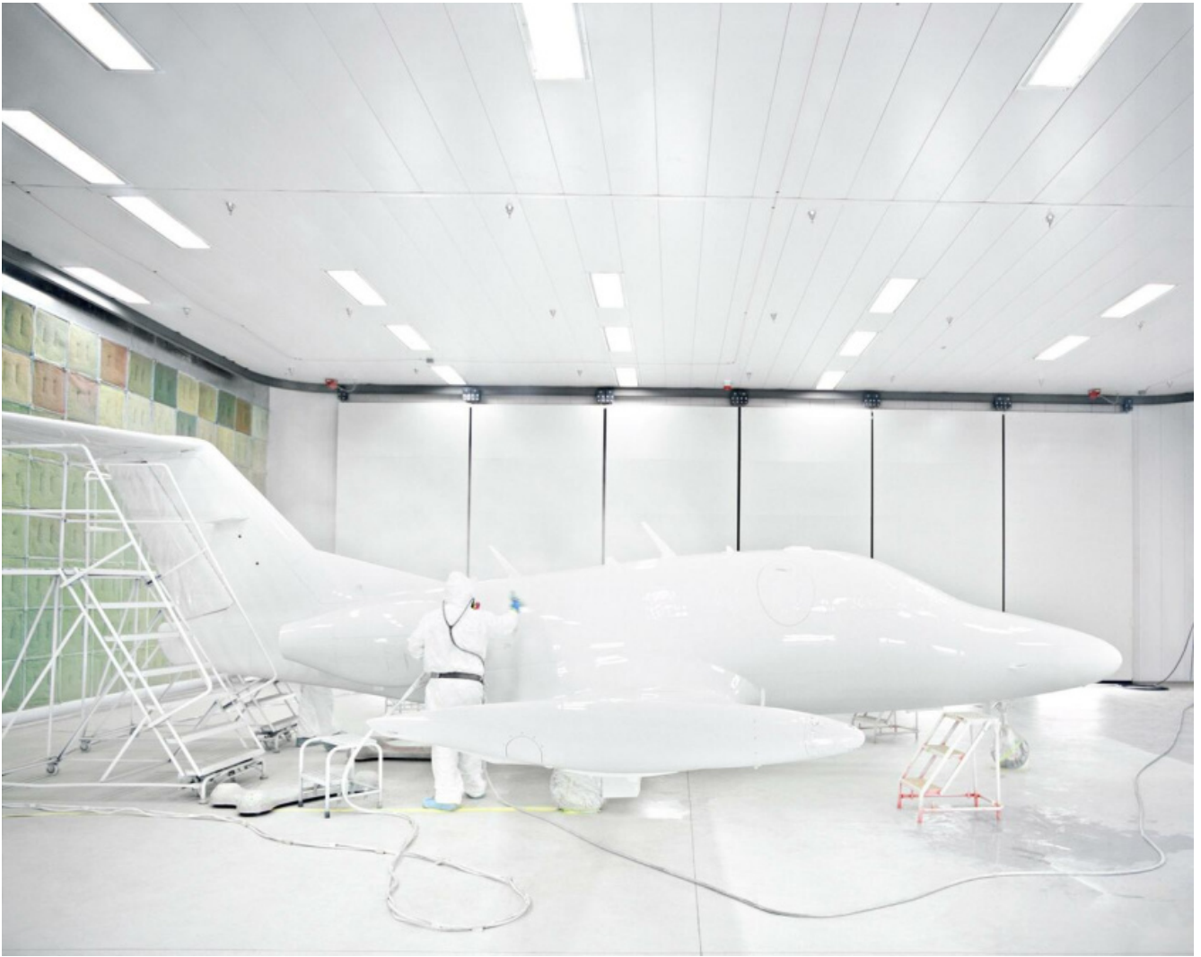
Floto + Warner, Sala verniciatura dell'Eclipse Albuquerque, NM USA, 2007 © Floto + Warner.

Eppure questa mostra riesce a produrre un sovvertimento corrosivo all'interno del suo stesso percorso. Due fotografi, infatti, propongono lavori che segnano una netta linea di demarcazione rispetto al contesto e allo stesso tema espositivo. Sono Yto Barrada e Xavier Ribas. Le loro opere non recano alcuna traccia di movimento. Lo scarto appare talmente evidente che si è costretti ad interrogarsi sul senso della velocità proprio mentre se ne constata l'assenza.