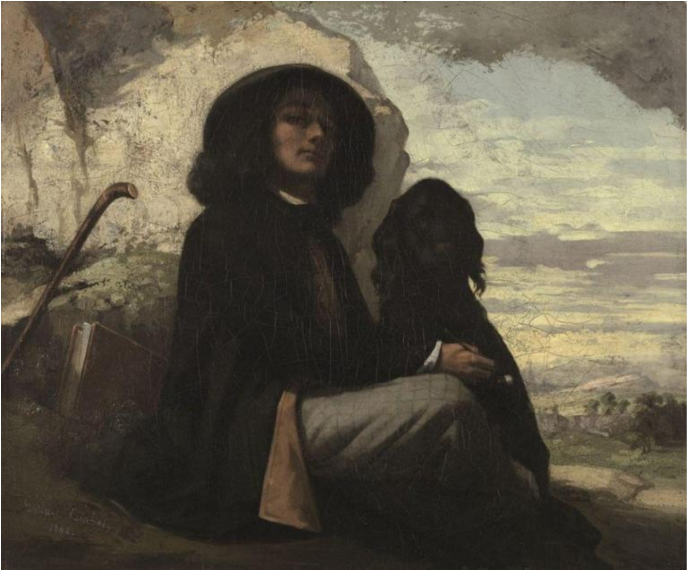
G. Courbet, Autritratto con il cane .

percorrerà e dipingerà a lungo. E quelle rocce: che magnifica resa pittorica, ottenuta per strati di colore passati con il coltello. C'è lì, evidente, tutta quella materialità della pittura che lo accompagnerà negli anni. Passeggiare per le sale della mostra è un piacere: l'illuminazione e anche le pareti ci vengono in aiuto, indicandoci topograficamente le zone, i luoghi a cui i dipinti fanno riferimento, così come alcune stampe fotografiche più o meno coeve (utilizzate come aide-memoire ?) Ci muoviamo tra alberi secolari dove corrono cani, e poi boschi, ruscelli, paesaggi marini, onde, nature morte, uomini feriti, rocce, scene di caccia, donne assopite sul greto del fiume, floride bagnanti, paesaggi nevosi svizzeri.