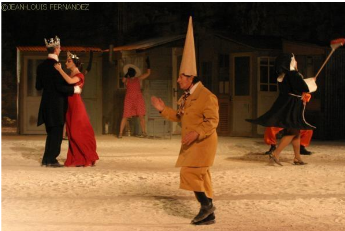
Urlo