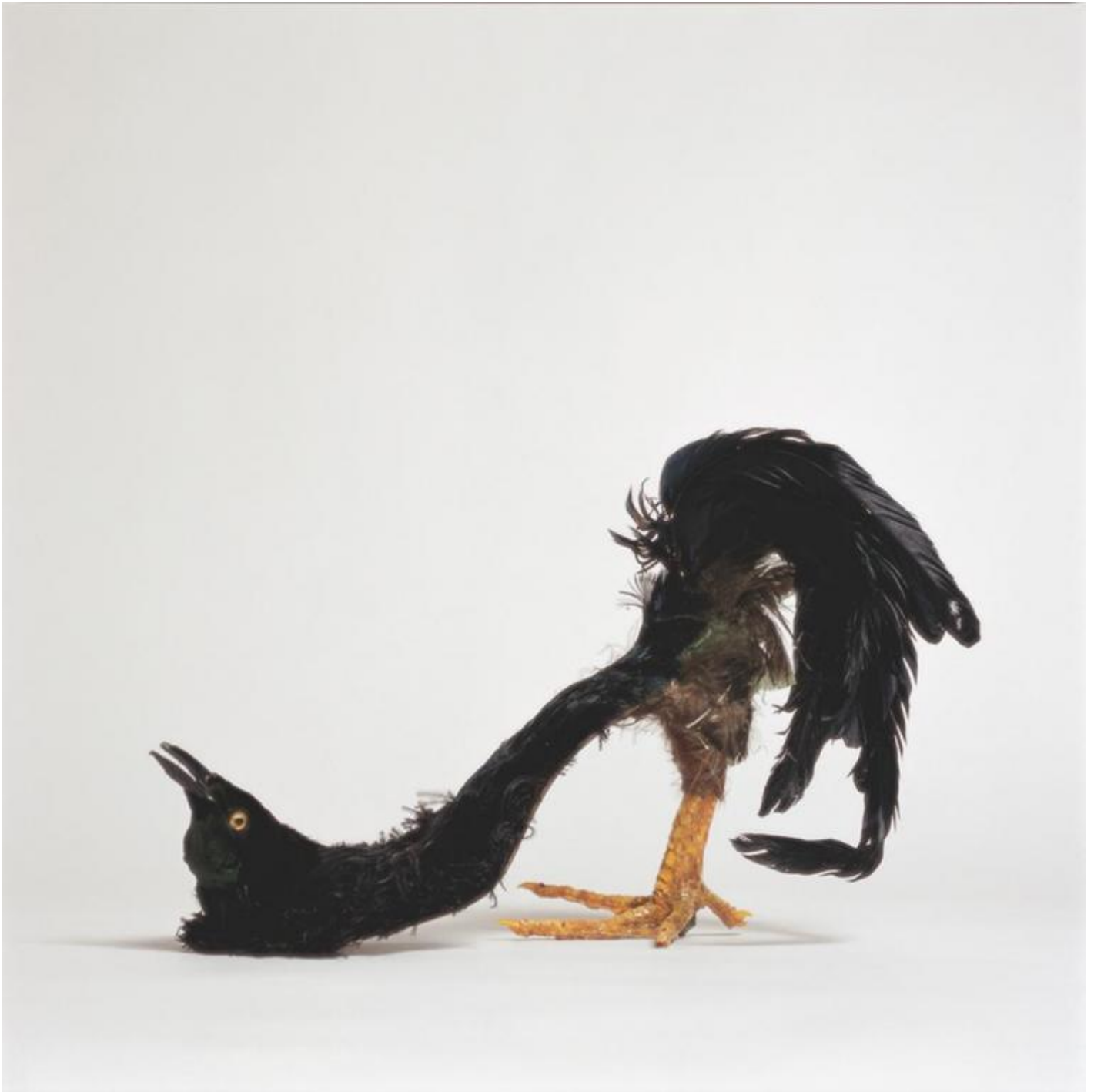
Birgit Jürgenssen Netter Raubvogelschuh / Bella Scarpa-Rapace, 1974-75 Metallo, piume, zampa di gallina Cm 30 x 23 x 13 Estate Birgit Jürgenssen (s9) Courtesy Galerie Hubert Winter, Vienna © Estate Birgit Jürgenssen by SIAE 2019.

L'elemento organico si innesta nei simboli rassicuranti di una femminilità preordinata e li tramuta in organismi inquietanti, il quotidiano si mescola con il letterario e con la provocazione: Schwangerer Schuh ( La scarpa incinta ) del 1976 è un assemblaggio che ricorda certe metamorfosi alla Cronenberg, mentre Nest ( Nido , 1979) e Brautkleid ( Il vestito da sposa , 1979) rimandano a un immaginario surrealista più smaccato, o ancora il celebre Hausfrauen – Küchenschürze ( Grembiule da cucina da casalinghe , 1975), esposto alla collettiva voluta da Valie Export MAGNA – Femminismo: arte e creatività , tenutasi presso la Galerie nächst St. Stephan di Vienna nel 1975, diventata una delle opere simbolo del femminismo, un'icona di sapore pop che demolisce con ironia la figura della casalinga come angelo del focolare ma che mantiene un sottotesto