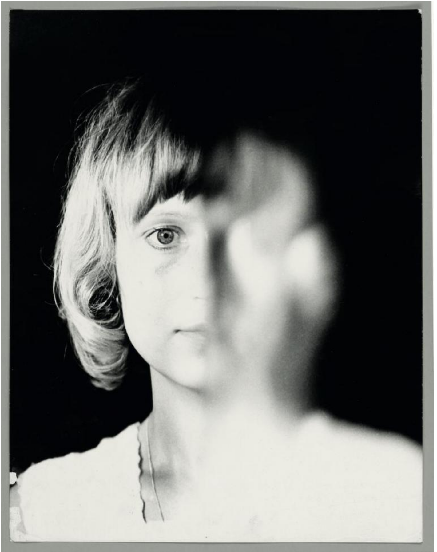
Birgit Jürgenssen Ohne Titel / Senza titolo, 1972 Materiale fotografico inedito Cm 24 x 18 Estate Birgit Jürgenssen Courtesy Galerie Hubert Winter, Vienna © Estate Birgit Jürgenssen by SIAE 2019.