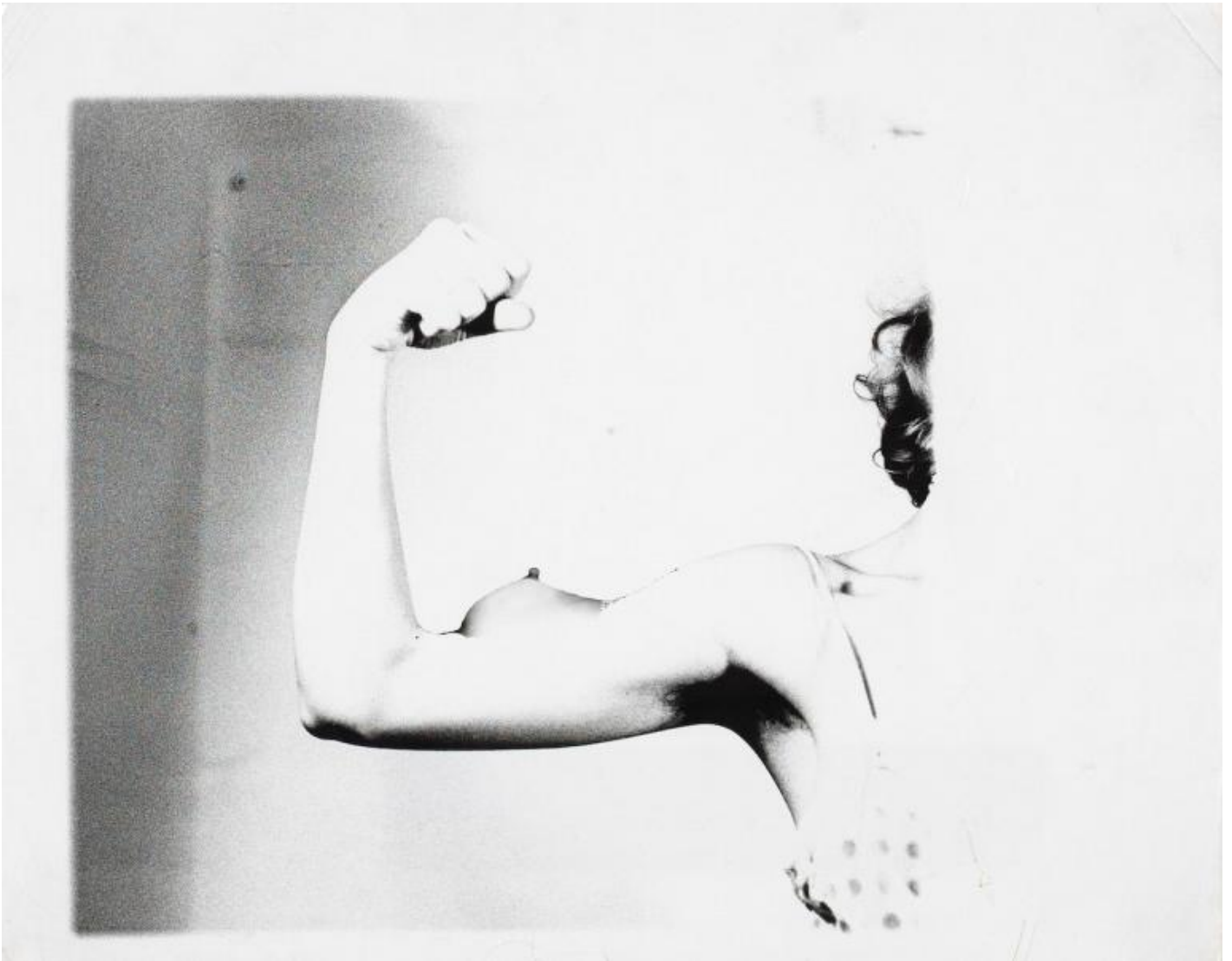
Birgit Jürgenssen Ohne Titel / Senza titolo, 1979 Fotografia in bianco e nero su carta baritata Cm 24 x 30 Estate Birgit Jürgenssen (ph23)