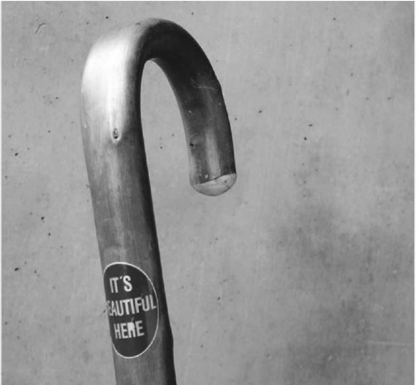
Bastone da passeggio di Lucius Burckhardt, "Here it is beautiful", multiplo 1993

Il Falso è l'Autentico è un libro denso, bellissimo e di un'attualità straordinaria quanto urgente. Sono le parole semplici e le intuizioni di un genio a cui in tanti dobbiamo moltissimo.