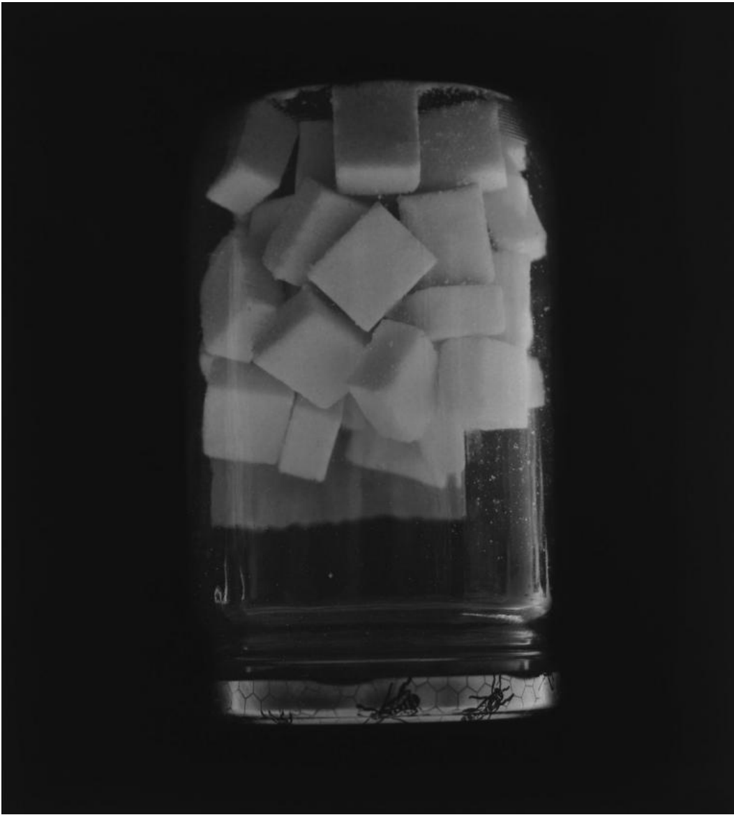
Franco Vimercati, Senza titolo, 1995 © Eredi Franco Vimercati

Il lavoro dell'artista italiano non è lontano in questo senso da quello di Berndt e Hilla Becher, la coppia di fotografi tedeschi che a partire dagli anni '60 ha praticato una fotografia che combina rigore documentario, riflessione teorica e associazione inconscia. Vimercati interpreta tuttavia il suo compito con maggiore coinvolgimento tattile ed emotivo. Anziché "oggetti" architettonici o impianti industriali osservati alla distanza ideale per mettere in luce i loro caratteri strutturali, i suoi sono oggetti quotidiani, intenzionalmente desueti, senza "stile", cose viste da vicino, direttamente maneggiabili, in molti casi significativamente connessi agli ambiti del corpo e dell'alimentazione (grattugia, lattiera, bicchiere, ferro da stiro, caffettiera, ecc.). Pure se circondati dal nero, ci sono sempre intorno a questi oggetti un interno domestico e degli abitanti vivi: ogni serie, come ha scritto Elio Grazioli su doppiozero , diventa così "anche una sorta di diario, perfino un racconto".