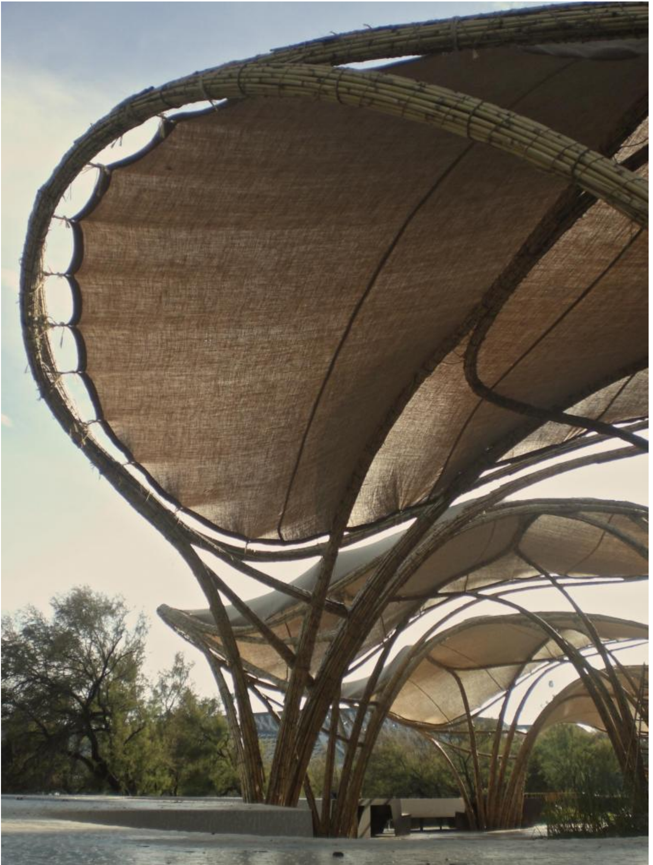
CanyaViva, Portico expo del agua, Saragozza, Spagna, 2008.