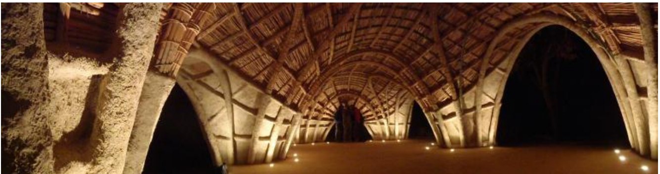
CanyaViva, Casa de Laila, Alhaurín el Grande, Malaga, Spagna, 2013.

trasmissione diretta dell'esperienza. A parte il bambù, che è una novità solo per l'Occidente, le altre si apprendono attraverso laboratori, workshop, incontri operativi dove si lavora direttamente sul campo, sporcandosi letteralmente le mani. L'aspetto dell'autocostruzione è centrale e rientra in una filosofia di vita che ha nell'autodeterminazione e nel pensiero libertario le sue radici. Sul livello tecnico invece è interessante notare come negli ultimi anni queste tecniche siano studiate e sviluppate dagli ingegneri più che dagli architetti. Questo significa che le loro proprietà fisiche sono talmente interessanti che vanno comunque oltre la filosofia che le ha fatte tornare alla ribalta.