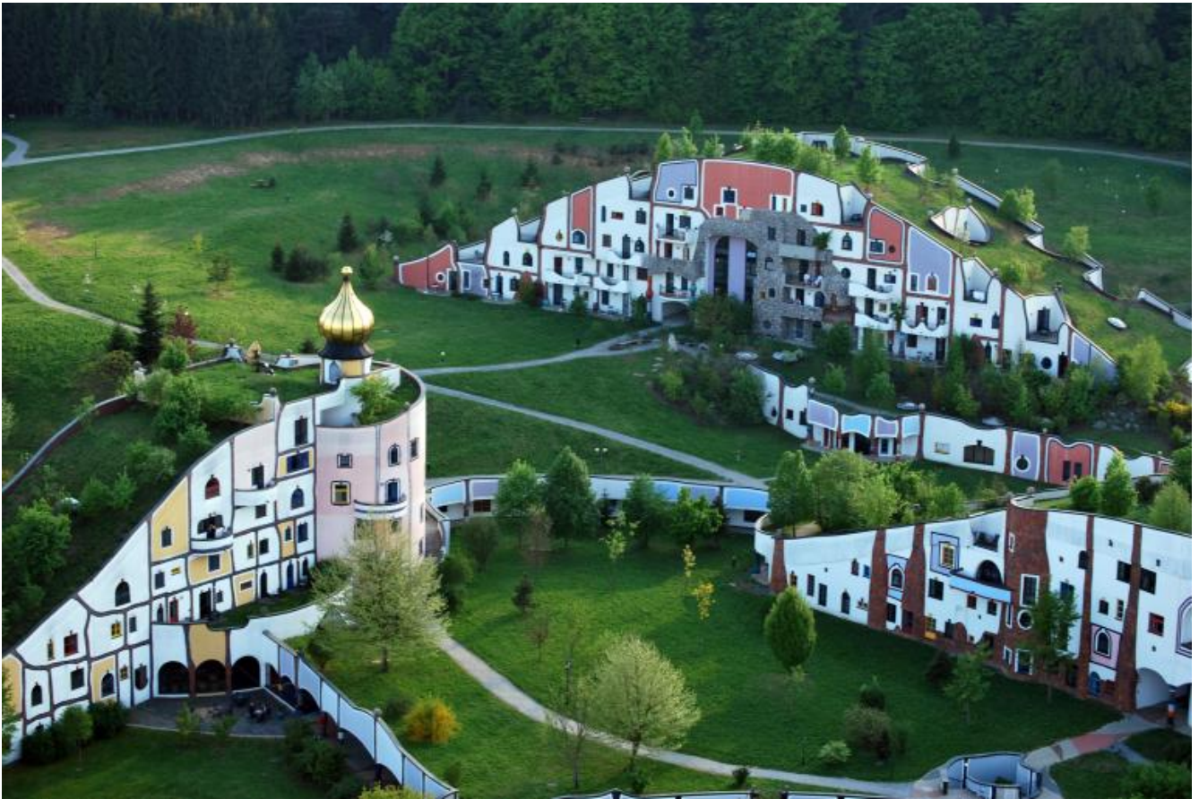
Hundertwasser, Termal Village Blumau, Styria, Austria, 1993.

Da qualche decennio si è sviluppata una nuova attenzione nei confronti del mondo vegetale, sono fioriti, è il caso di dirlo, studi sulla sensibilità, sull'intelligenza, sulla struttura sociale delle piante che da una parte iniziano a dare risultati pratici e dall'altra pongono interrogativi nuovi sulla natura stessa della coscienza, tradizionalmente legata al cervello, organo assente negli organismi vegetali, che però dimostrano di possederne una, più simile alla coscienza di uno sciame, ma a tutti gli effetti presente.