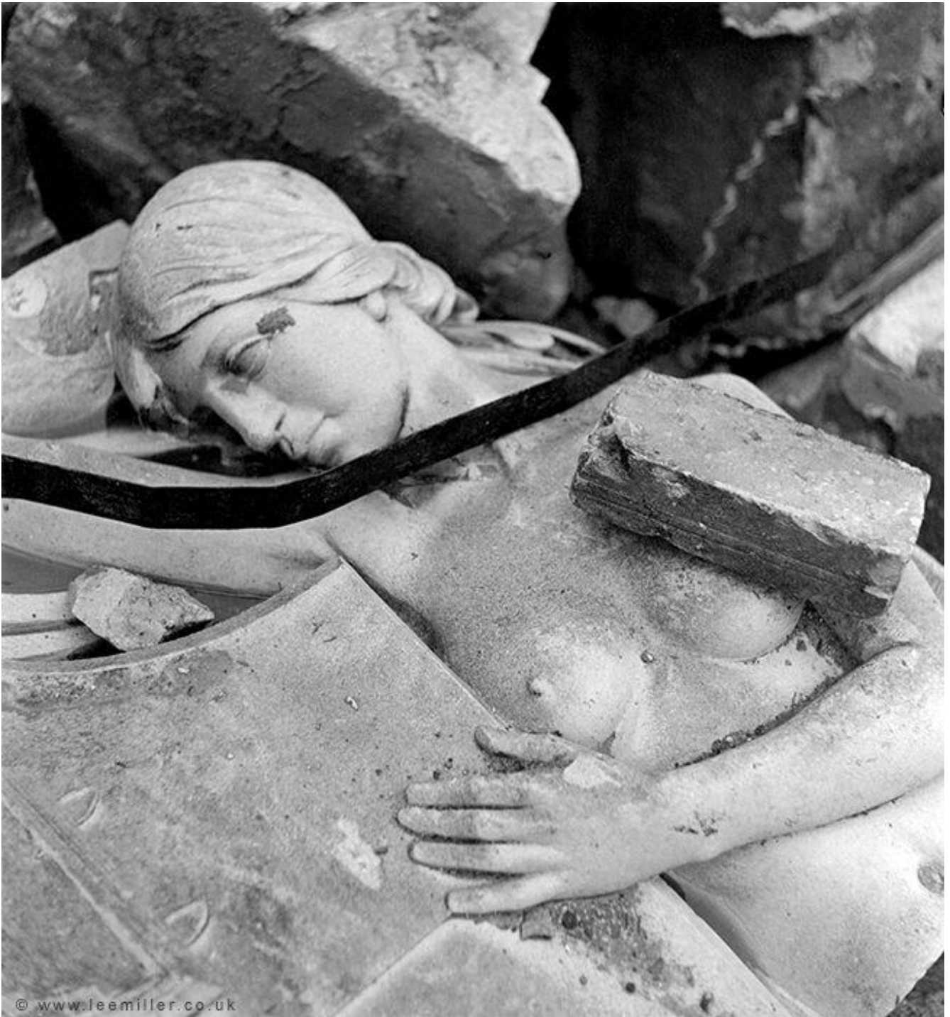
Lee Miller, Revenge on Culture, Grim Glory, London, England, 1940, © Lee Miller Archives England 2018. All Rights Reserved.