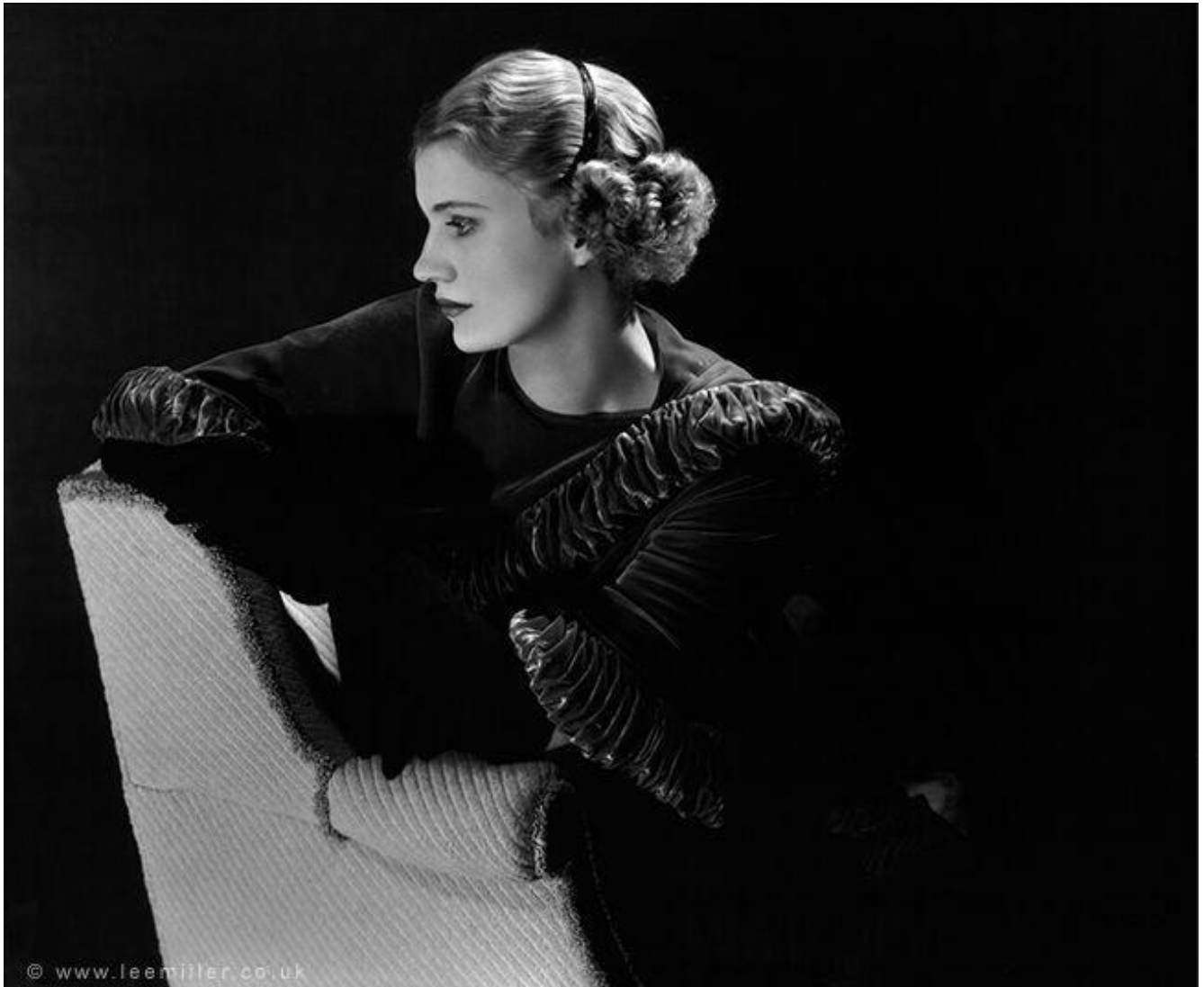
Lee Miller, Self Portrait

da lei vissuta sui fronti di guerra inghiottirà per sempre le sue fotografie e lei stessa sino all'oblio. L'ultima foto di Inge Morath è un autoritratto che sembra esprimere la volontà di restare innanzitutto dentro il suo sguardo. Se la prima si perderà metaforicamente nel pozzetto della sua Rolleiflex, la seconda riuscirà a sopravvivere all'obiettivo della sua Leica.