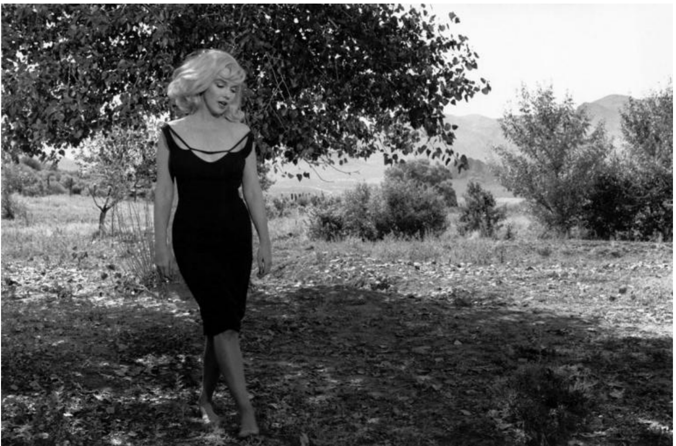
Inge Morath, Marilyn Monroe durante le riprese del film "The Misfits" a Reno, Nevada, USA, 1960

E questo attira l'attenzione di Robert Capa che li invita ad unirsi alla neonata agenzia Magnum a Parigi, Haas come fotografo e Morath come ricercatrice e redattrice. Da qui il passo è breve. Nel 1953 Inge realizza il suo primo reportage intitolato "Prete lavoratori", ed entra a far parte dell'agenzia come membro associato. Tra il 1953 e il 1954 avviene un altro incontro importante: Henri Cartier-Bresson, che accompagna nel 1960, per diciotto giorni, in un viaggio in auto che li porta da New York a Reno, nel Nevada, sul set di Gli Spostati , con Marilyn Monroe e Clarke Gable. Qui scatta uno dei suoi più bei ritratti: una Marilyn quasi scomposta che da sola, lontana dal set, esegue dei passi di danza, e conosce lo scrittore e drammaturgo Arthur Miller, sceneggiatore della pellicola, che diventerà suo marito.