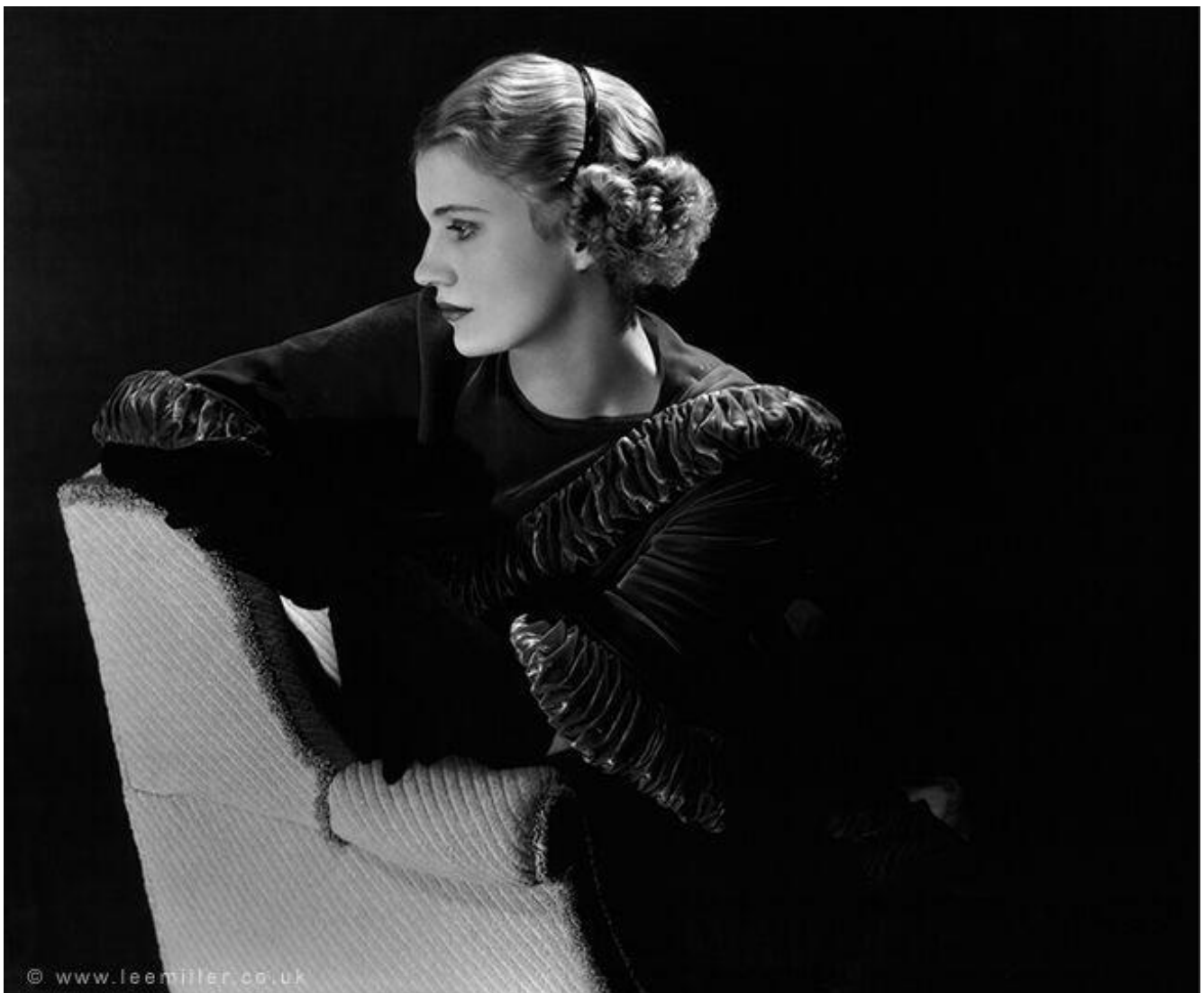
Lee Miller, Self Portrait

L'intervallo temporale che le separa, un ventennio quasi, segna anche una sorta di linea immaginaria che distingue le loro vite da ciò che hanno ritratto. Inge Morath non fotografa la Seconda guerra mondiale e i suoi drammi, mentre Lee Miller finirà risucchiata proprio nel nero di quel vortice temporale e l'esperienza da lei vissuta sui fronti di guerra inghiottirà per sempre le sue fotografie e lei stessa sino all'oblio. L'ultima foto di Inge Morath è un autoritratto che sembra esprimere la volontà di restare innanzitutto dentro il suo sguardo. Se la prima si perderà metaforicamente nel pozzetto della sua Rolleiflex, la seconda riuscirà a sopravvivere all'obiettivo della sua Leica.