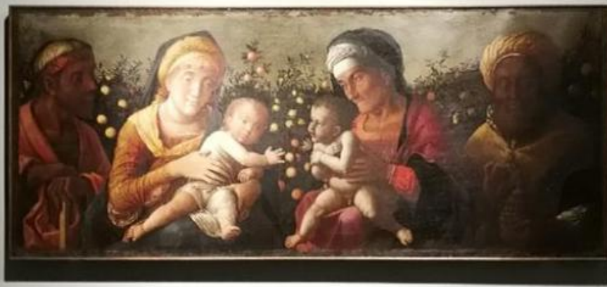
Andrea Mantegna, La Sacra Famiglia e la famiglia del Battista, 1504-1506, basilica di Sant'Andrea, Mantova.