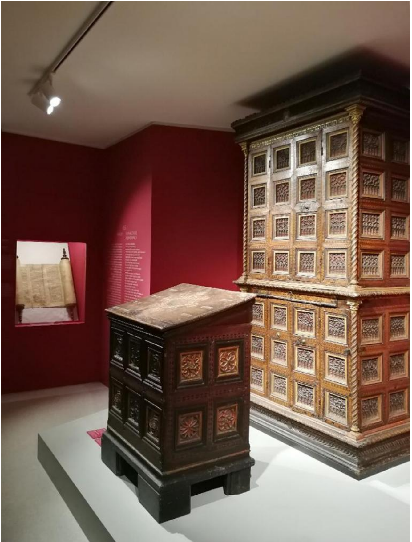
Arredi sacri sinagogali e rotolo in pergamena della Sefer Torah (Francia settentrionale, 1250 circa), Vercelli, Comunità Ebraica.