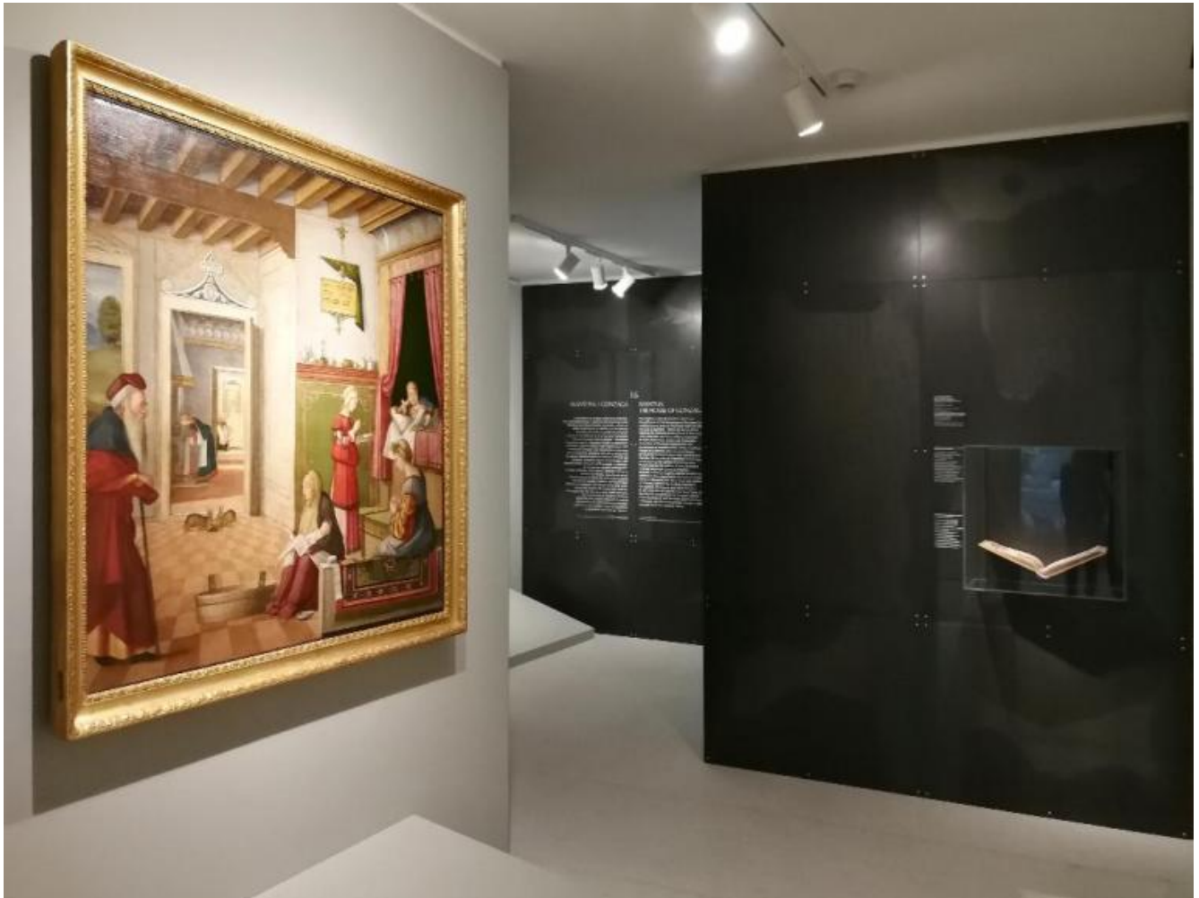
Veduta parziale della mostra con Nascita di Maria di Vittore Carpaccio, circa 1502-1507, Bergamo, Accademia Carrara.

interpretazione, ha l'attenuante che la cultura ebraica, alla quale la mostra fa riferimento, è una cultura del testo, anzi del Libro, nella quale non solo vige il divieto di "farsi immagini", ma talvolta anche la grafia stessa del testo è soggetta a restrizioni.