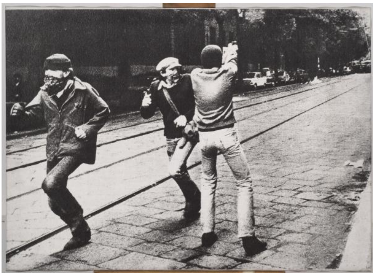
Mimmo Rotella, Scontro armato , 1980

Un diverso caso di prelievo e riuso dello scatto di via De Amicis si ritrova in Lui piange (1977), opera su tela emulsionata con interventi pittorici dell'artista toscano Gianni Bertini (1922-2010) che, a differenza di Rotella, modifica e riambienta la foto originaria attraverso un processo di montaggio, in cui immagini di natura e provenienza eterogenea vengono accostate, correlate, giustapposte, al fine di creare soluzioni visive inedite, altamente traumatizzanti. L'opera fa parte del ciclo Abbaco , titolo volutamente desueto scelto da Bertini per indicare il desiderio di ricominciare un discorso partendo dalla base, dall' abc , il cui fulcro centrale, seguendo le parole dell'artista, sia la rappresentazione del nucleo più elementare "l'uomo, la donna e il bambino in rapporto a una società dove l'orrore è quotidiano". La foto degli scontri milanesi, al pari delle altre immagini di catastrofi o guerre introdotte da Bertini in questa serie, viene ad assumere un valore assoluto di violenza, autodistruzione, morte.