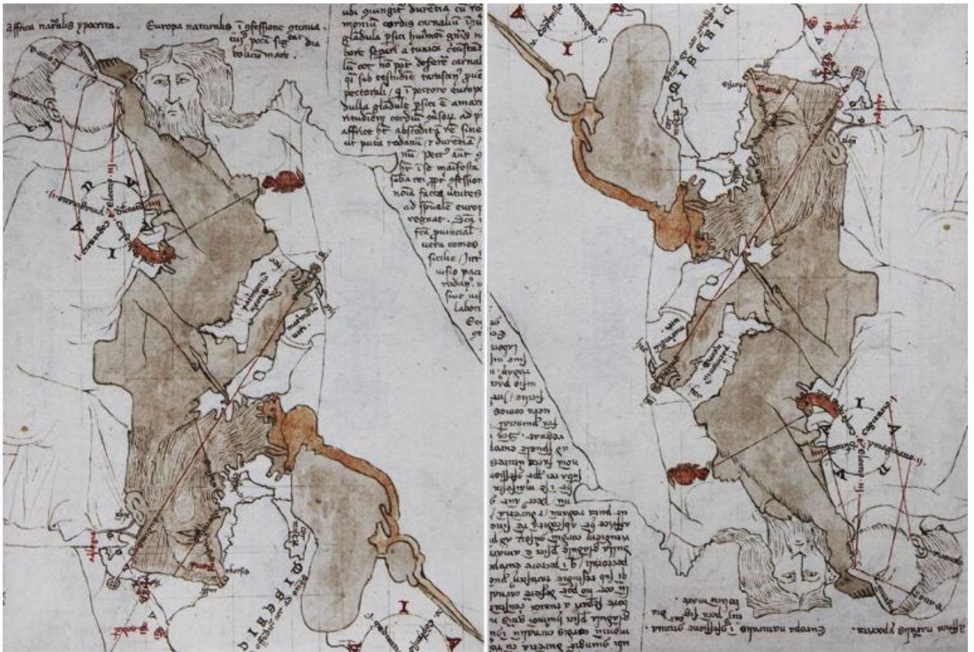
Opicino de Canistris, carta Vaticanus latinus (6435,f.61r.), Biblioteca Apostolica Vaticana, Città del Vaticano.

Su queste carte il pensiero si muove anche per associazioni fonetiche. Per esempio l'identificazione di Venezia con la castrazione dei genitali deriva dal gioco di parole sull'espressione castra Venetorum (p. 150) usata per indicare la città lagunare. Quello di Opicino è decisamente un pensiero di tipo associativo che utilizza tutti i dispositivi visivi e linguistici atti per raggiungere una profondità, che alcuni hanno interpretato in chiave psichiatrica o psicanalitica, altri in chiave culturale. Lo scopo di Sylvain Piron è infatti “comprendere Opicino come sintomo di una situazione storica particolare” (p. 47). Riferendosi alla “psicologia storica dell'espressione”, alla quale Aby Warburg dedicò i suoi studi, l'autore sostiene che il dramma psichico di Opicino è quello che lo storico dell'arte designava come “dialettica del mostro”: il dramma di una cultura tormentata da antinomie, che trovano nelle carte dello scriba alla corte pontificia di Avignone una sua coerente espressione. Sono le stesse antinomie, le stesse contraddizioni che emergono dalla disputa tra il chierico e il laico Lullo.