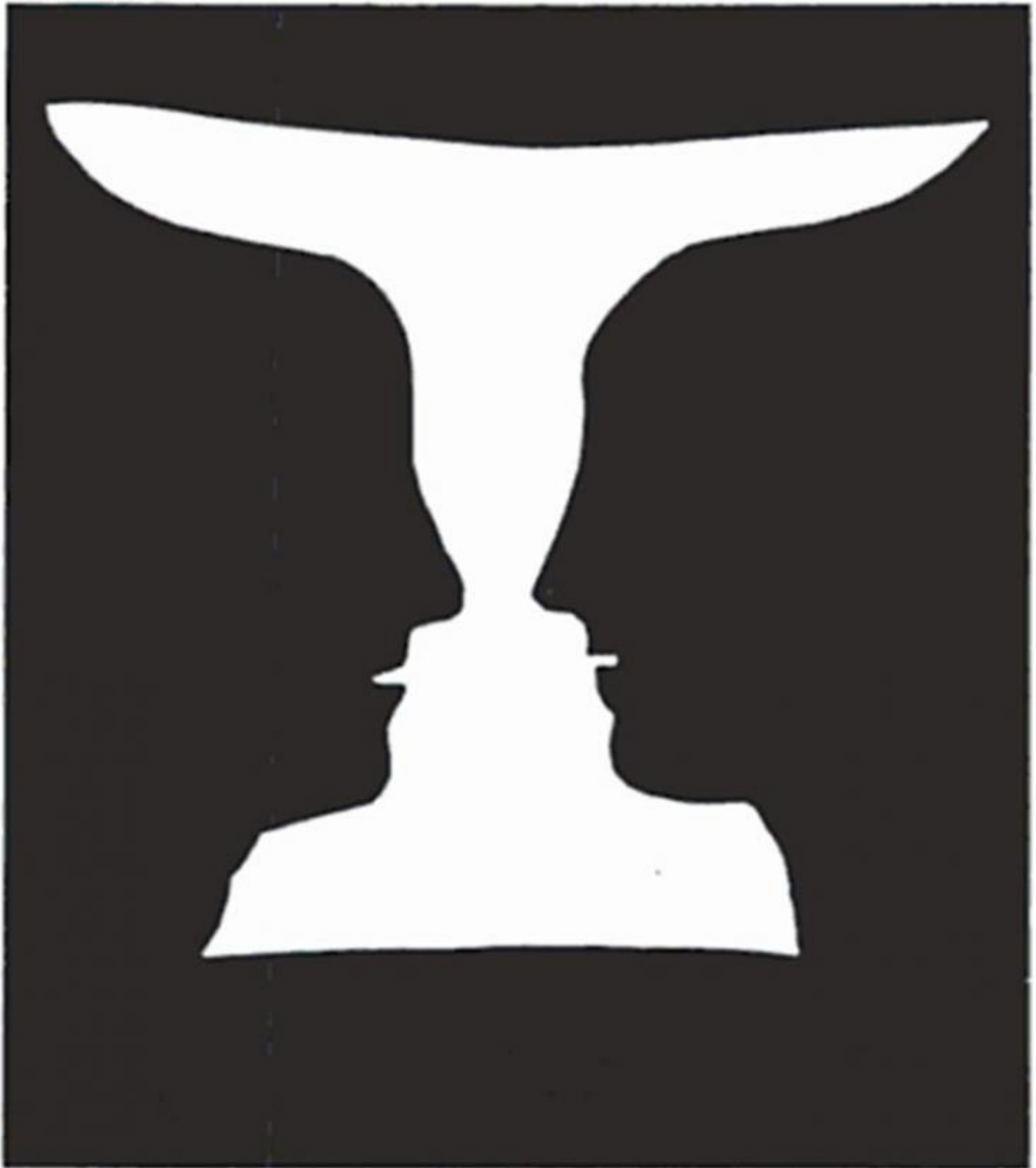
Figura 14 tratta da Edgar Rubin, Synsoplevede Figurer. Studier i psykologisk Analyse, Gyldendalske Boghandel Nordisk Forlag, Copenhagen 1915.

Alla sconcertante autobiografia di Opicino e alla tavole che la corredano, lo storico medievista Sylvain Piron ha dedicato un saggio ( Dialettica del mostro. Indagine su Opicino de Canistris , Adelphi, Milano 2019) nel quale descrive il fenomeno d'inversione figura/sfondo come "percezione simultanea del negativo e del positivo" (p. 16). In realtà determinate aree di un campo visivo hanno forma solo per un dato tempo: non si possono vedere simultaneamente ma solo alternativamente. Non è un distinguo irrilevante perché l'alternanza