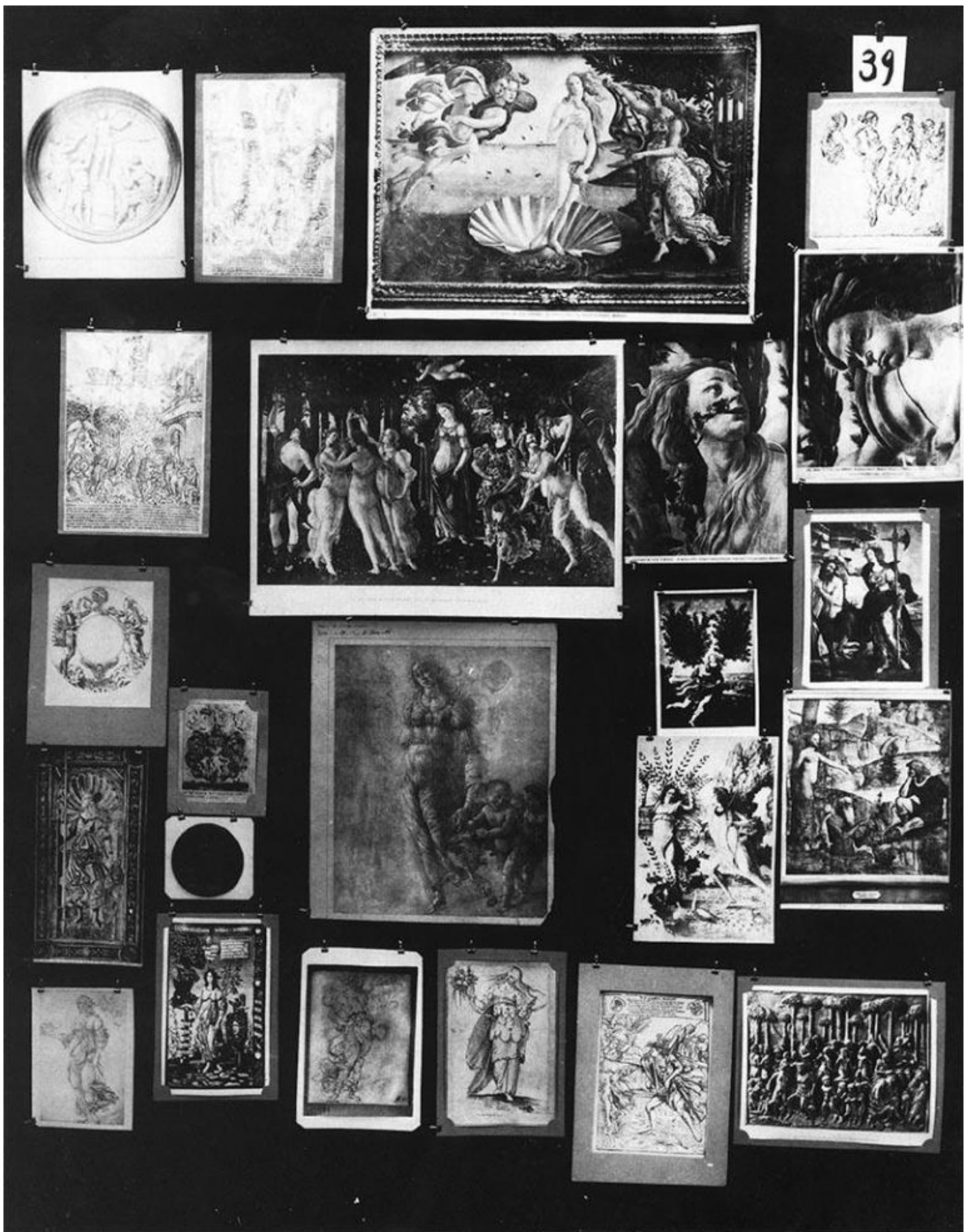
Aby Warburg, Mnemosyne , Tavola 39. Espressione emblematica delle formule di pathos è il motivo della ninfa, della figura femminile in movimento, nella quale la componente psicologica prevale su quella formale,