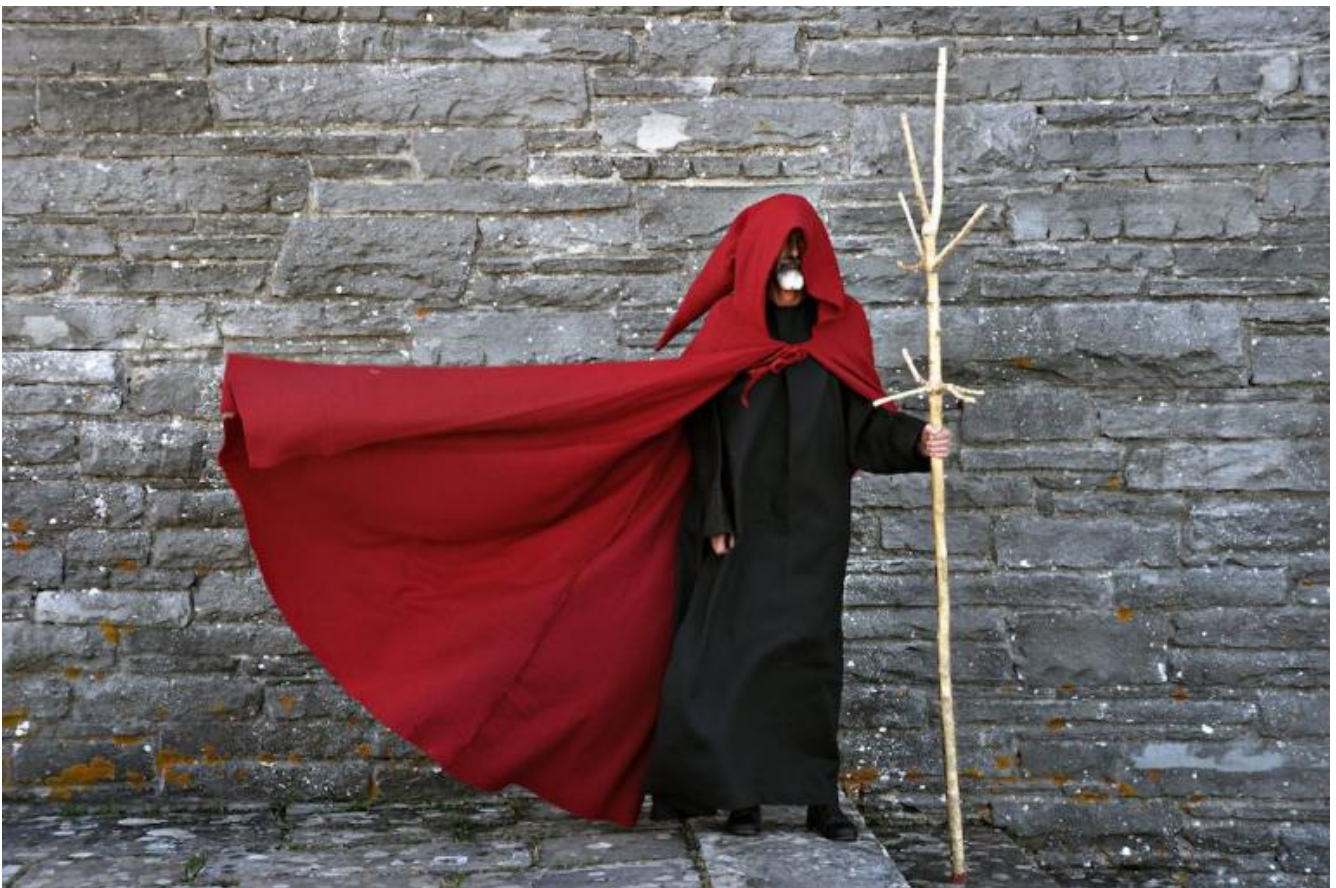
Pro e contra Dostoevskij, ph. Franco Guardascione.

Si sale, verso un altro spiazzo, con un nudo materasso, dove l'uomo intabarrato racconta un suo viaggio in Europa, il crollo delle certezze in quel mondo di economia e consumi, la necessità di provare a oltrepassare i limiti, con stridenti suoni della Sequenza di Berio per viola che lo accompagna e poi si disfa in voci dissonanti. La bella colonna sonora di stridori e rapimenti è composta da Patrizio Barontini montando musiche del Novecento, atmosfere elettroacustiche, campane che spesso accompagnano il risveglio o comunque il risuonare di voci nuove nella coscienza; comprende anche motivi religiosi, con l'apparizione del Bach del Vangelo secondo Matteo di Pasolini nella cripta. La bambina, con uno scudo, come angelo o immagine archetipica, in una camminata in campo lunghissimo fa da contrappunto lento, rituale, d'anima profonda, alla frenesia di sperimentazione dell'arbitrio, dell'abisso, dell'uomo.