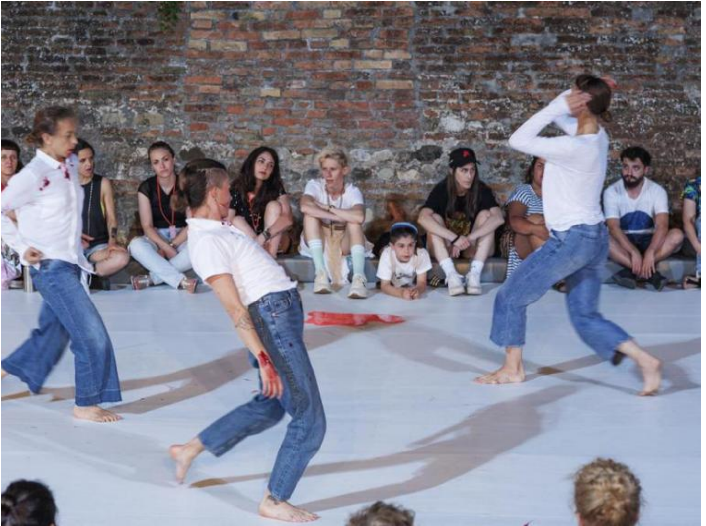
Ultras sleeping dances.