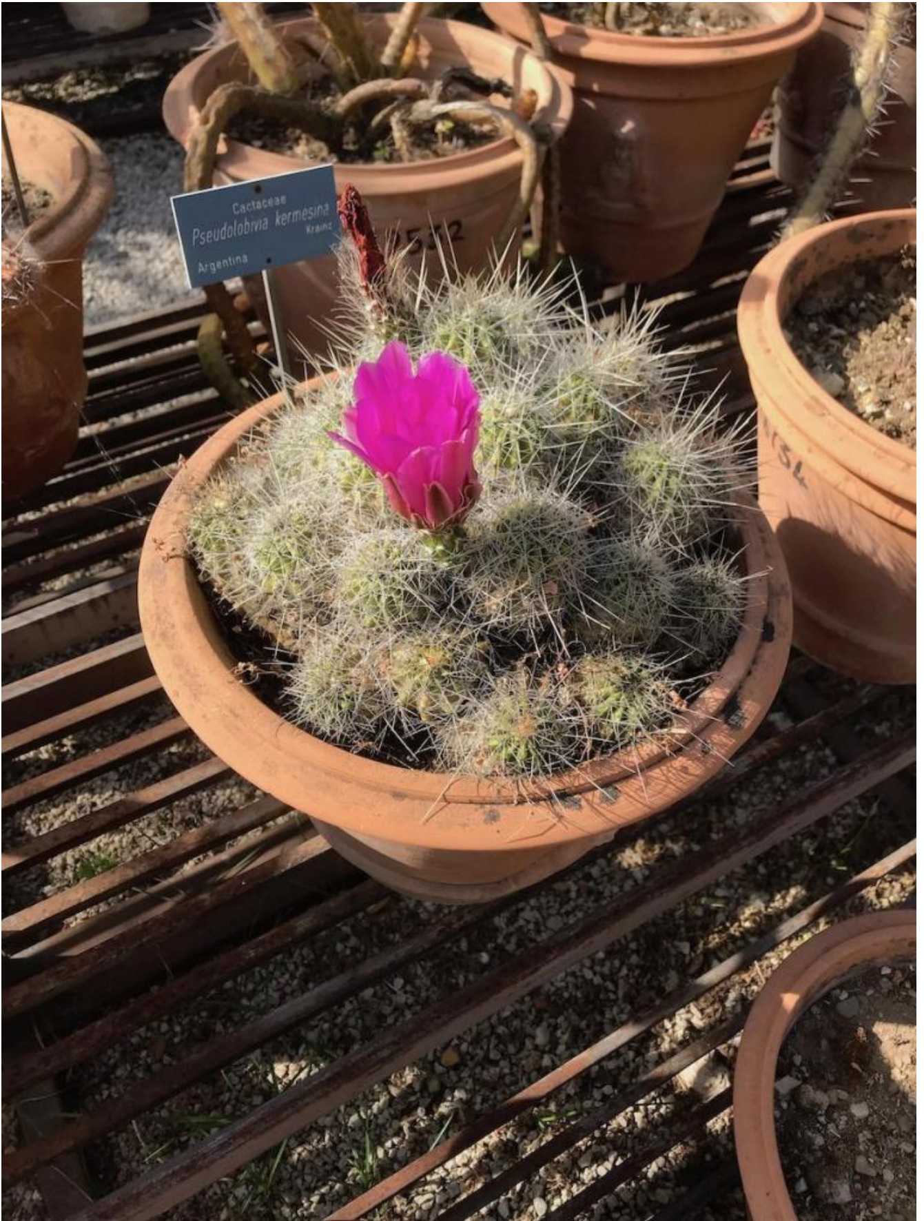
Cactaceae Pseudolobivia kermesina Argentina