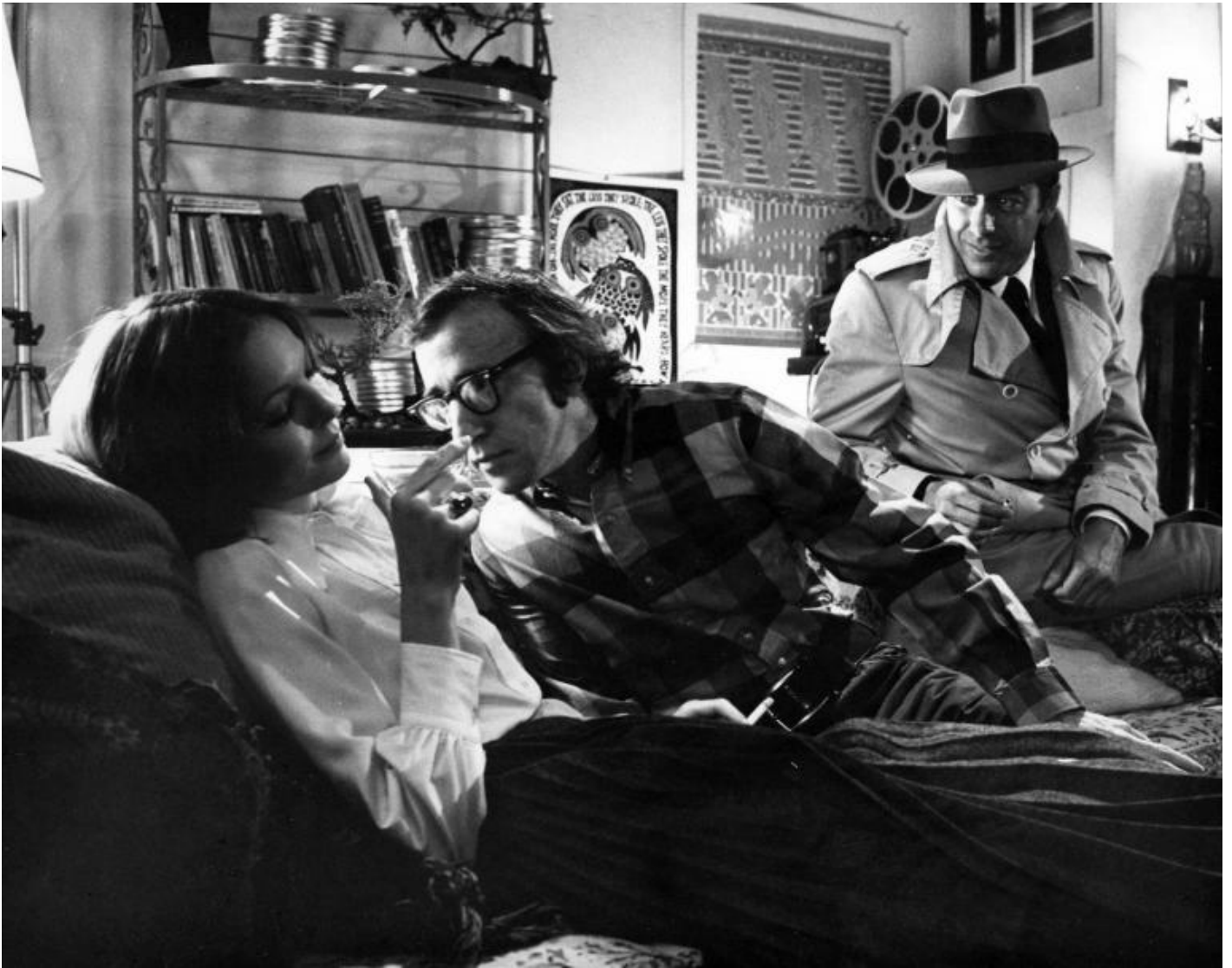
Diane Keaton, Allen, Jerry Lacey in "Provaci ancora, Sam", 1972.