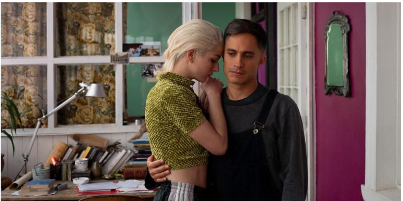
Mariana di Girolamo e Gael García Bernal in Ema, di Pablo Larraín

Ema di Larraín, in questo senso, è un film altrettanto complicato, e perfino bizzarro e straniante, tanto sul piano dell'uso di linguaggi diversi (la danza, la musica) usati per fare cinema, quanto sul piano della costruzione di un personaggio inafferrabile, fisicamente e emotivamente: