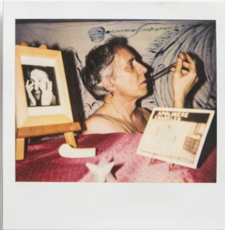
Rosa Foschi, 10x10 cm, Luca Patella, dis-enameled 1, 1989.

Secondo il parere di chi scrive, il lavoro della film-maker, fotografa e pittrice Rosa Foschi non può essere compreso senza far riferimento a tale concetto di straniamento.