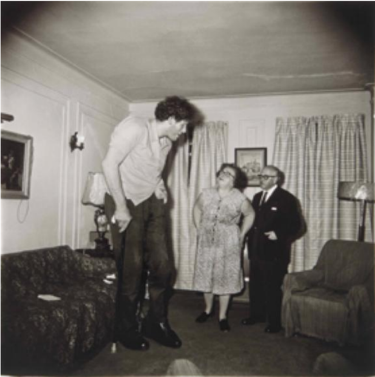
Diane Arbus, A jewish giant at home with his parents in the Bronx NY 19.

Se pensiamo a ciò che scriveva Aristotele: “la natura passa gradatamente dagli esseri inanimati agli animali in modo che a causa della continuità la linea di demarcazione che separa gli uni dagli altri è sfumata e non è possibile determinare a quale dei due gruppi appartenga la forma intermedia. Così dopo la classe degli inanimati viene subito quella delle piante e fra esse una specie differirà dall’altra perché sembra partecipare maggiormente dei caratteri della vita. L’intero mondo vegetale, se lo si paragona ai corpi inorganici, appare in qualche modo dotato di vita, mentre paragonato agli animali appare inanimato”, possiamo dire che l’odierna concezione naturalistica della vita si discosta molto dalla progressiva linearità evolutiva, più nell’ordine invece della sincronicità.